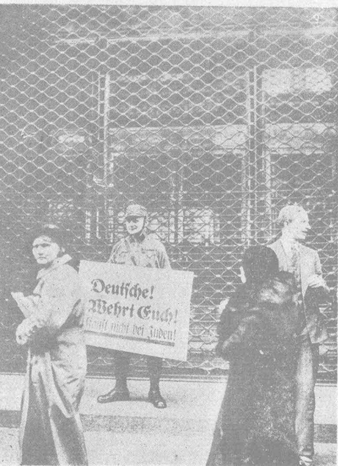
(上) 希德拉黨之書籍大檢查 (用汽車載運馬克思主義的書籍) (下) 希德拉黨之反猶太人運動 (勸人不要向猶太商店購物)