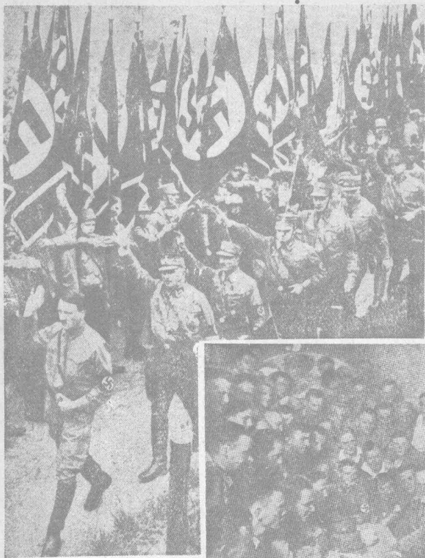
希德拉與其黨徒的遊行