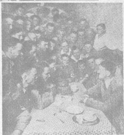
希德拉在褐色大廈