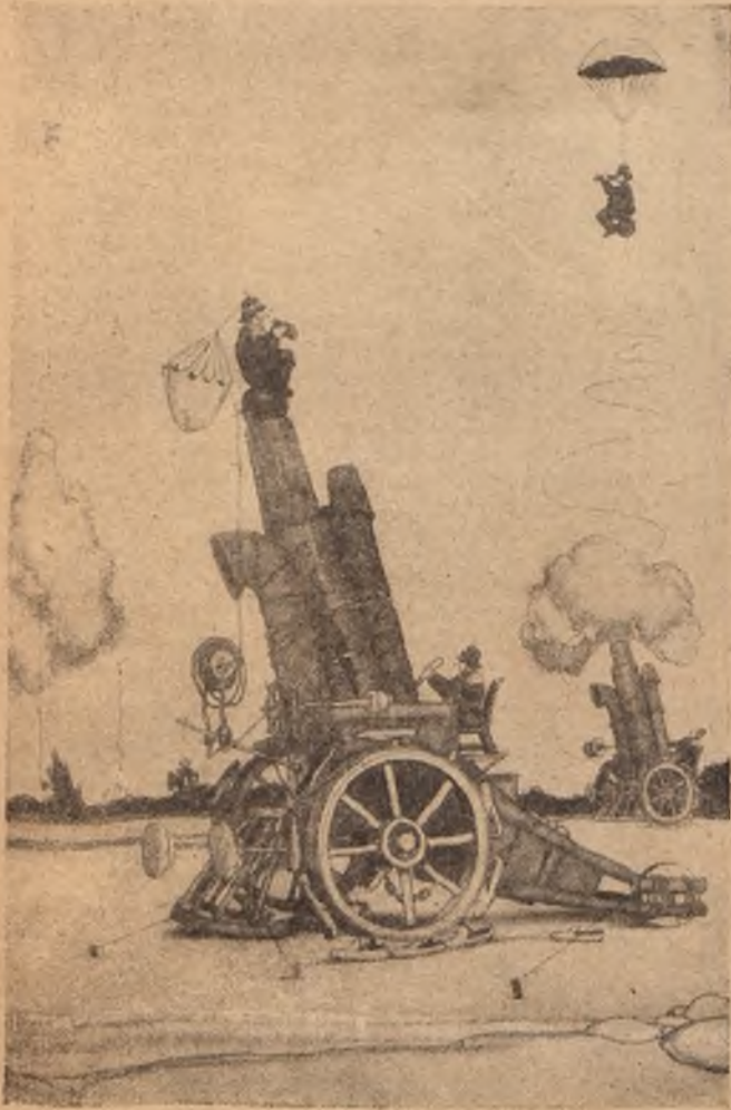
Большая мортира для выбрасыванія воздушныхъ развѣдчиковъ.