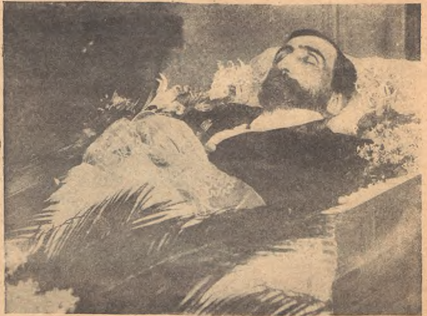
Министръ народнаго просвѣщенія Л. А. КАСО († 26 ноября) въ гробу. (Съ фот. Я. Штейнберга).