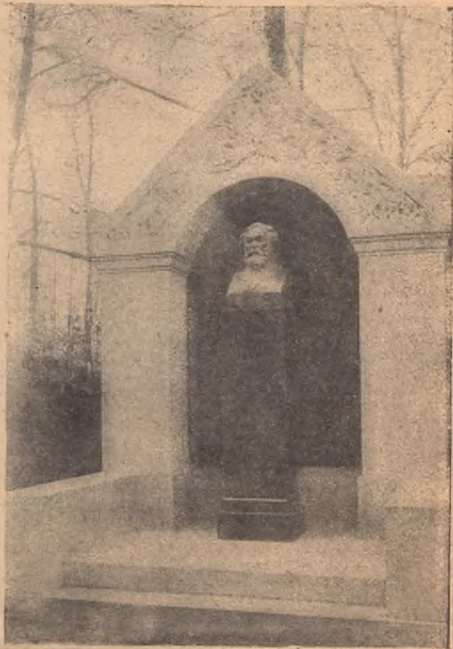
Открытый на-дѣлахъ памятникъ знаменитому художнику А. П. Куинджи, оставившему свое миллионное состояніе на благотворительныя дѣла, главнымъ образомъ—на поддержку начинающихъ художниковъ.