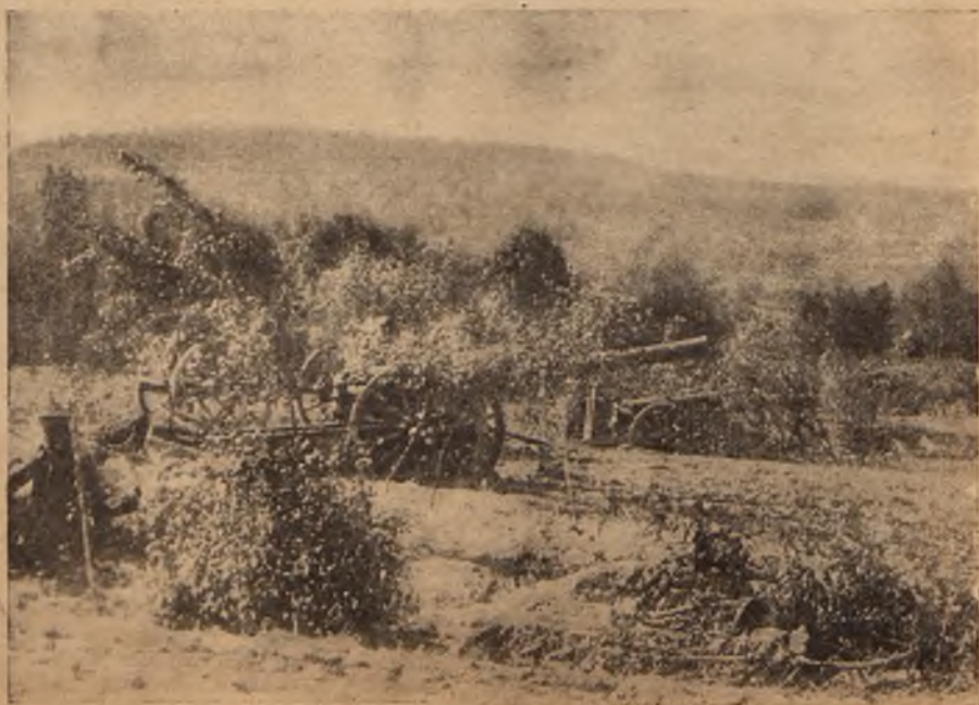
Англійская батарея, замаскированная въ кустахъ, на сѣверномъ побережьи Франціи.

за лѣтніе мѣсяцы пятнадцать-двадцать тысячъ, а остальную часть года Арсень-