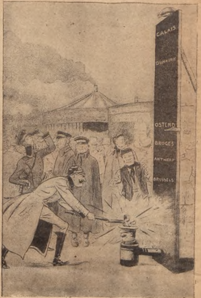
СИЛУ ПРОБУЕТЪ. Выше Остенда никакъ не идетъ!