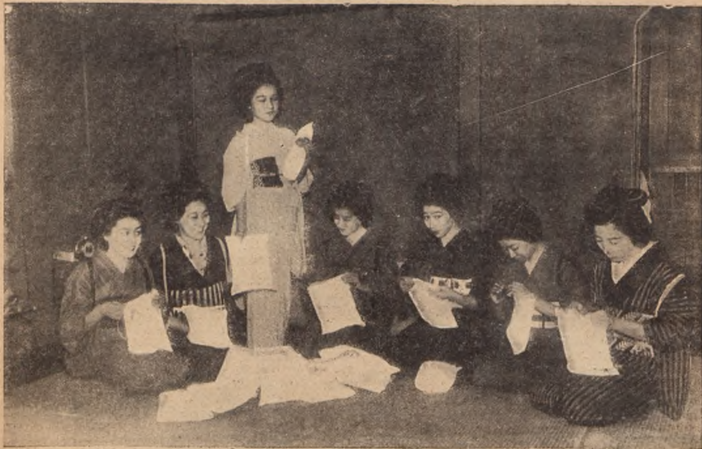
Июпекія гейши цѣлыми днями сидятъ за работой по изготовленію подарковъ солдатамъ, находящимся на театрѣ войны. (Съ фот. С. Левковича).