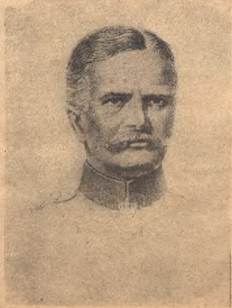
Генералъ фонъ-Макензель, командующій германской арміей, дѣйствующей въ лодзинскомъ районѣ. Недавно онъ получилъ личное письмо отъ Вильгельма съ благодарностью за то, что ему удалось спасти свои корпуса изъ желѣзныхъ тисковъ русской арміи.

поезда—меньше дѣтской игрушки! Людей совсѣмъ не было видно; только по двигающимся сѣрымъ пятнамъ, приплюснутымъ къ поверхности земли,