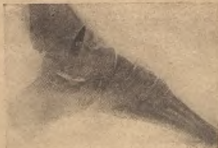
Осколокъ нѣмецкаго мортирнаго снаряда въ стопѣ французскаго офицера.