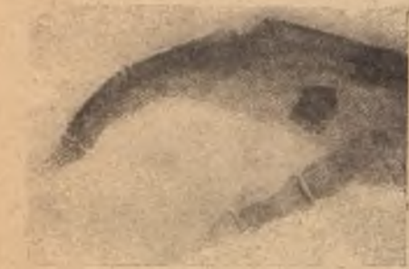
Осколокъ нѣмецкой гранаты въ кисти французскаго солдата. На осколкѣ замѣтенъ слѣдъ винтовой нарезки.