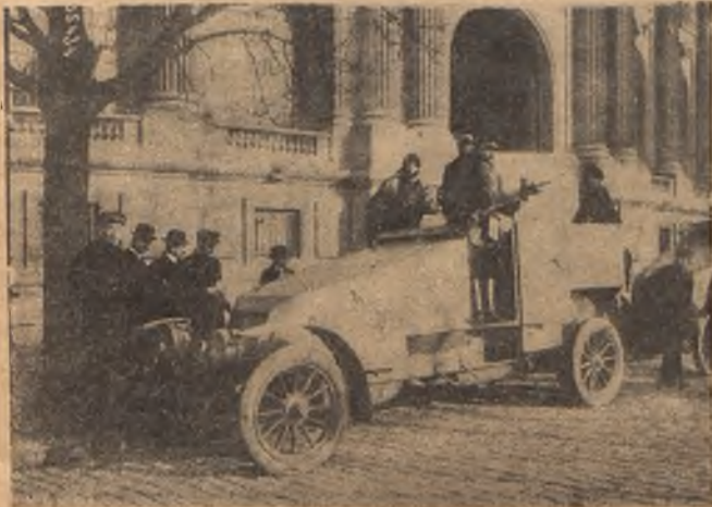
Новый типъ французскихъ бронированныхъ автомобилей, снабженныхъ небольшими орудіями и пулеметами. На автомобили эти посажены морскіе стрѣлки.

Поскился ксендзь, не хотѣлось ему пускать нежеланныхъ гостей, онъ велъ переговоры съ ними, не выходя изъ дома, изъ верхняго этажа, въ окно.