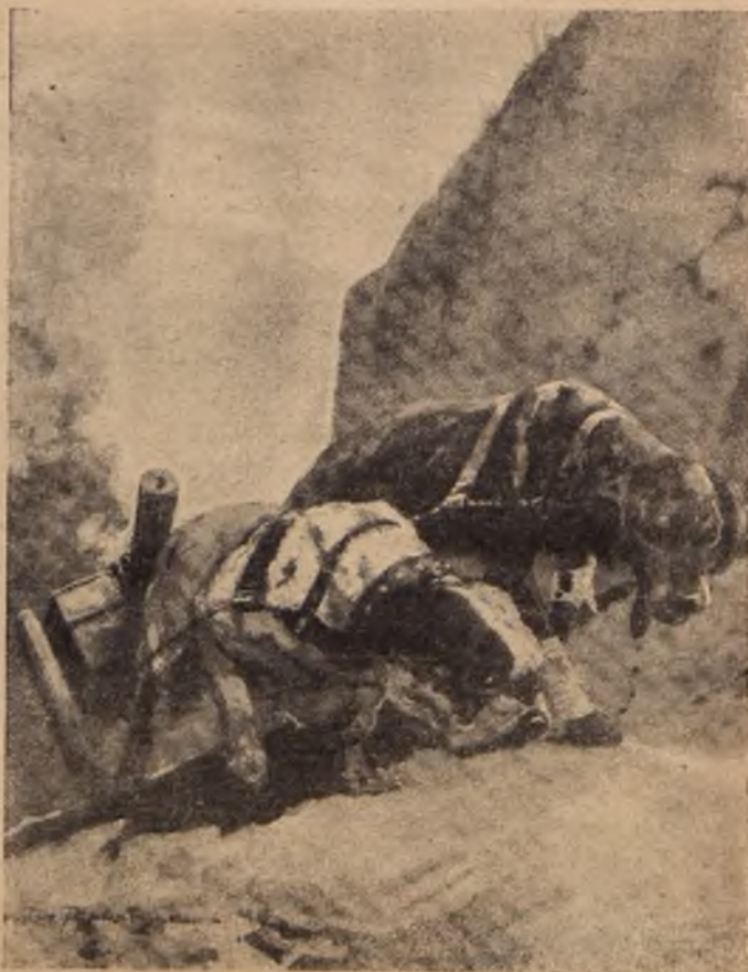
Собаки, привезенныя въ бельгійской и англійской арміяхъ для перевозки легкой горной артиллеріи, усердно и несутъ свою тяжелую службу. Какъ видно рисунокъ, одна изъ собакъ (лѣвая) получила уже въ походѣ рану, в лапы ея перевязаны.

Обрадовались австрійки, что стрѣлять не будутъ, и