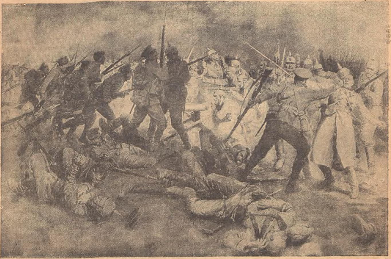
У Ипра, когда немцы уже торжествовали победу, английская пехота могучим натиском смяла и отбросила корпус прусской гвардии и решила участь сражения в пользу союзников.