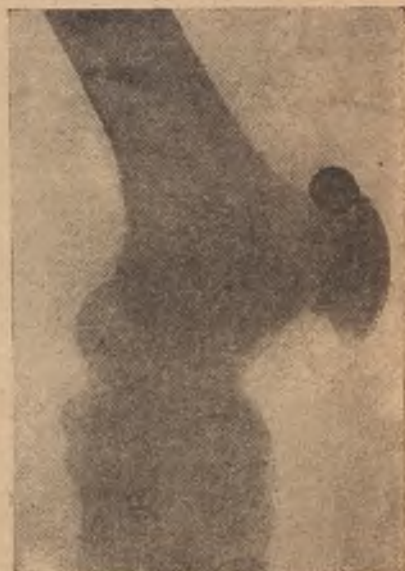
Французская прапелъная пуля въ плечѣ нѣмецкаго солдата.

раскрывъ глаза, онъ, какъ и я, съ изумленіемъ прислушивался къ пѣлю чуждаго и враждебнаго ему армянина.