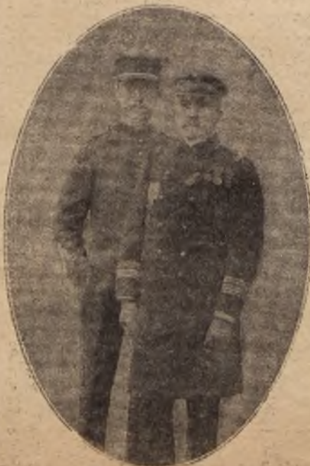
Извѣстный французскій писатель Шеръ Лотп, большой знатокъ жизни балканскихъ народовъ, и его сыгъ, оба въ мундирахъ офицеровъ французской арміи.