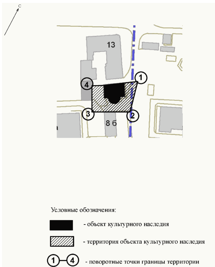
СХЕМА ГРАНИЦ ТЕРРИТОРИИ ОБЪЕКТА КУЛЬТУРНОГО НАСЛЕДИЯ РЕГИОНАЛЬНОГО ЗНАЧЕНИЯ "ЖИЛОЙ ДОМ (ЖЭУ-8 ВОЛГОГРАДСКИЙ ТЕРРИТОРИАЛЬНЫЙ УЧ-К)", РАСПОЛОЖЕННОГО ПО АДРЕСУ: ВОЛГОГРАДСКАЯ ОБЛАСТЬ, Г. ВОЛГОГРАД, ВОРОШИЛОВСКИЙ РАЙОН, УЛ. БАЛАШОВСКАЯ, 11

Приложение 2 к приказу министерства культуры Волгоградской области от 18 декабря 2013 г. N 01-20/436