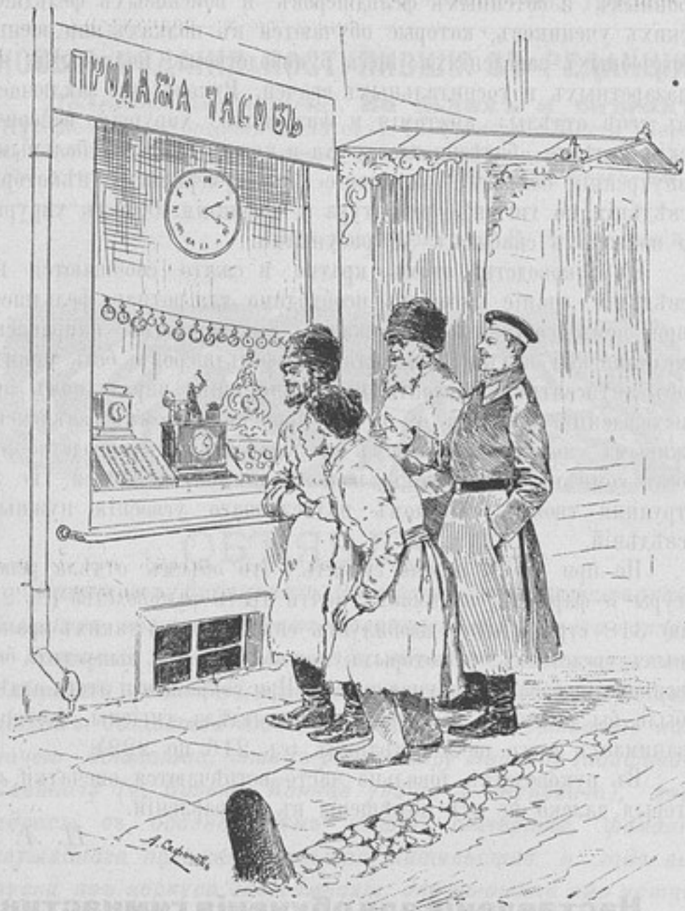
Прогулка съ земляками

Въ лагерѣ офицеры помѣщались въ тѣхъ же огромныхъ парусинныхъ шатрахъ, въ которыхъ жили кадеты. Входы въ эти шатры были сдѣланы съ узкихъ сторонъ ихъ. На обоихъ концахъ шатровъ были отдѣлены парусинными перегородками небольшія помѣщенія для офицеровъ. Офицерское помѣщеніе располагалось по одну сторону входа въ шатеръ, а по дру-