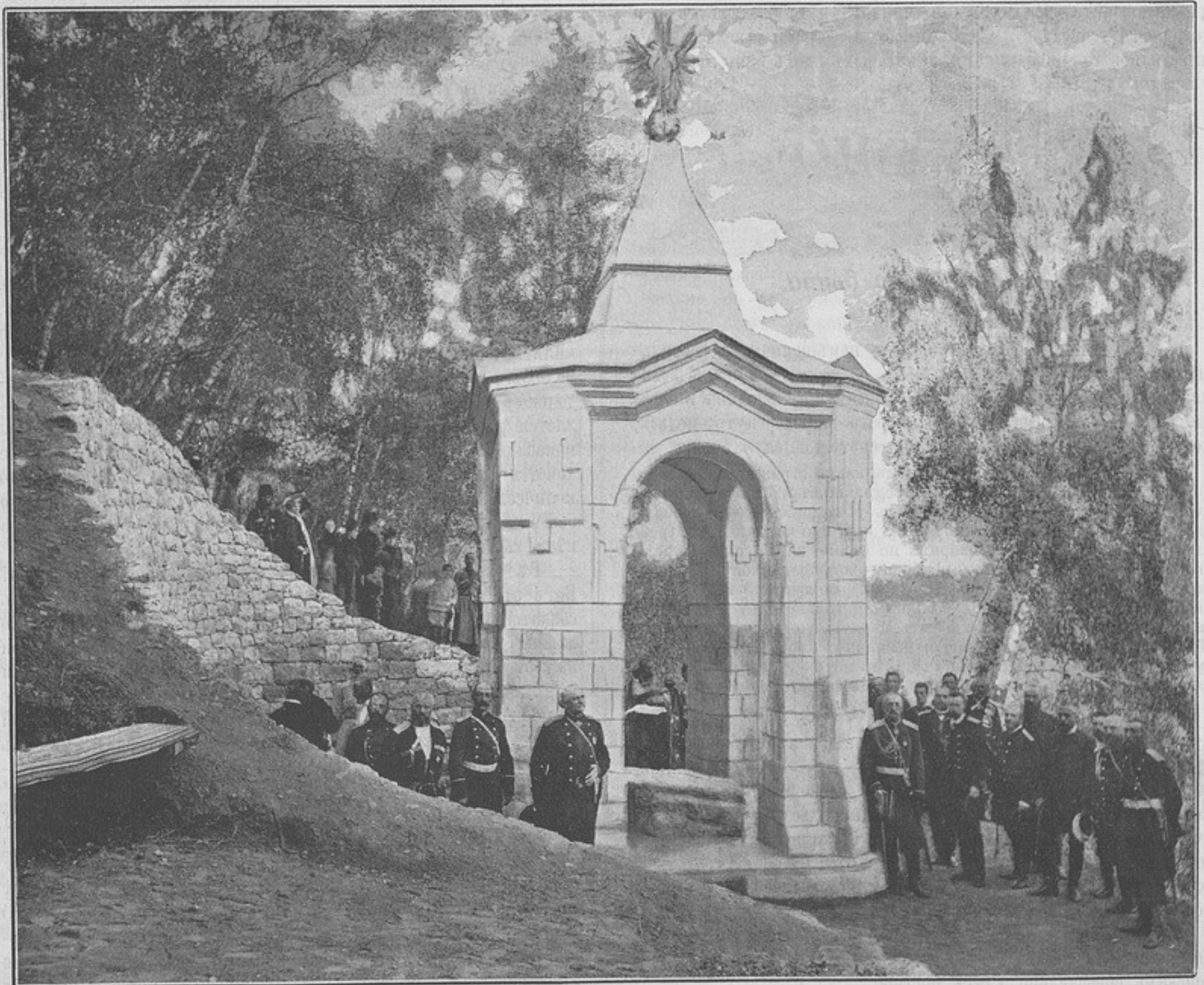
Освященіе памятника надъ камнемъ князя Барятинскаго на Гунибѣ въ присутствіи Е. И. В. Великаго Князя Георгія Александровича въ 1893 г. (къ статьѣ «Поѣздка на Гунибѣ»).

Освященіе памятника надъ камнемъ князя Барятинскаго на Гунибѣ въ присутствіи Е. И. В. Великаго Князя Георгія Александровича въ 1893 г. (рисунокъ). — Изъ циркуляровъ Главнаго Штаба. — Изъ военнаго быта. Я. Гребенщиковъ. — Цѣна славы во время первой Имперіи. М. Драгомировъ. — Поѣздка на Гунибѣ (съ рисунками). Л. Н. С. — Ходъ обученія въ нашей конницѣ за послѣднее двадцатилѣтіе. К. Вольфъ. — Отцы-командиры. Старый кадетъ. — Новыя изданія: Солдатская библиотека З. — Воинички Буквар. Коста Юкинъ. — Правила и программы для поступленія вольноопредѣляющимися и въ юнкерскія училища. И. Зацукъ. И-ъ. — Руководство для ротныхъ фельдшеровъ и фельдшерскихъ учениковъ. А. И. Барановъ. И. Л. — Наставленіе для обученія гимнастикѣ въ артиллеріи. Изданіе В. Березовскаго. В. Туровъ.