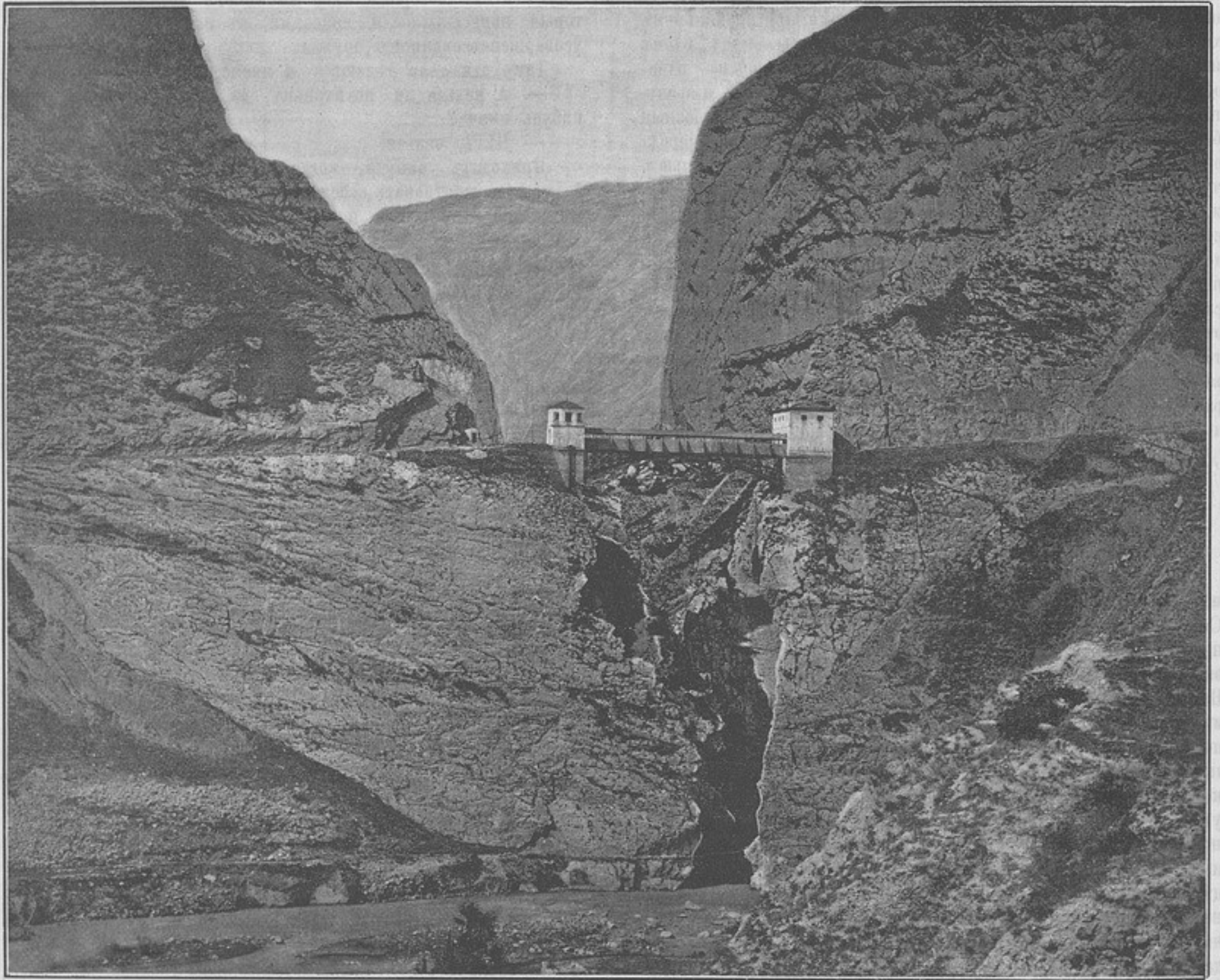
Георгиевскій мостъ черезъ рѣку Кара-Койсу въ 11 верстахъ отъ Гуниба (къ статьѣ «Поѣздка на Гунибъ»).