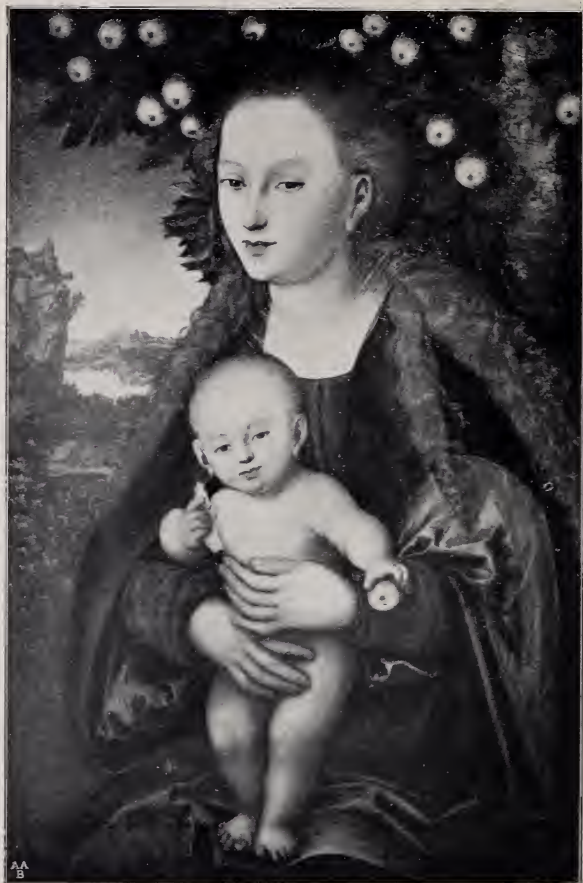
No. 82. Die Madonna unter dem Apfelbaum. ( St. Petersburg. )