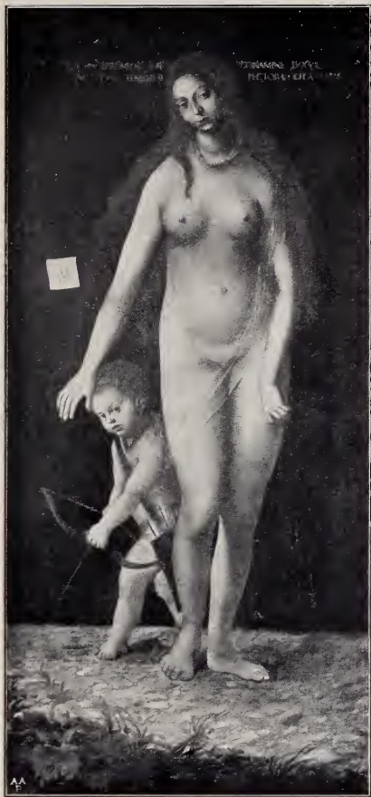
No. 5. Venus und Amor. (St. Petersburg.)