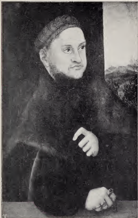
No. 74. Bildnis des Kurfürsten Friedrichs des Weisen. (Dresden bei S. K. H. dem Prinzen Georg.)