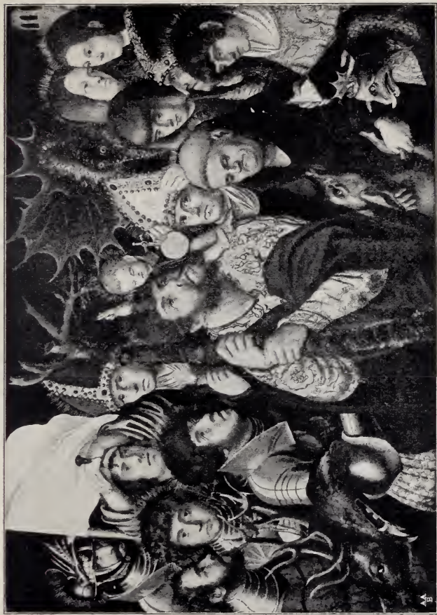
No. 98. Die vierzehn Nothelfer. (Torgau.)