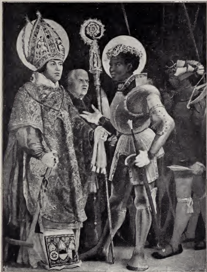
No. 204A. Der heilige Mauritius und der heilige Erasmus. Münchener Pinakothek No. 281 (Matth. Grünewald).