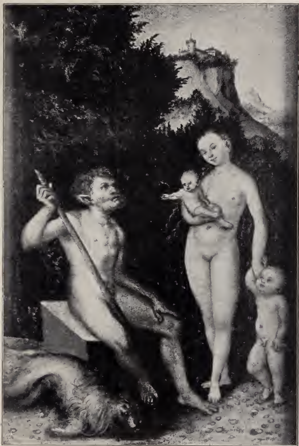
No. 85. Nackte Faunen-Familie. (Donaueschingen.)