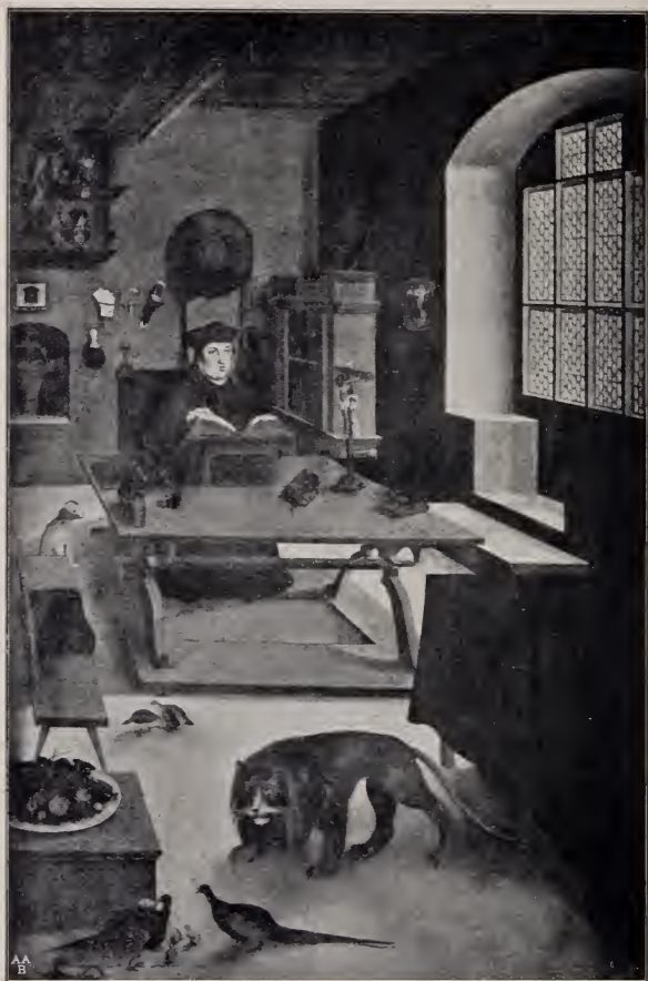
No. 22. Kardinal Albrecht von Brandenburg als hl. Hieronymus im Gemache. (Darmstadt.)