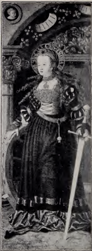
No. 103a. Vom Halle'schen Altar: Innenseiten der äusseren Flügel: Magdalena und Katharina. (Halle.)