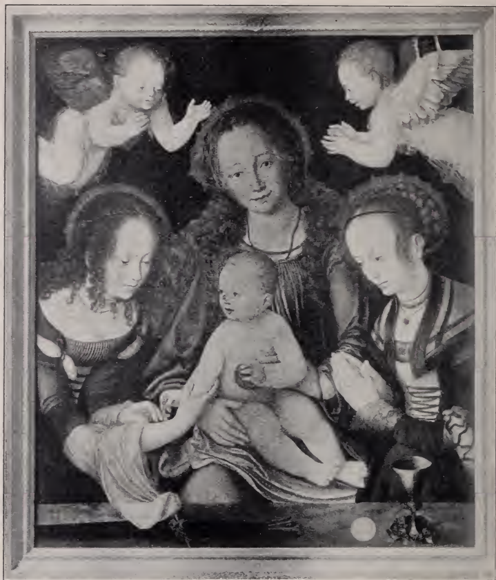
No. 127 A. Flügelaltar, Mittelbild: Vermählung der hl. Katharina. (Wörlitz.)