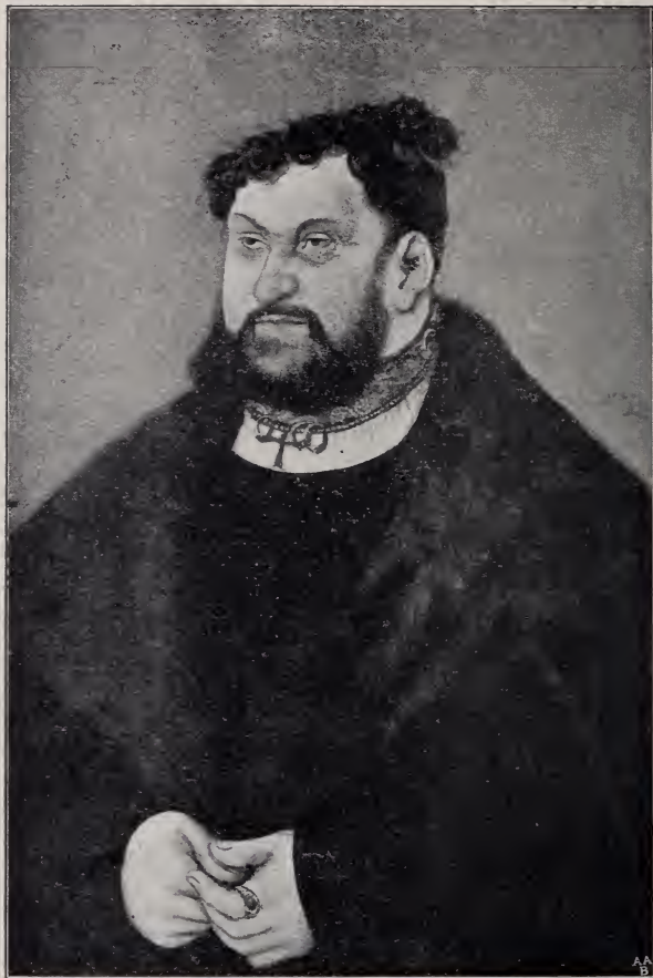
No. 26. Bildnis des Kurfürsten Johann des Beständigen von 1526. (Dresden bei S. K. H. dem Prinzen Georg.)