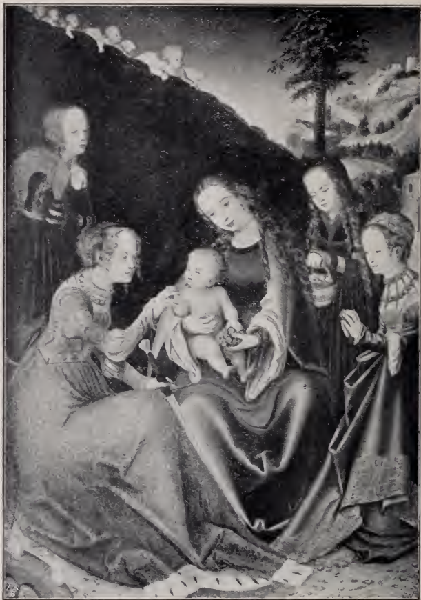
No. 73. Die Verlobung der hl. Katharina. (Budapest.)