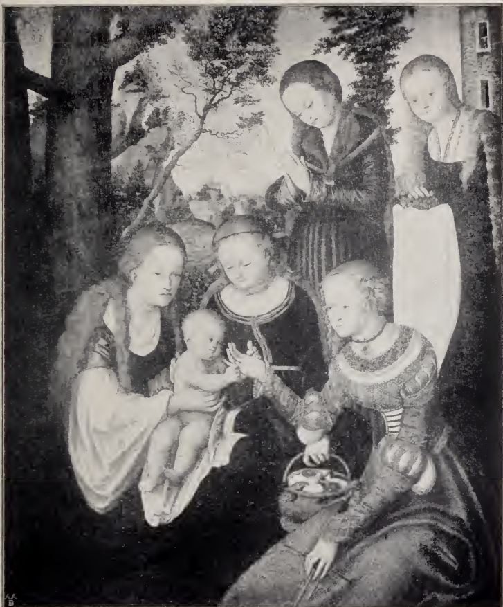
No. 10. Die Vermählung der hl. Katharina. (Wörlitz.)