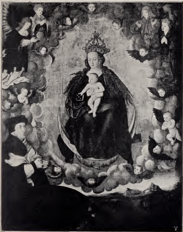
No. 102. Vom Halle'schen Altar (Mittelbild.) (Halle.)