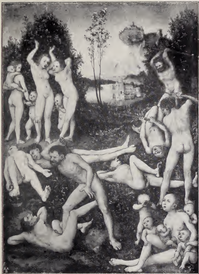
No. 40. Die Wirkung der Eifersucht. (Weimar.)