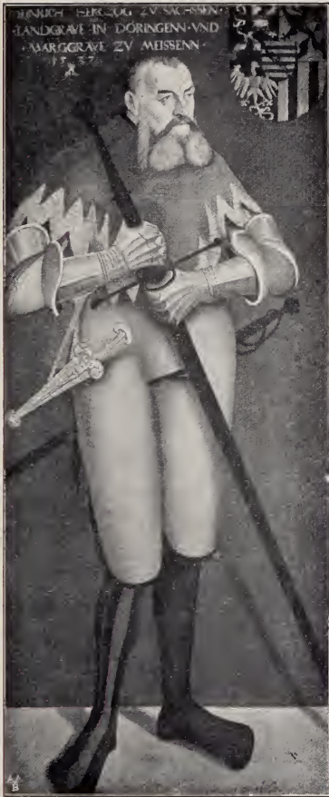
No. 66. Bildnis Herzog Heinrich's des Frommen von 1537. (Dresden.)