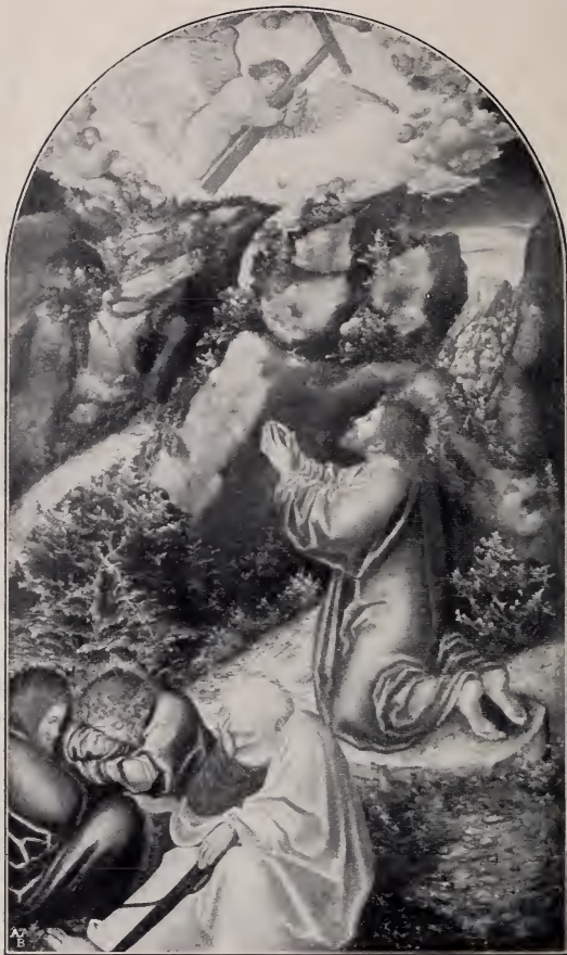
No. 76. Christus am Oelberg. (Dresden.)