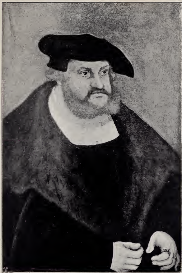
No. 119. Altersbildnis Friedrichs des Weisen. ( Dresden bei S. K. H. dem Prinzen Georg. )