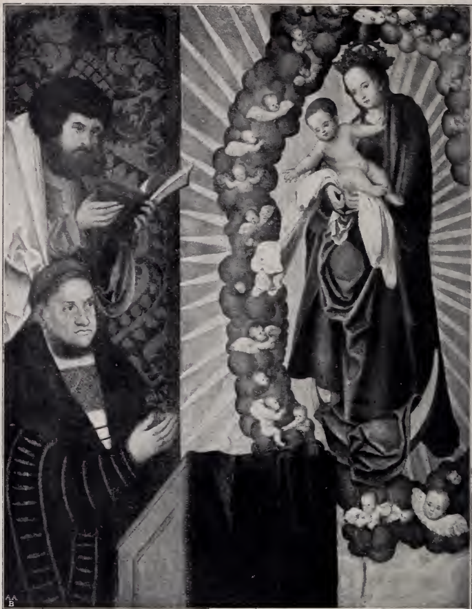
No. 128. Maria auf der Mondsichel mit dem anbetenden Stifter. (Darmstadt, Geh. Hofrath Schäfer.)