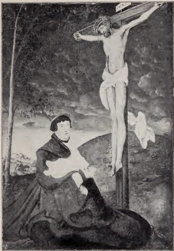
No. 141. Christus am Kreuz, von Kardinal Albrecht von Brandenburg verehrt. (Augsburg.)