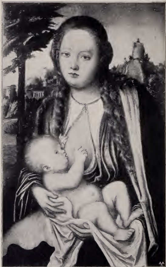
No. 138. Maria, das Kind stillend. (Darmstadt.)