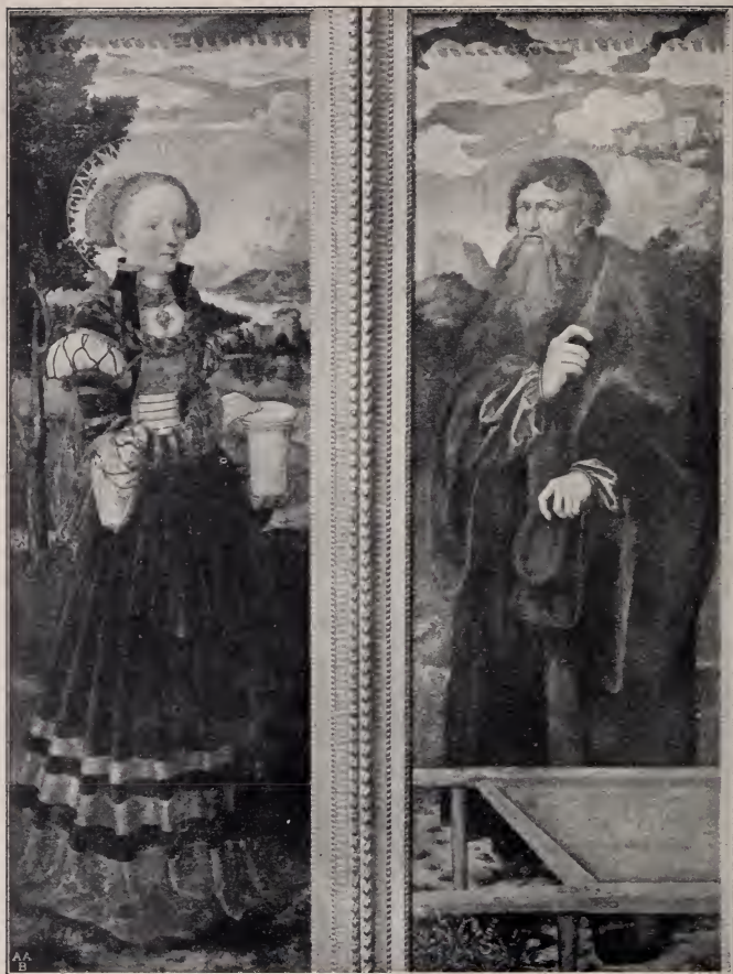
No. 204 C. Die heilige Magdalena und der heilige Lazarus.