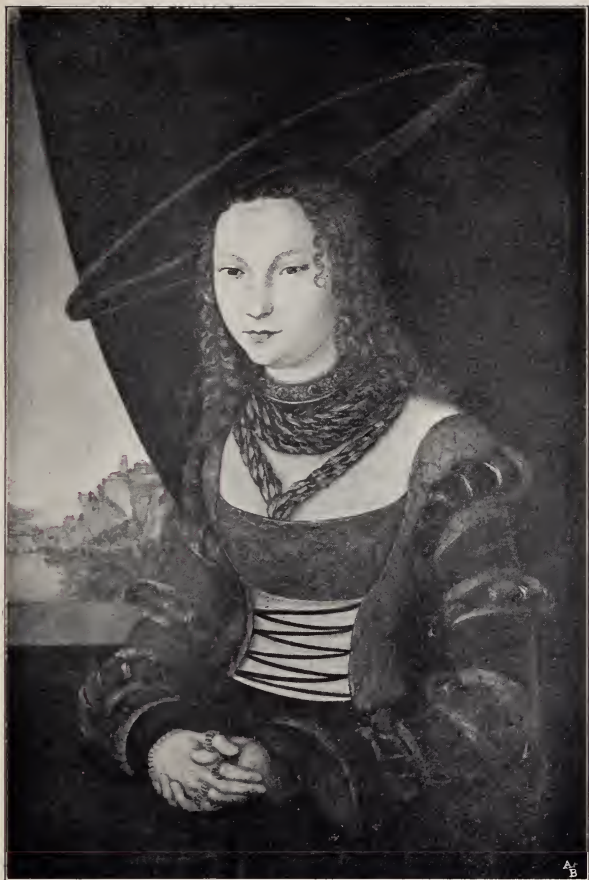
No. 25. Bildnis der Sibylla von Cleve, als Braut Johann Friedrich's des Grossmütigen. (St. Petersburg.)