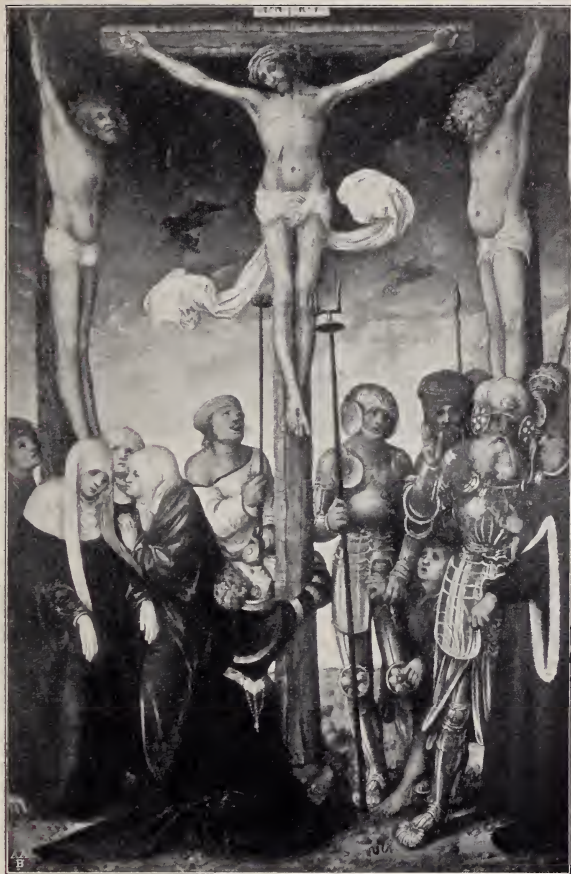
No. 77. Die Kreuzigung Christi. (Frankfurt a. M.)