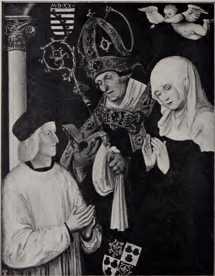
No. 101. Der hl. Wilibald und die hl. Walburga mit dem Stifter. (Bamberg.)