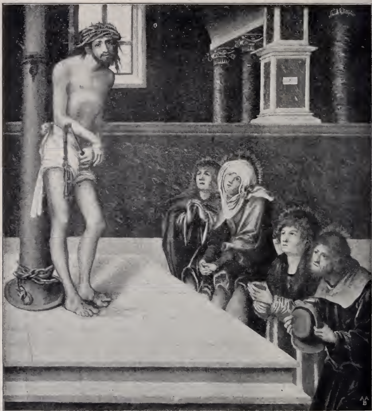
No. 8. Christus an der Säule. (Dresden.)