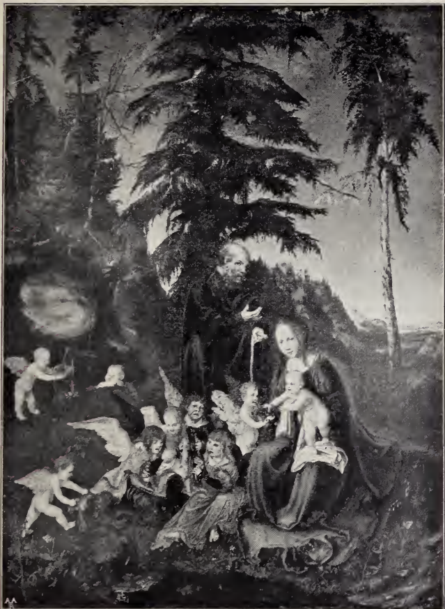
No. 1. Die Ruhe auf der Flucht nach Aegypten. (München) H. Levi.