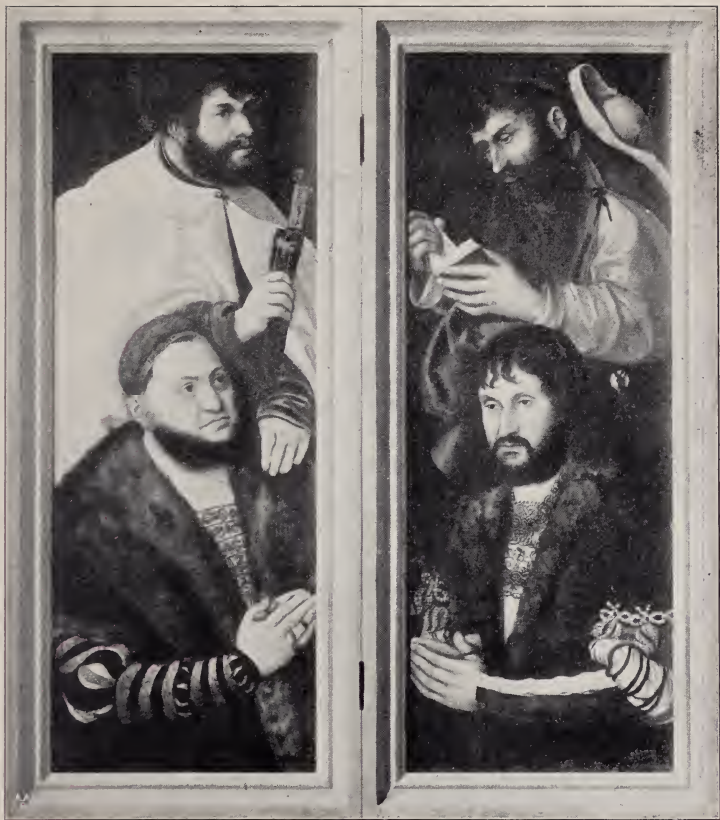
No. 127 B. u. C. Flügelaltar, linker u. rechter Flügel: Friedrich der Weise und Johann der Beständige. (Wörlitz.)