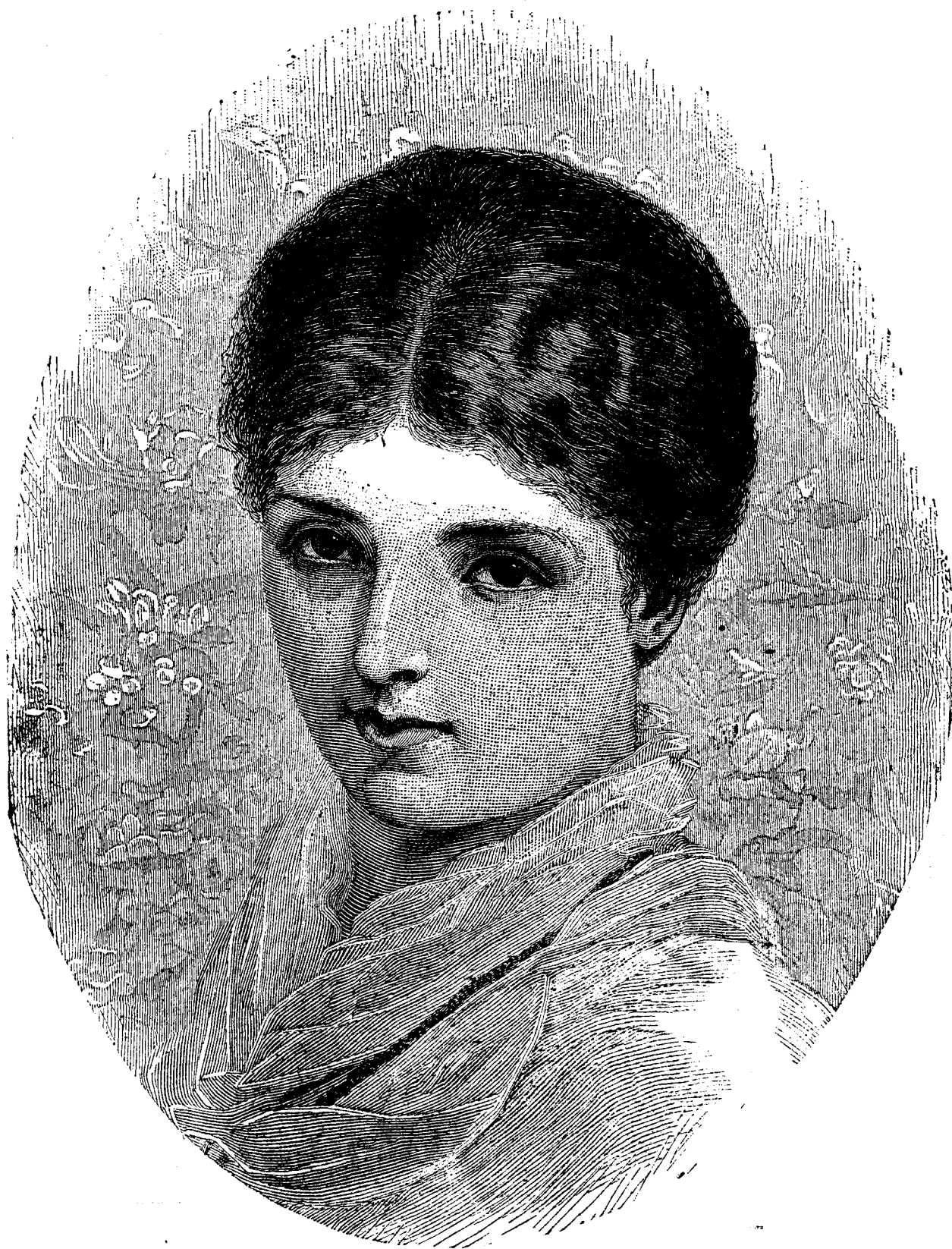
M a r i ó r a.