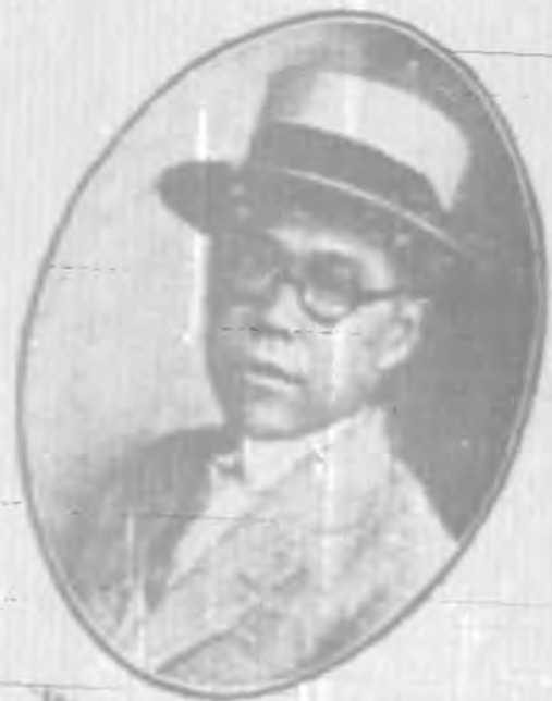
房 執 委 之 祥