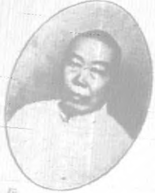
王 登 委 匠 秋