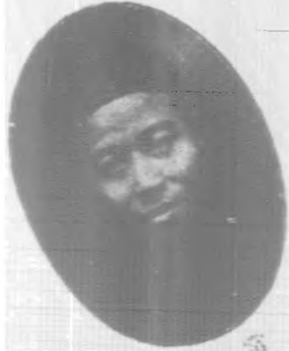
汪 委 常 務