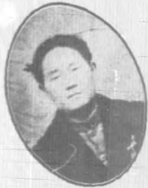
林 執 委 風