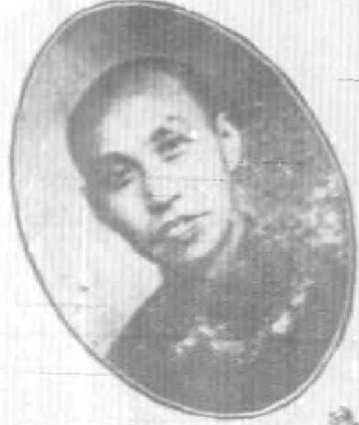
魏 統 侯 公 孫