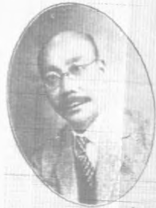
許 委 監 國