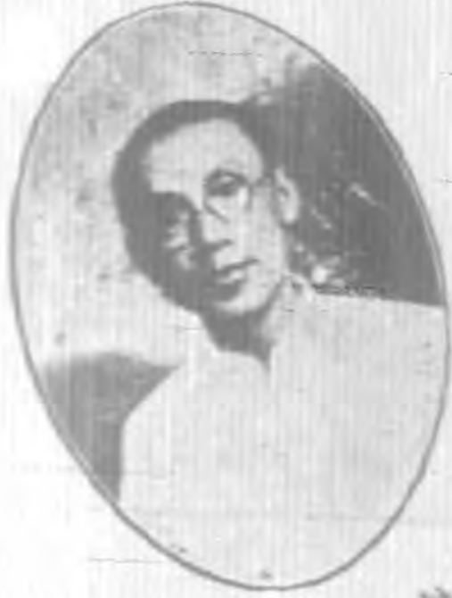
徐 匯 清 委 員