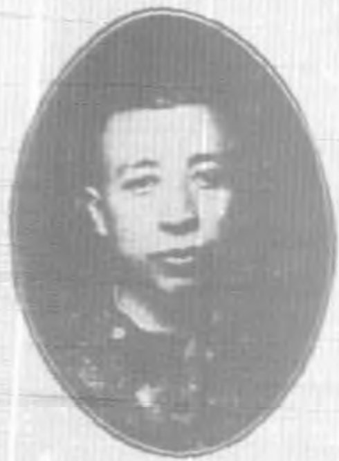
紀 永 委 執 謝