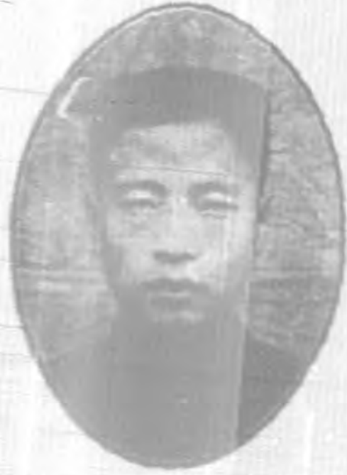
汪 登 委 游 川