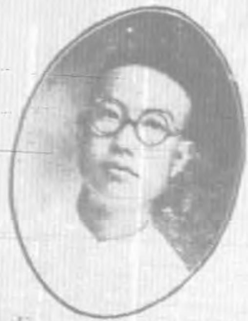
田 玉 委 監 呂