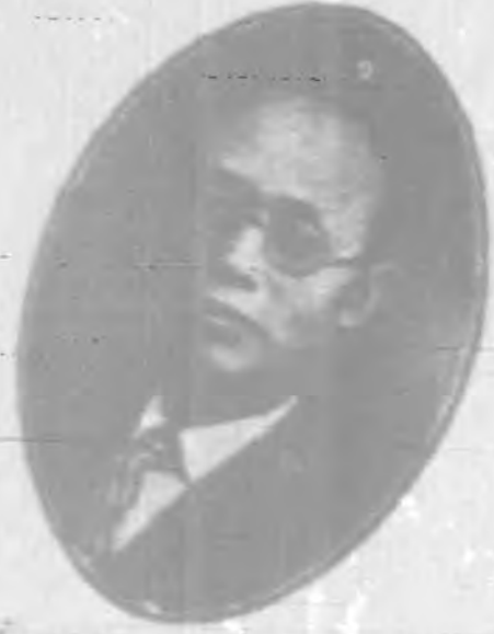
公 甫 委 常 務