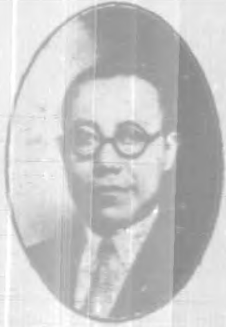
桂 華 委 常 務