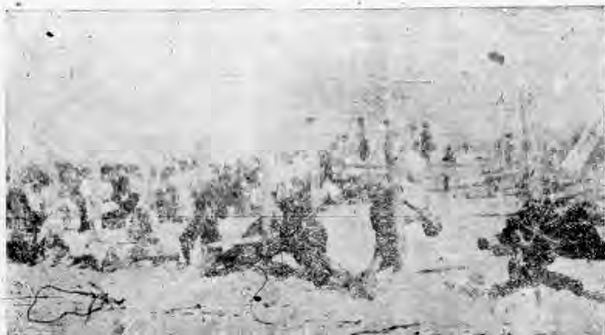
臺灣革命志士被日寇槍殺壯烈犧牲情形

同胞們！我們要記住日本人的殘暴壓迫欺騙，廓清日本人所給予我們的奴役文化，咬緊牙關，群策群力，遵照三民主義，努力建設一個新的臺灣，新的中國，方對得起許多革命先烈，方不致重遭亡國慘痛！