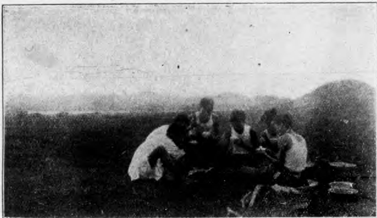
露宿青陽港生生活之三