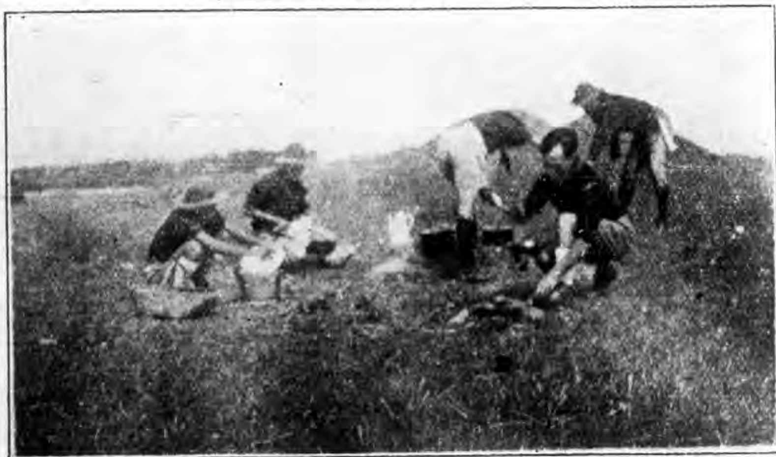
露宿青陽港生活之二