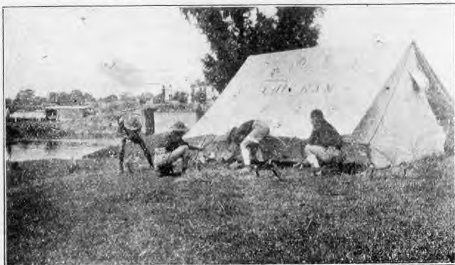
露宿青陽港生活之一