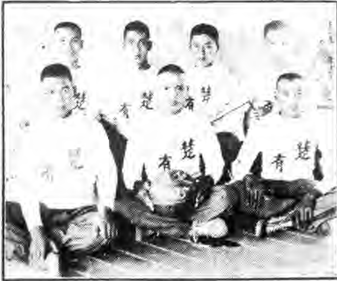
參加本軍全聯運之楚有軍艦監球隊

接頭，製機艙副汽管隔壁接頭，製機艙熱穿殘水射熱器接頭，製第一二鍋爐爐副注水抽水之軟管接頭截水門。打鐵廠：打進退機螺紋軸，打吊總凝水櫃蓋各機件，打傳軸潤油管壓馬。銅廠：鑄主機曲拐銅套五金，鑄主機偏心輪桿又銅套五金，製總凝水櫃出水管并和伸縮管，製旋轉抽進水管之伸縮管，畫定副汽管經過機艙之位置，製鍋爐爐吸煙底水管，製鍋爐爐鐵梯，製吸煙油管之鐵筒，輪機廠：傳汽旋發電機約汽門，傳機艙及鍋爐爐殘水門，傳各汽管及各水管銅接頭盤，傳各汽管及各水管銅接頭