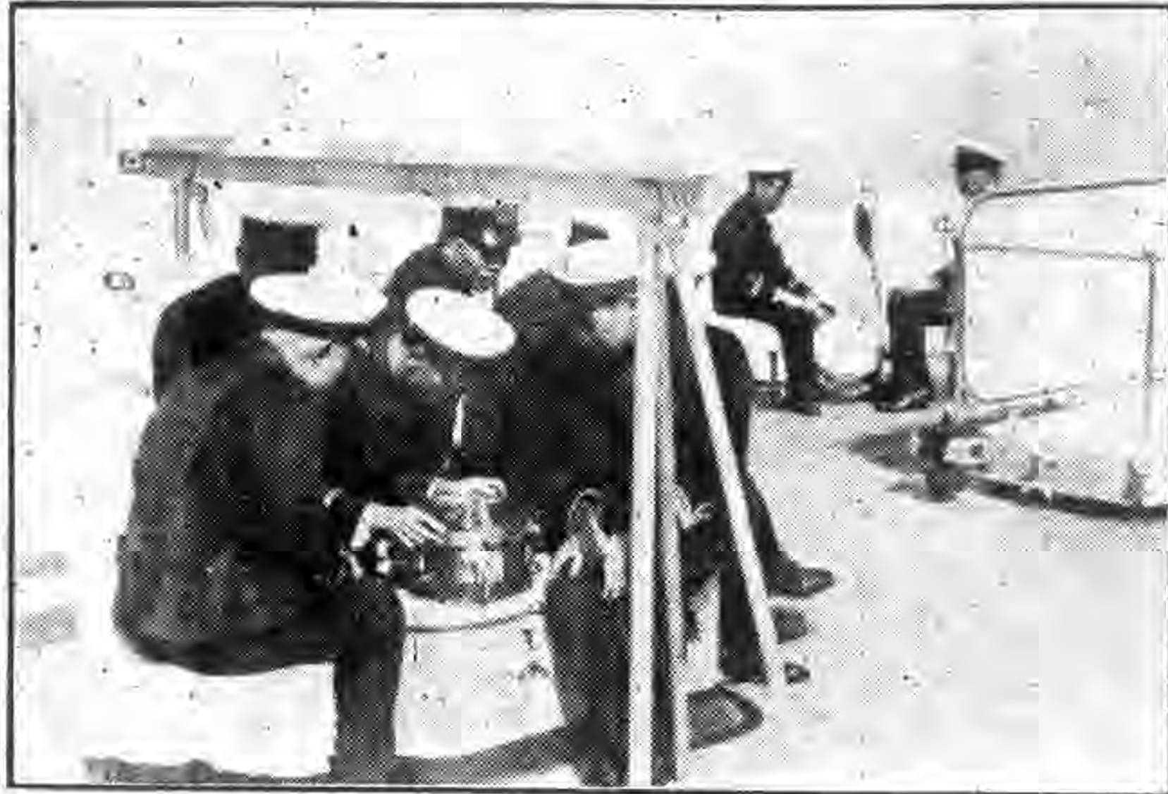
艦隊軍官在雷海練習砲火指揮之二

在軍事上佔重要地位，且含有高深學理，與特殊技能，非詳細研究不易領悟，且貯存各雷，尤須設立專廠。本軍原有水雷雷營，設備未週。海軍部以添建新式魚雷，水雷，電料各廠乃為當務之急。因就水雷雷原有舊式魚雷廠一座全部拆除，擴充基地，從新建築魚雷第一廠，魚雷第二廠，暨水雷廠各一座，每廠佔地為五十市方丈。廠內裝配吊車鐵軌，及輸送魚雷車，並置有不同式之各種水雷，魚雷，及新由英國購到之