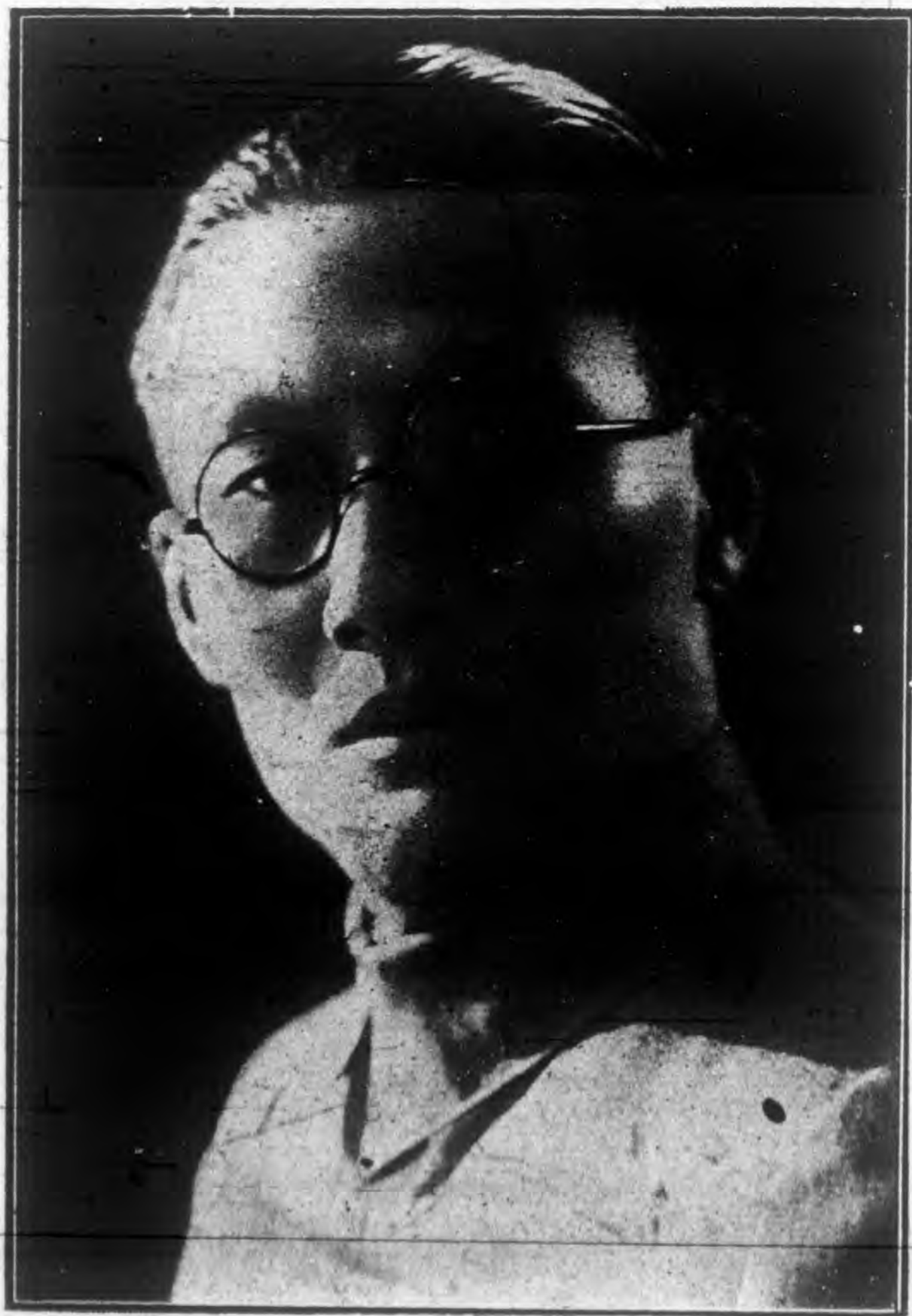
吳 市 長 肖 像