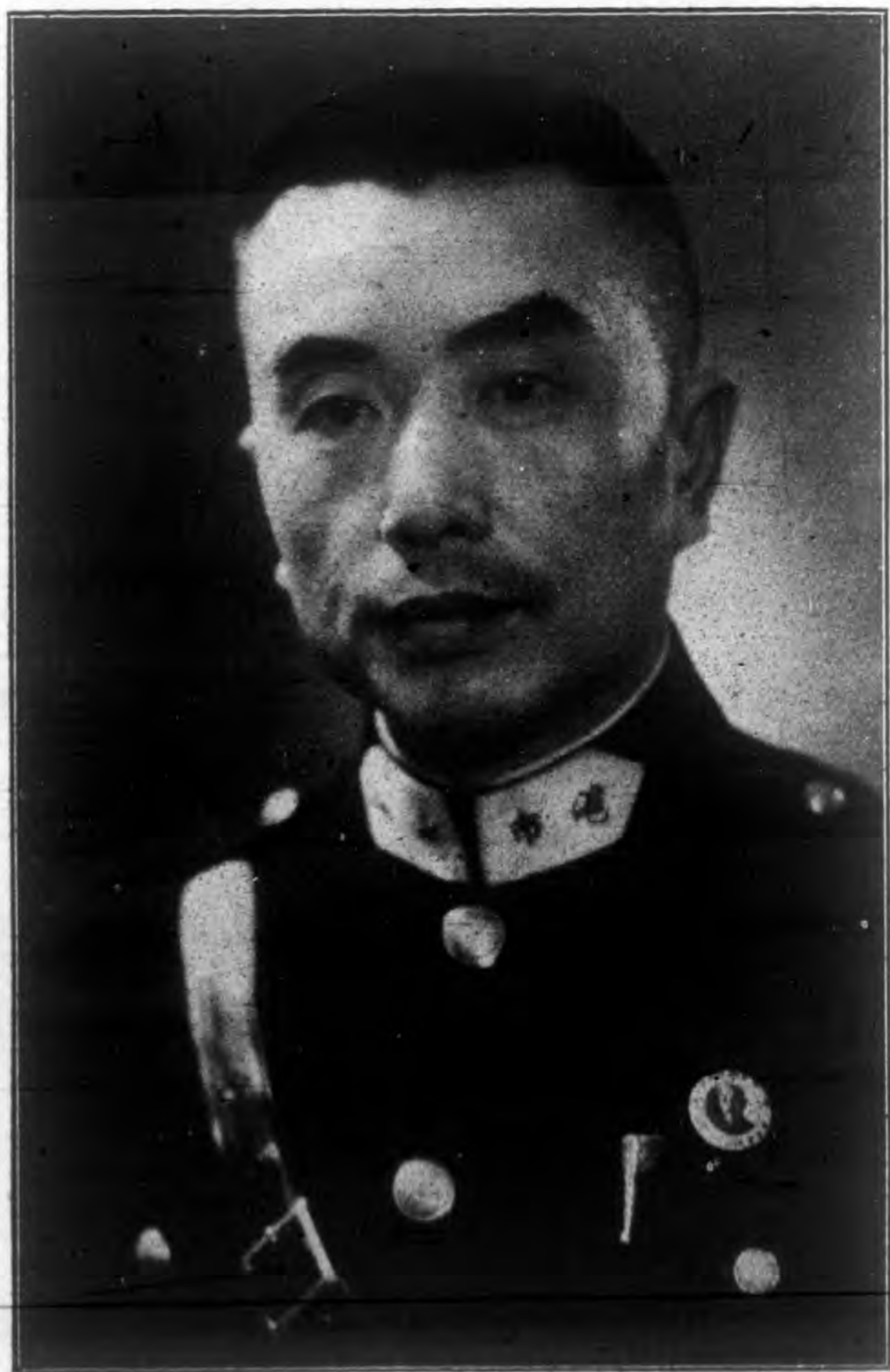
文 局 長 肖 像