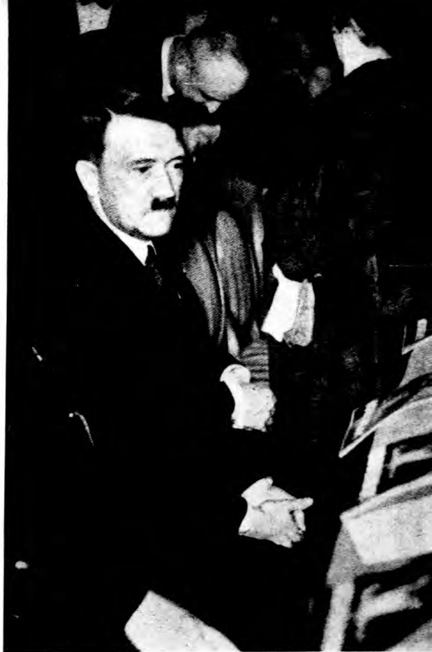
阿道爾夫·希特勒像