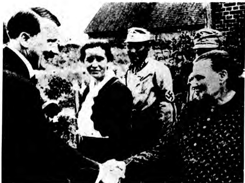
希特勒对农妇致敬