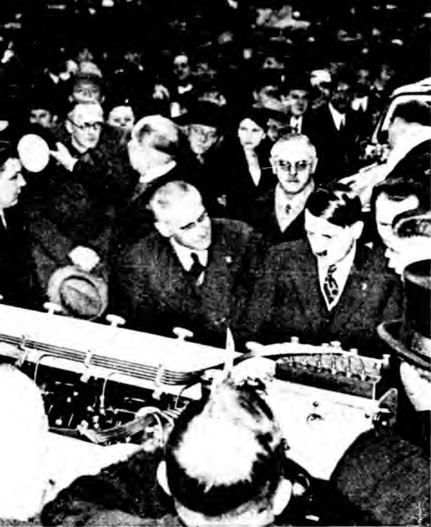
希特勒參觀汽車展覽會