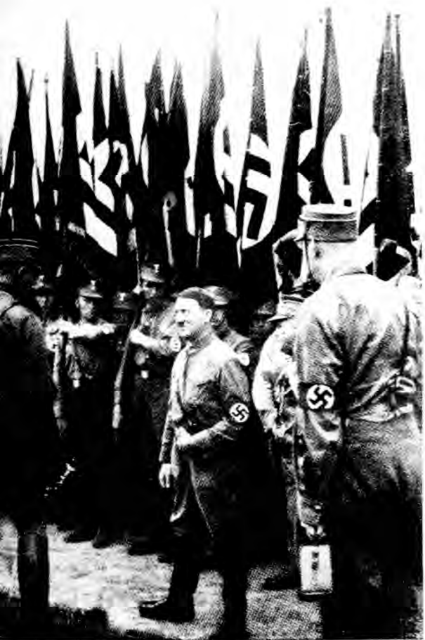
希特勒授民社黨挺進隊隊旗