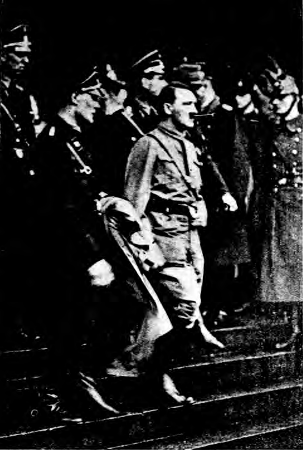
希特勒参加 馬可夫斯基 的國葬