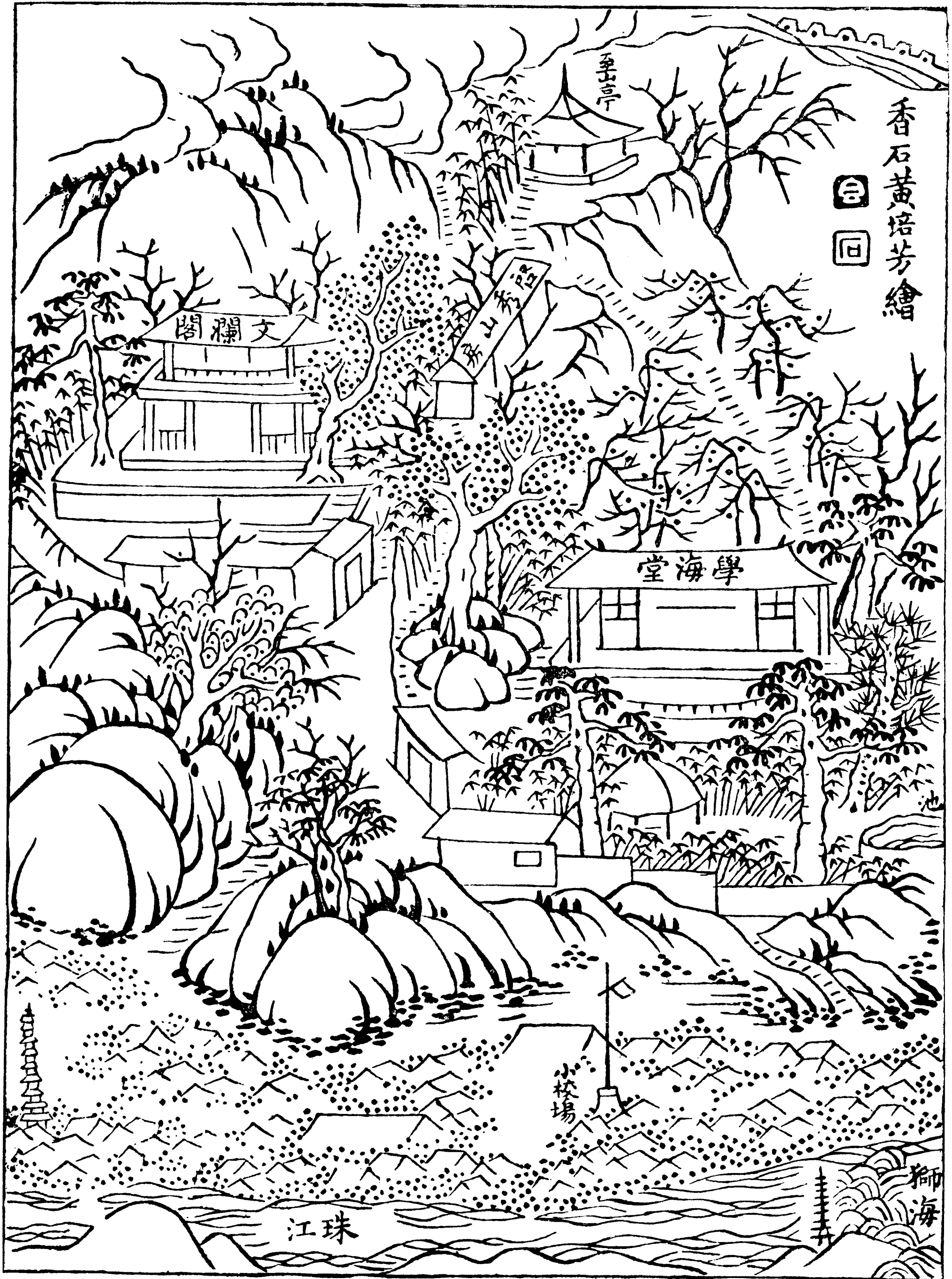
學海堂圖一（原圖載學海堂志）