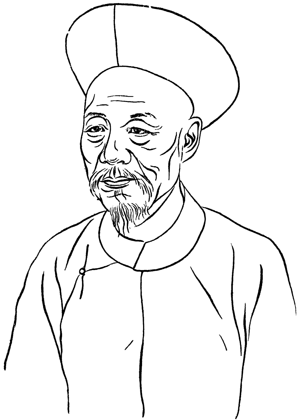
陳 澧 遺 像