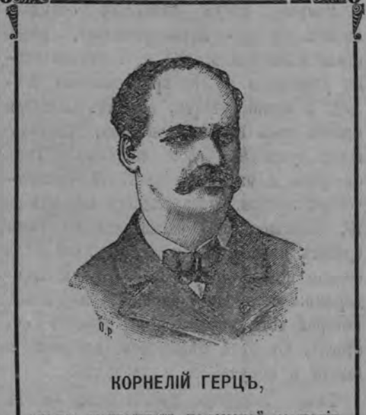
агентъ-шантажистъ панамской компаніи.