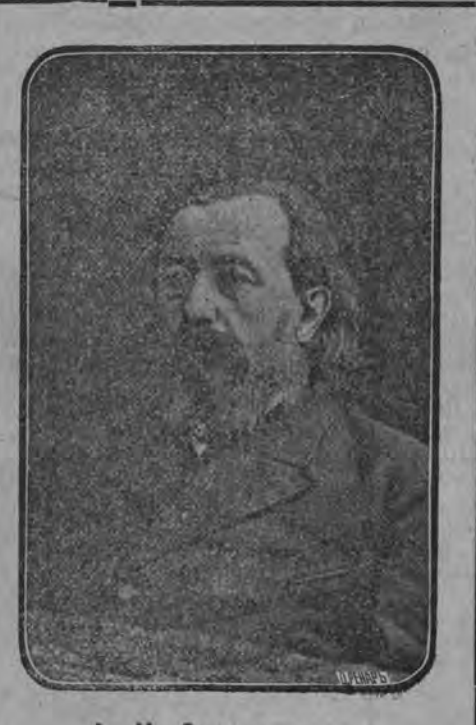
А. Н. Энгельгардтъ, известный деятель русскаго земле делія и сельскаго хозяйства. † 21 янв. 1893г.