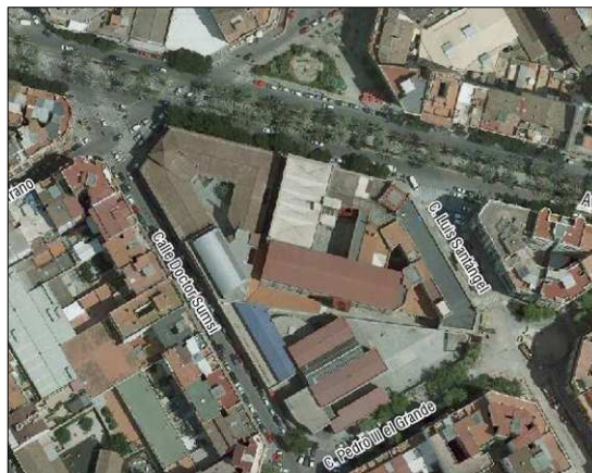
Fotografía Aérea 2008

Cartografía Catastral: YJ2761E Manzana: 64175 Parcela: 02 CART. CATASTRAL: 423-07-1 /II/III/IV IMPLANTACIÓN: ESQUINA FORMA: IRREGULAR SUPERFICIE: 3.960,1 M2