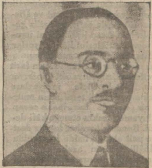
Milletler Cemiyeti umum kâtibi M. Avenol

Bu nota, Habeşlerin, 5 kânunuevvel tarihinde hiç bir tahrik olmadığı halde İtalyan garnizonuna hücum etmiş oldukları, birçok telefata sebebiyet verdikleri, garnizonun kendisini müdafaa ettiği ve takviye kıtaatı geldi