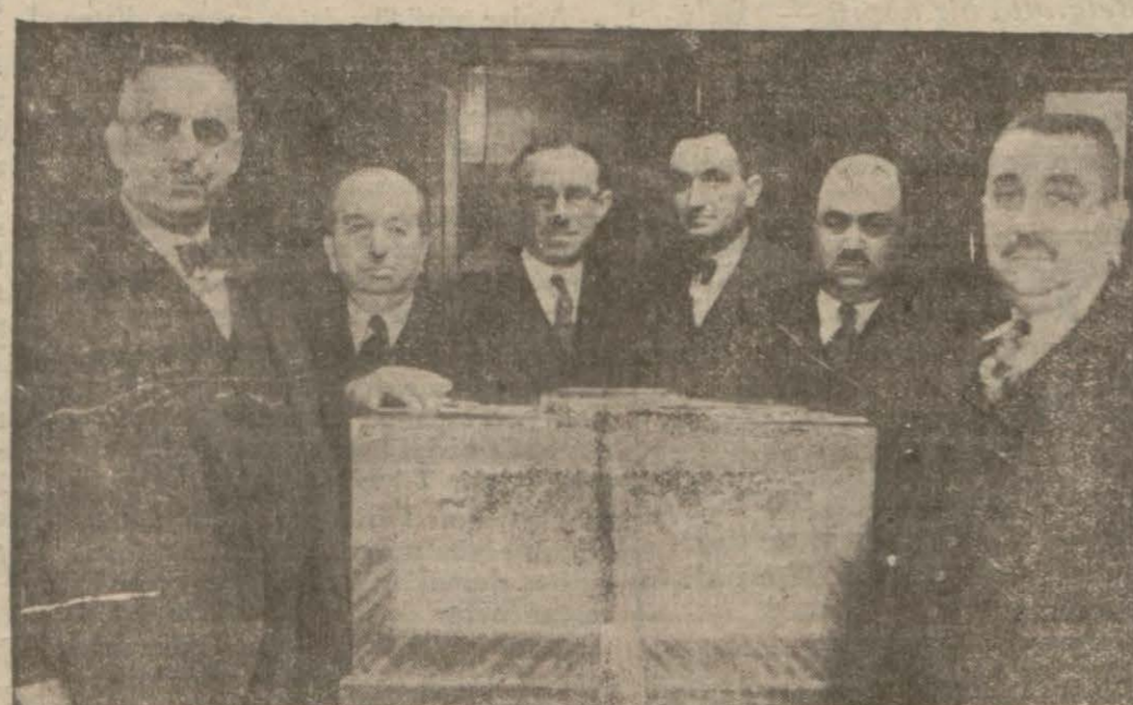
Ticaret odasında azalık seçimine dün başlandı — Yazısı iç sahifemizedir —

Gayrimübadiller Cemiyeti idare heyeti dün toplanmıştır. Bu toplantıda cemiyet reisi Bay Hüsnü ve umumî kâtibi Bay Şahap, gayrimübadillerin dilekleri hakkında Ankarada Maliye Bakanlığının nezdinde yaptıkları teşebbüsleri anlattılar. Ancak, Maliye Bakanlığı bu dileklerin kabul edilmesine veya edilmediğine dair müsbet ve menfi henüz bir cevap vermemiştir. Bu sebeple maliye-