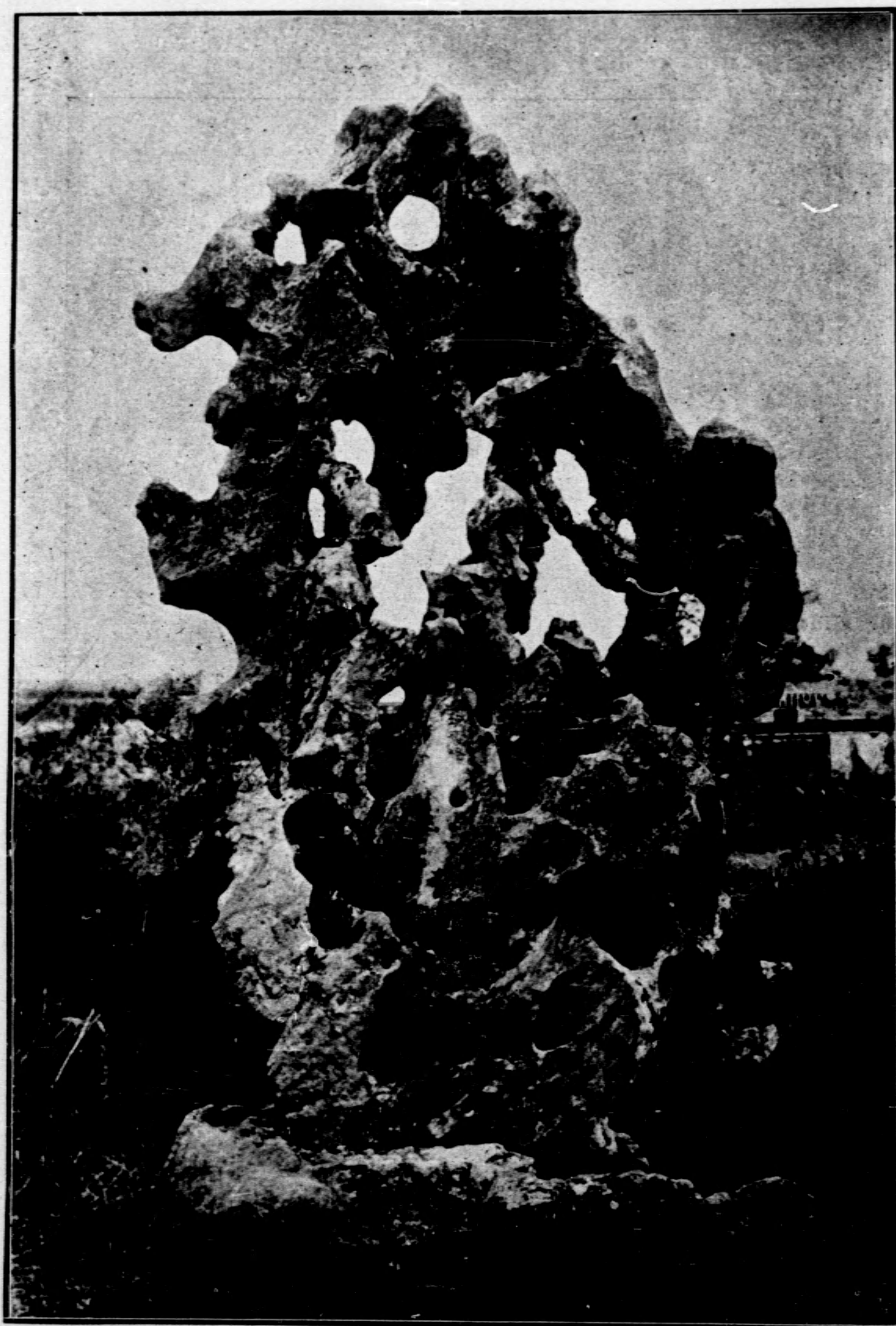
瑞 雲 峰