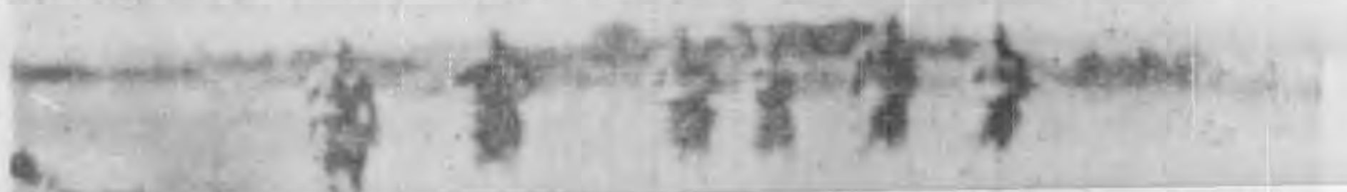
在前線作戰我忠勇將士之