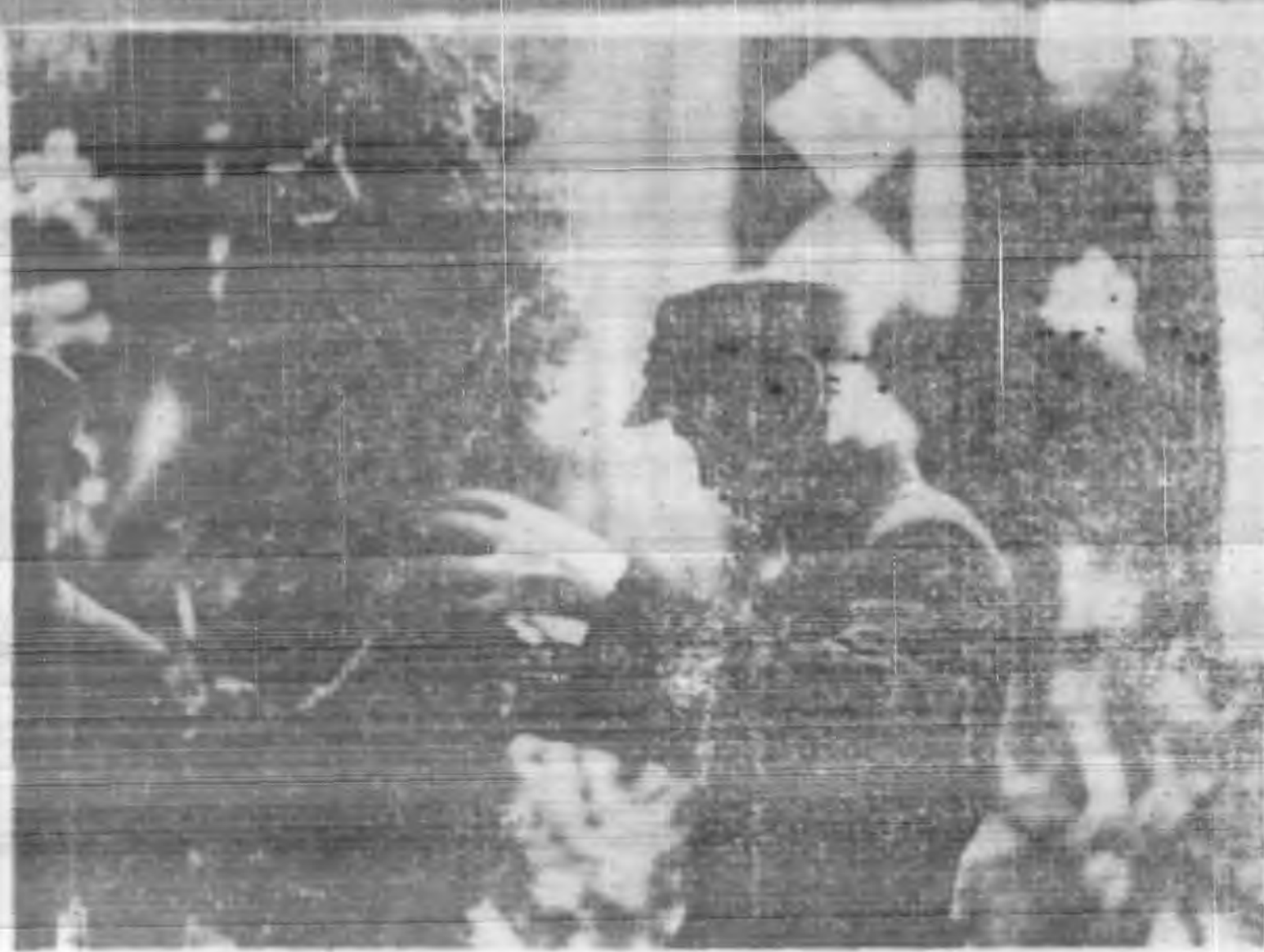
↑ 蔣委員長親自致祭王師長