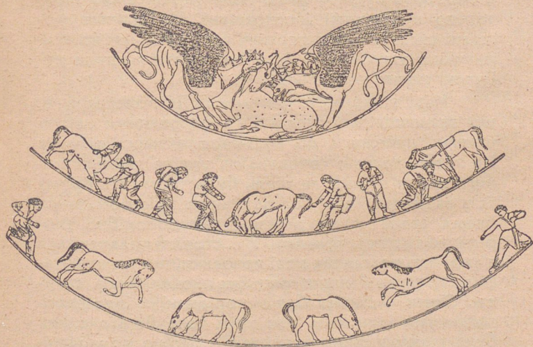
Скити ловлять диких коней (малюнок на старій вазі)

це поганські вірування тодішнього населення). Таргітаон мав трьох синів: Ліпоксая, Арпоксая і Коляксая. В часі життя цих синів злетіли з неба золоті знаряди: плуг, ярмо до запрягу волів, сокирка і чарка, й упали на землю. Вони переховувалися пізніше в нашій країні як найбільші святощі. Ці перекази вказують з одного боку на це, що