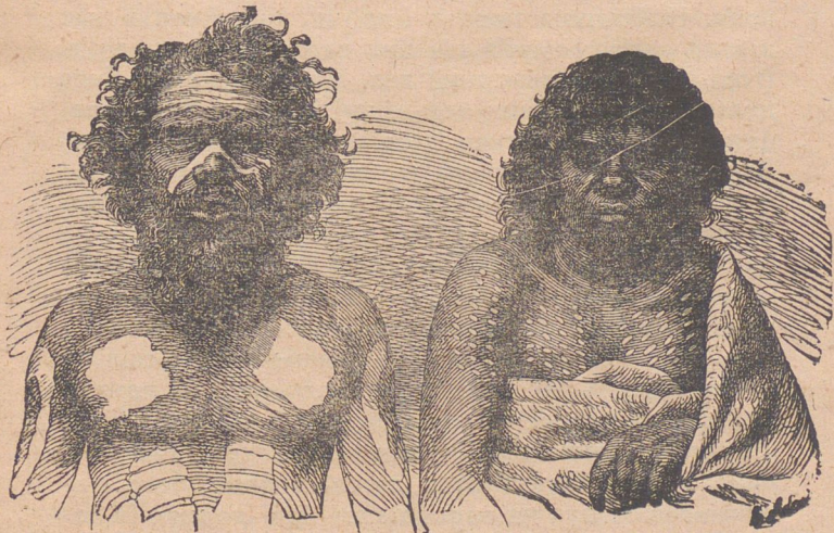
Дикі люди первісної культури

стями, а умовими здібностями звірини. Ніяких „малполюдів“, себто істот посередних між малпою і людиною, вченим не вдалося знайти — очевидно їх і не було. Тому коли хочемо уявити собі вигляд первісної людини, то її останки, що їх знаходимо в землі, не дають права підмальовувати її під звірину. Первісна людина була подібна до