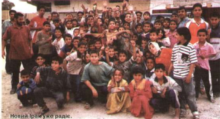
Новий Ірак уже радіє.