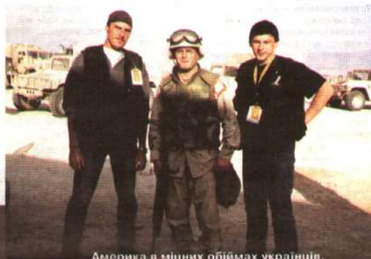
Америка в міцних обіймах українців.

пострілами танкових гармат, безладним галасом переляканих мешканців. Ми намагалися не заздрюватися в готелі, де жили разом із колегами з телеканалу "1+1", ми прагнули зафіксувати ті विशалні події, які колись стануть історичними, і злізти й під кулі, яких у ті дні було більше, ніж досить. Тривала зничайна журналістська робота на лінії вогню.