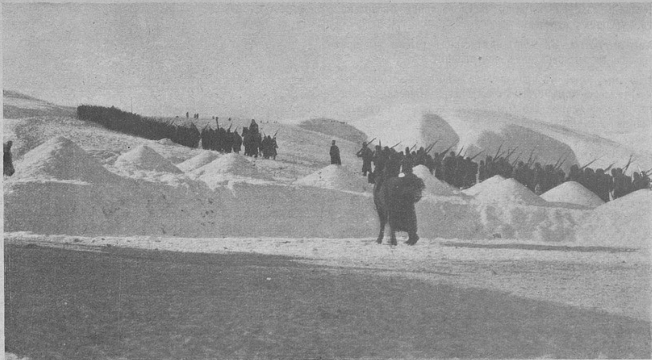
Войска доблестной Кавказской арміи въ Саганлугскихъ горахъ.

участкѣ Двины, ниже Фридрихштадта, мѣстами велся оживленный артиллерійскій огонь.