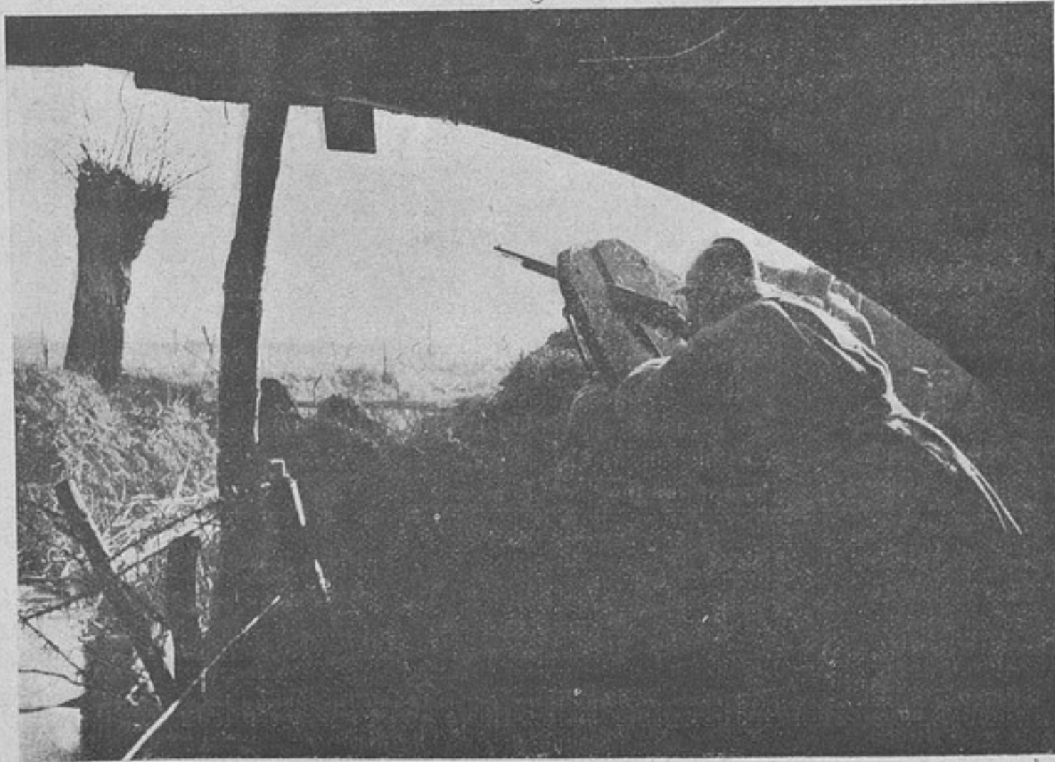
Сцены изъ жизни французской арміи. Дежурный стрѣлокъ въ окопѣ. (Фотогр. собств. корреспондента.)

Думой сильно интересуются, — послѣ наступившаго молчанія добавляетъ онъ,