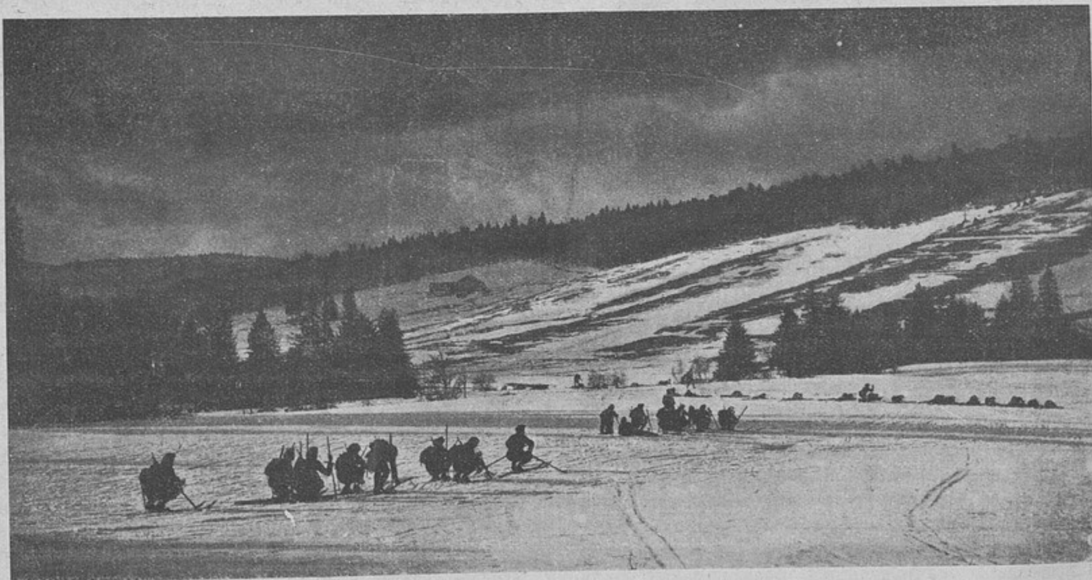
Сцены изъ жизни французской арміи. Альпійскіе стрѣлки въ Вогезахъ.

Мы сами не терпимъ недостатка въ наличномъ составѣ. Но въ нашемъ распоряженіи будетъ еще больше живыхъ силъ, если мы сумѣемъ оказать давленіе на Англію, въ смыслѣ введенія въ дѣло всей наличности ея арміи, если не замедлимъ употребить всѣ мѣры для сфермированія могучей, сплоченной арміи чернокожихъ. У насъ всегда будетъ неизся