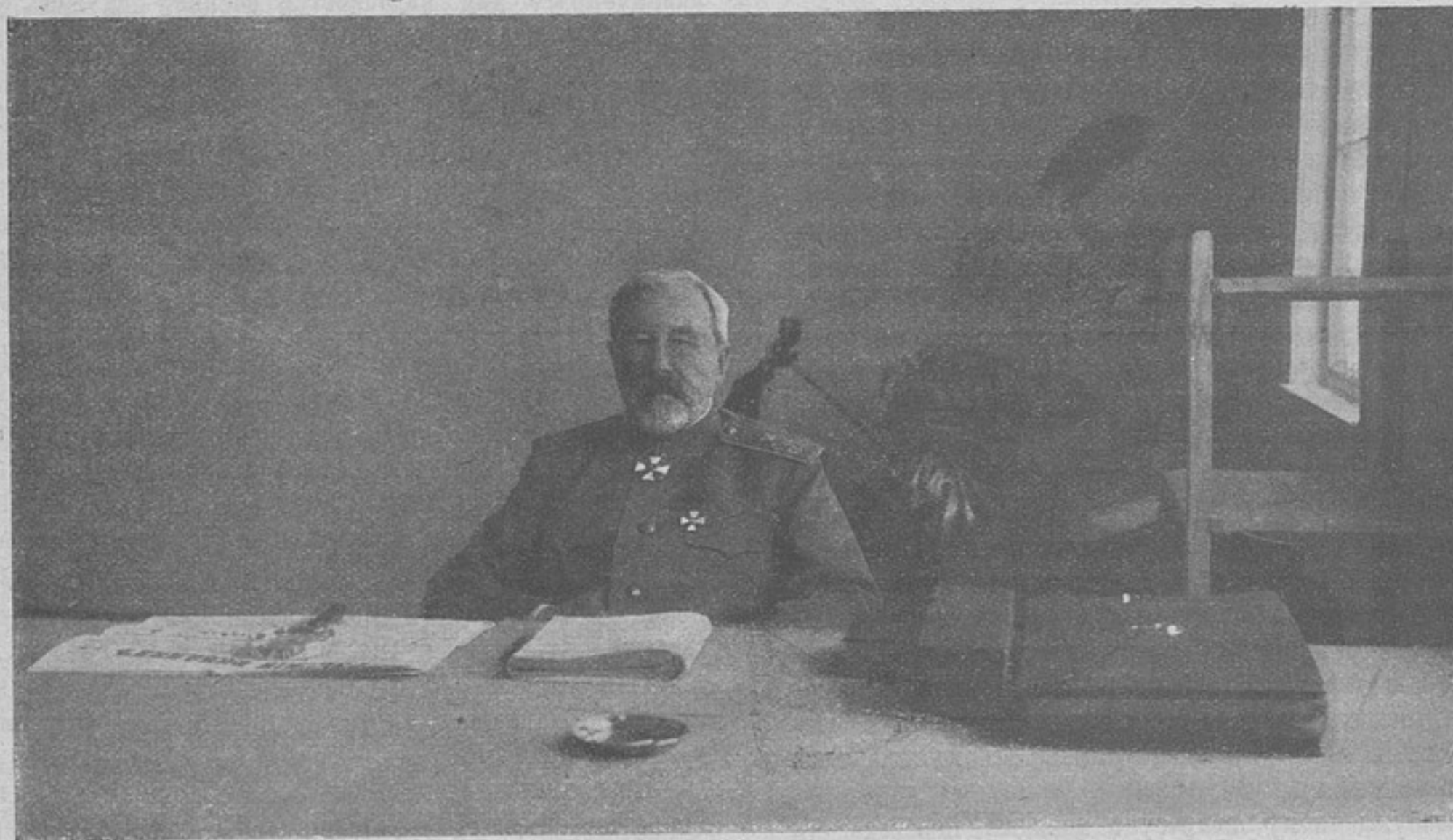
☛ Главнокомандующій арміями сѣвернаго фронта генераль-адъютантъ Алексѣй Николаевичъ Куропаткинъ. (Съ новѣйшаго фотографическаго снимка.)

СОДЕРЖАНІЕ: Портретъ генераль-адъютанта Алексѣя Николаевича Куропаткина. — Распоряженія по военному вѣдомству. — Война. — „Мы побѣдимъ“. — Обзоръ печати. — Корреспонденція. — Свѣдѣнія объ убитыхъ и раненыхъ. — Библиографія. — Вопросы и отвѣты. — Почтовый ящикъ. — Объявленія.