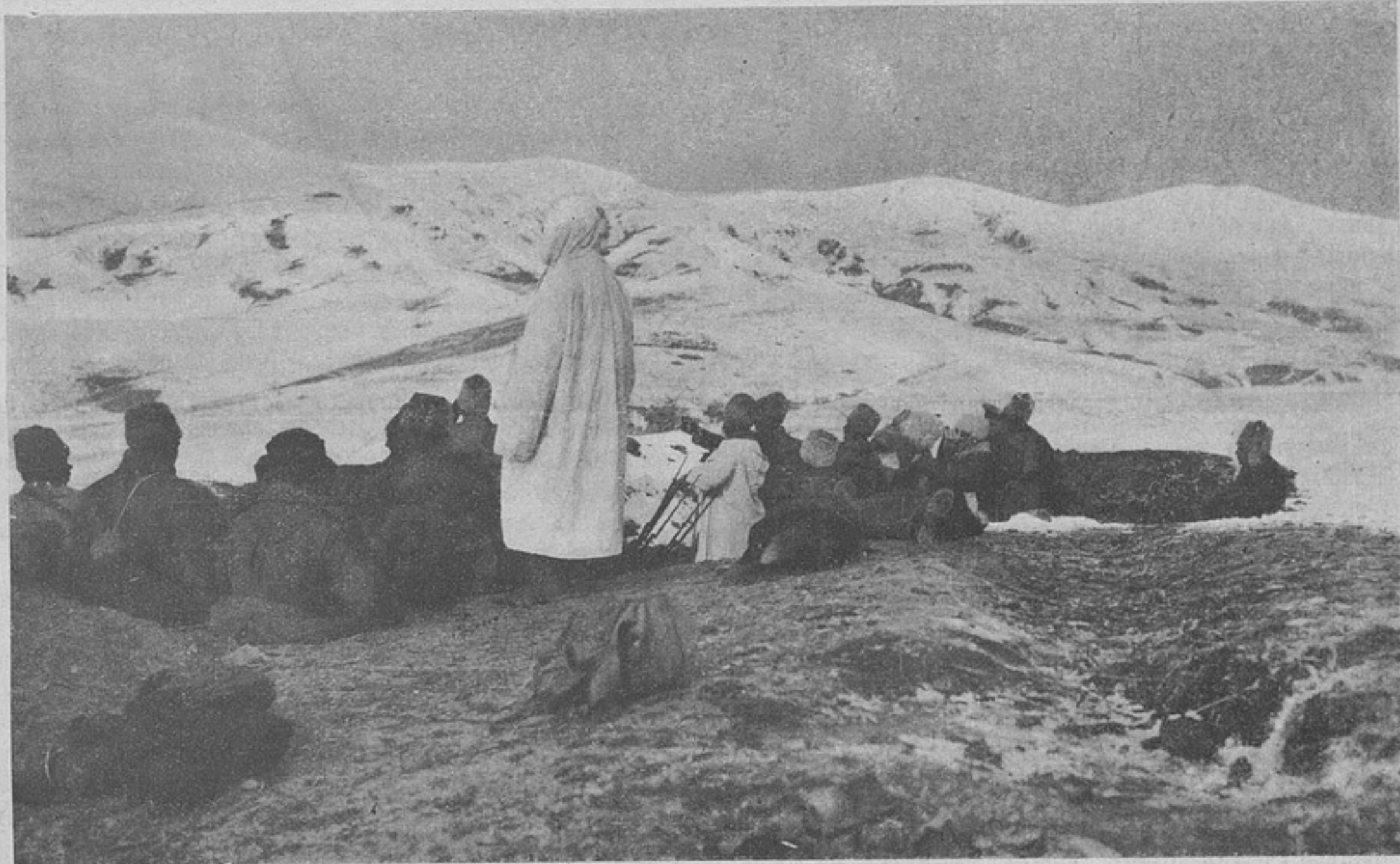
Рекогносцировка позицій у Геряка на Кавказскомъ фронтѣ. Группа начальниковъ. (Фотогр. собств. корреспондента.)

Нижеслѣдующее, полное захватывающаго интереса письмо было получено съ фронта отъ одного изъ офицеровъ дѣйствующей арміи, въ видѣ матеріала для одной или нѣсколькихъ статей военного характера. Не желая охладить его героическаго пыла и опасаясь не достаточно ярко передать наполняющую его непоколебимую вѣру въ будущее, мы сочли лучшимъ помѣстить его полностью, безъ какихъ бы то ни было добавленій съ нашей стороны. Авторъ нижеслѣдующихъ строкъ находится въ рядахъ войскъ только благодаря войнѣ. Человѣкъ молодой, въ высшей степени развитой, прекрасно образованный, онъ весь свой умъ, все богатство души, всѣ нравственныя и физическія силы отдалъ на служеніе родинѣ. Онъ уже въ теченіе нѣсколькихъ мѣсяцевъ находится на одномъ изъ самыхъ тяжелыхъ участковъ фронта, безпрестанно подвергающемся ожесточен-