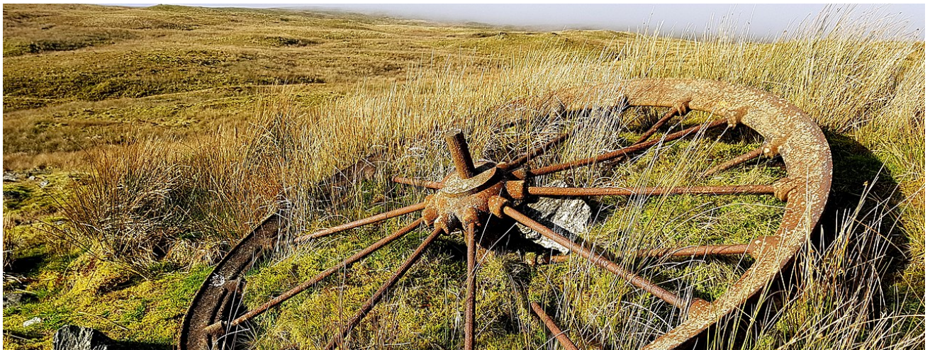
Gweddillion mwynglawdd plwm Plynlimon yng Ngheredigion, gan Chris Popham

Hefyd crëwyd labeli yn y Gymraeg ar gyfer 6000 o gapeli Cymru . Dyma'r tro cyntaf mae data yn y Gymraeg wedi bod ar gael i'r cyhoedd ar gyfer yr adeiladau yma.