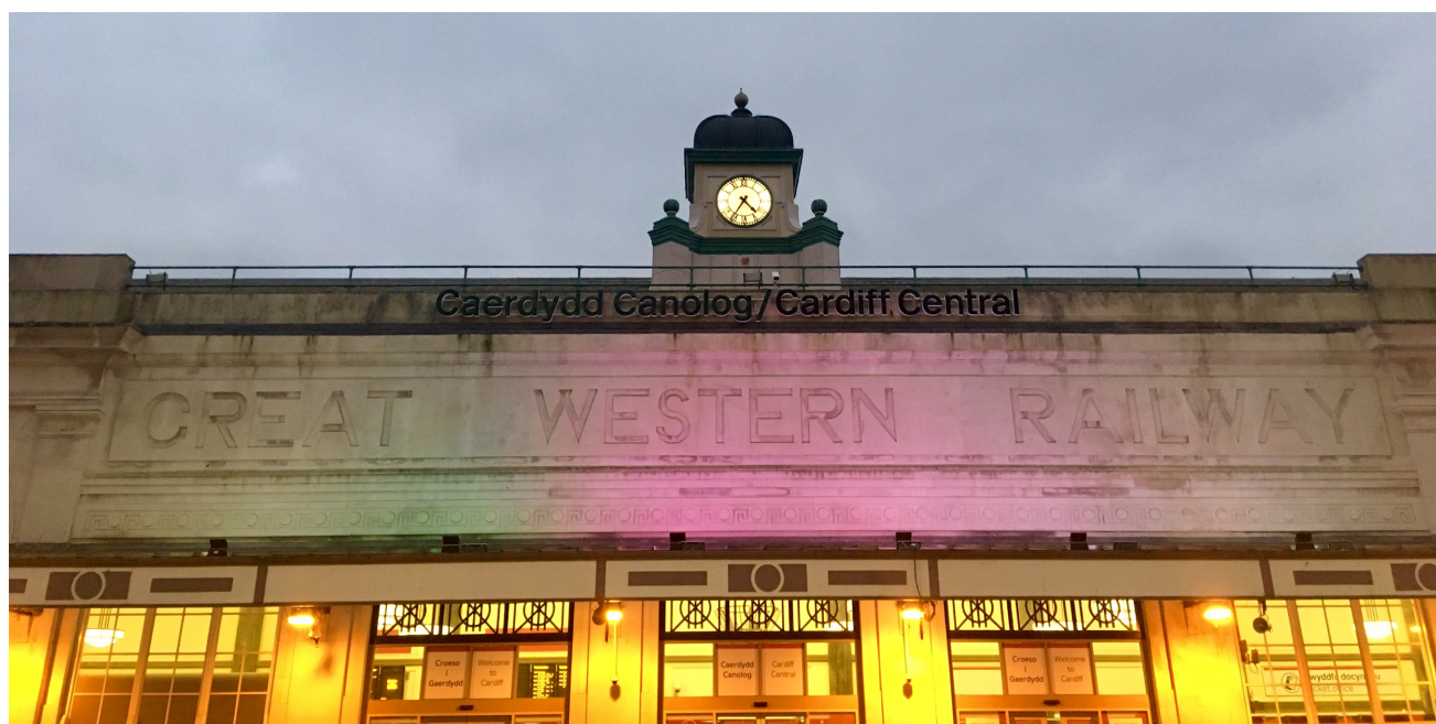
Adeilad rhestredig Gradd II Orsaf Ganolog Caerdydd