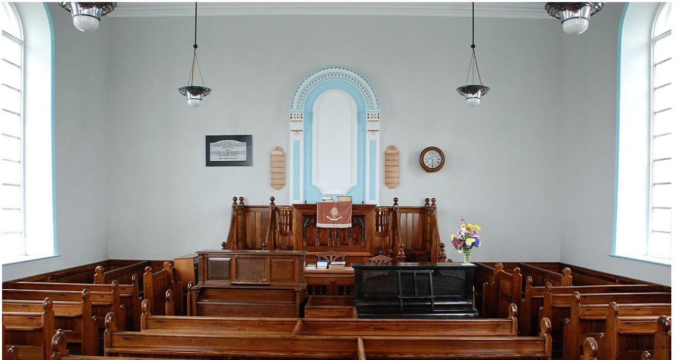
Capel rhestredig Gradd II Neuaddlwyd yng Nghwm Aeron. Gan Geraint Tudur

Yn ogystal â chreu cofnod data newydd mynediad agored ar gyfer adeiladau hanesyddol, cafodd y data a fodolai'n barod yn Wikidata ei lanhau a'i wella . Er enghraifft, cafodd cofnodion dwbl ar gyfer adeiladau hanesyddol o wahanol setiau data eu hadnabod a'u cyfuno. Adnabyddwyd tua 250 tafarn fel adeiladau cofrestredig a chapeli a chafodd y data ei wella.