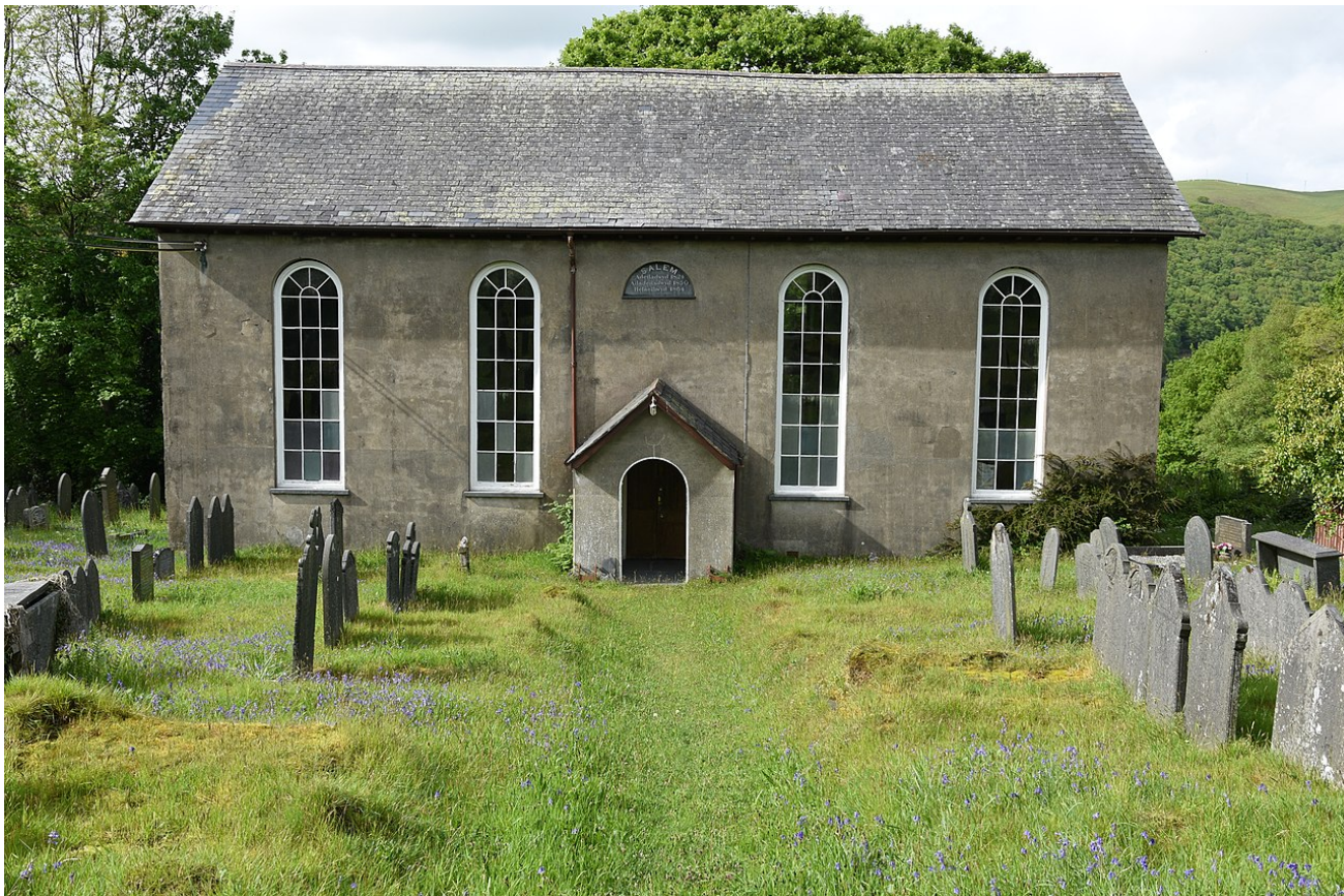
Capel Salem yr Annibynwyr yn Salem, Ceredigion. Gan Geraint Tudur

Bydd argaeledd llawer o'r data a gafodd ei rannu am adeiladau hanesyddol Cymru ar Wikidata yn cynyddu mewn nifer o ieithoedd eraill, wrth i wirfoddolwyr ychwanegu labelai i'r data yn eu mamiaith. Er enghraifft, o blith y 433 gwahanol fath o adeiladau hanesyddol sy'n cael eu defnyddio ar hyn o bryd yn y set data, mae 87% ar gael yn yr Almaeneg, 77% mewn Ffrangeg a Chatalan a 69% mewn Tseiniaidd. Yn ogystal â hynny, mae enwau meysydd data fel 'esiamplo', 'lleoliad' a 'delwedd' ar gael bron yn fyd-eang mewn dros 200 o ieithoedd. Mae hyn yn lleihau'n sylweddol y rhwystrau wrth ail-ddefnyddio mewn ieithoedd eraill, ac yn annog eraill i wneud defnydd o'r data mewn ffyrdd a all gynyddu gwybodaeth o ddiwylliant Cymru a'i hiaith ac annog addysgu pellach ar y pwnc ac ymweliadau i Gymru.