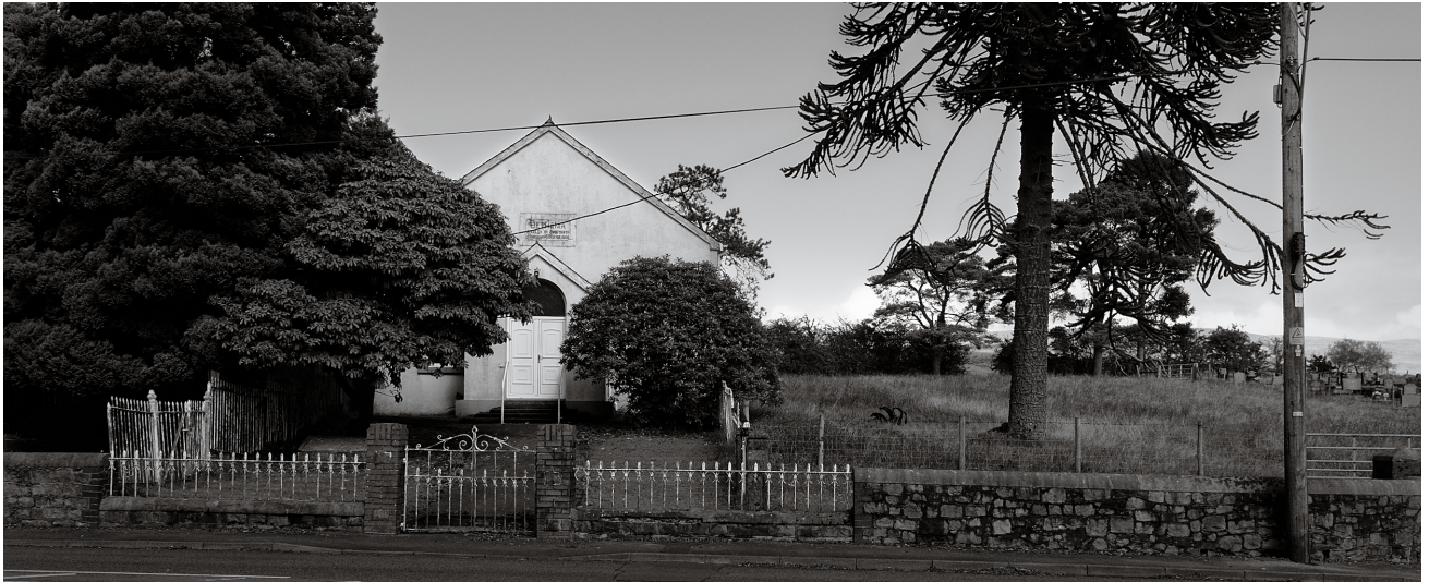
Capel Bethania yr Annibynwyr yn Rhosaman, gan Ade Rixon

Mae'n bwysig nodi, mai ar yr adeg mae'r adroddiad hwn yn cael ei ysgrifennu, bod y prosiect ond newydd gael ei chwblhau. Golyga hyn bod llawer o'r allbynnau tymor-hir, o bosib, heb gael eu gwireddu neu hyd yn oed yn fesuradwy. Mae'n eglur hefyd, bod disgwyl i'r llwybrau newid a fyddai wedi dod yn sgil y prosiect, i gyfrannu at amrywiaeth o effeithiau. Mae'n rhesymegol felly i asesu effaith y prosiect ar sail elfennau gwahanol Ddeddf Llesiant Cenedlaethau'r Dyfodol, fel sy'n cael eu rhestru uchod.