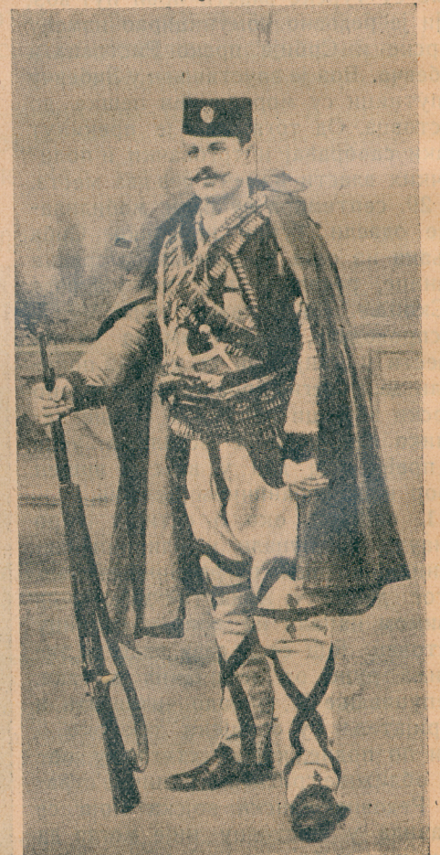
Војвода Јован Бабунски

[ Заузеће Подујева .] Али Турцима ни то није било доста и они су јуче рано изјутра поново напали наше трупе. У јучерашњем броју нашега листа ми смо саопштили последње вести о почетку тог великог боја.