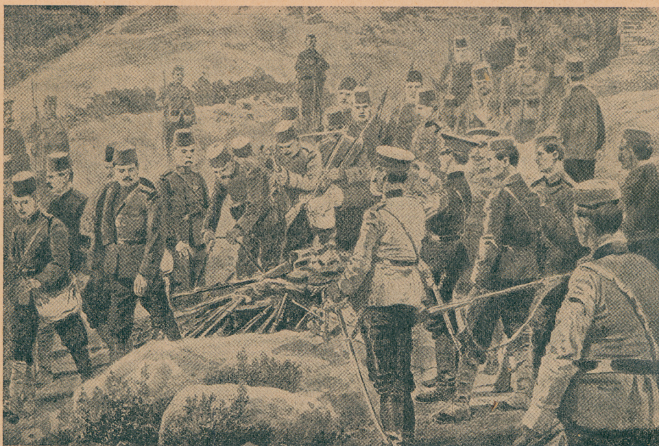
Посада Тузи предаје оружје

најозбиљнију бригу поклатио стварању организоване народне војске. Дотле је војска била под управом унутрашњих дела, а њоме је командовао »начелник стајаће војске«. Кнез Михајло је позвао француског пуковника Мондена, да организује српску милицију, и тада је створио засебно министарство војно. Пуковник Монден (умро је пре 6 година у Паризу) био је први српски министар војни. Кнез Михајло је за подизање српске војске врло много урадио. Довео је неколико Срба аустријских официра, створио школу за старешине народне војске, установио стална вежбања недељом и празником за народне војнике и целу народну војску наоружао тада модерним оружјем. Благодавећи оваком његовом раду на јачању народне оружане силе, он је могао 1867 без капи крви да добије шест градова, у којима је била још турска опсада.