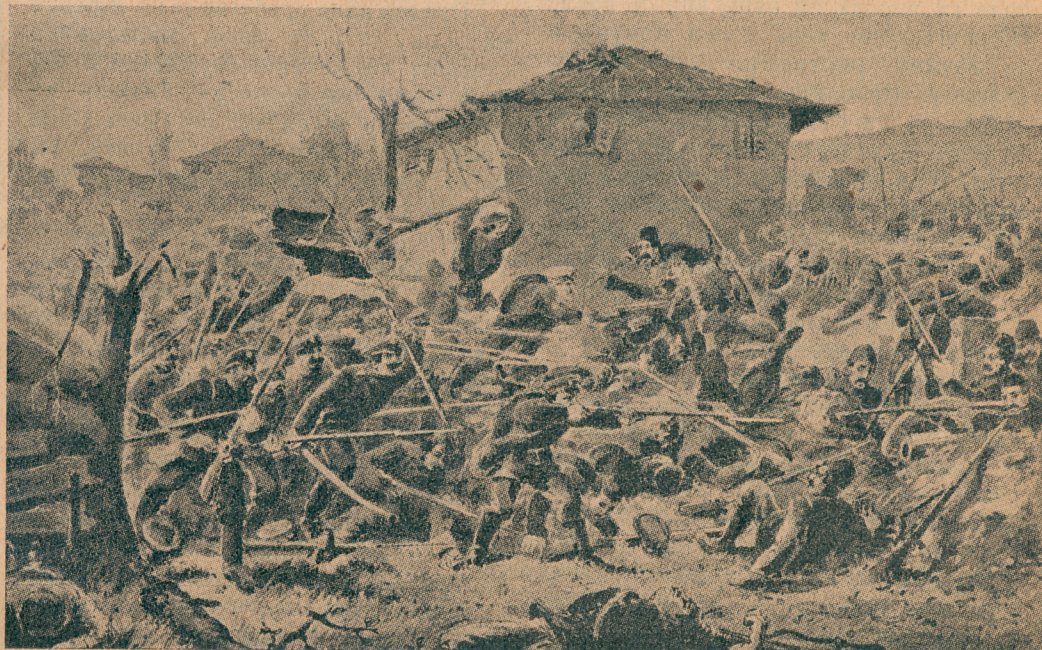
Призор из борбе код Киркилисе

Јуче у шест часова изјутра отпочео је наш седми пешачки пук