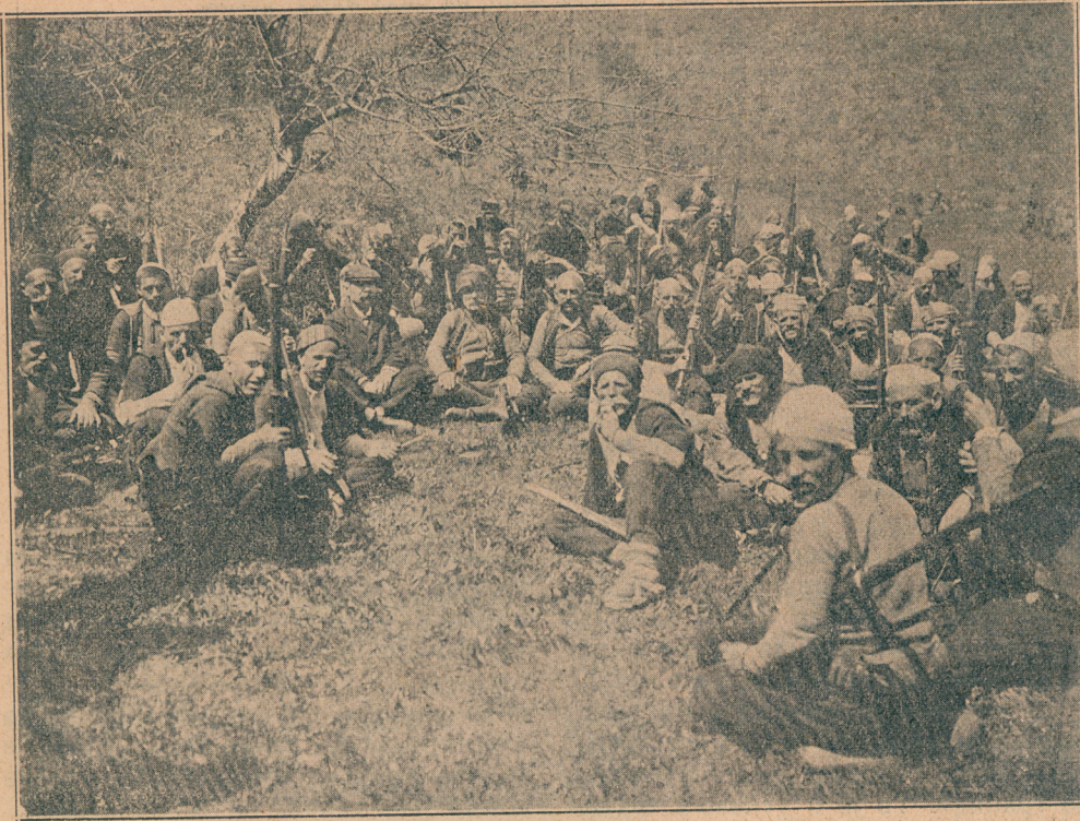
Пратња Исе Бољетинца

вежбања на нашој страни, према селу Давидовцу. Војници су се вежбали хитри и расположени, официри су командовали мирни и прибрани и не слутећи шта их само кроз који тренутак чека.