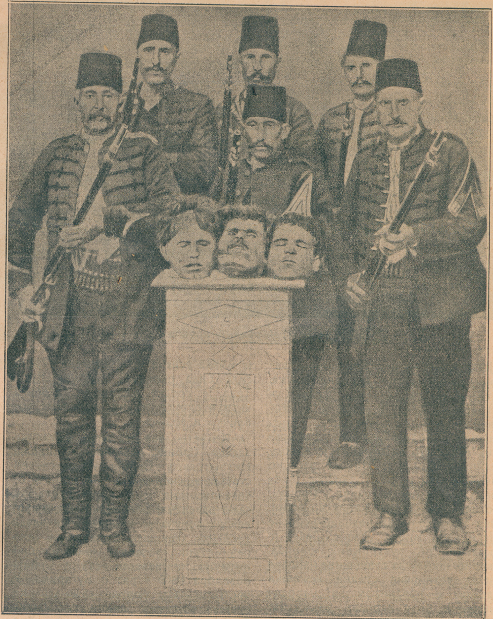
Слика турскога зверства

[На Куманово !] Ноћас и јутрос наше су трупе наставиле продирање ка Куманову и можда још данас по