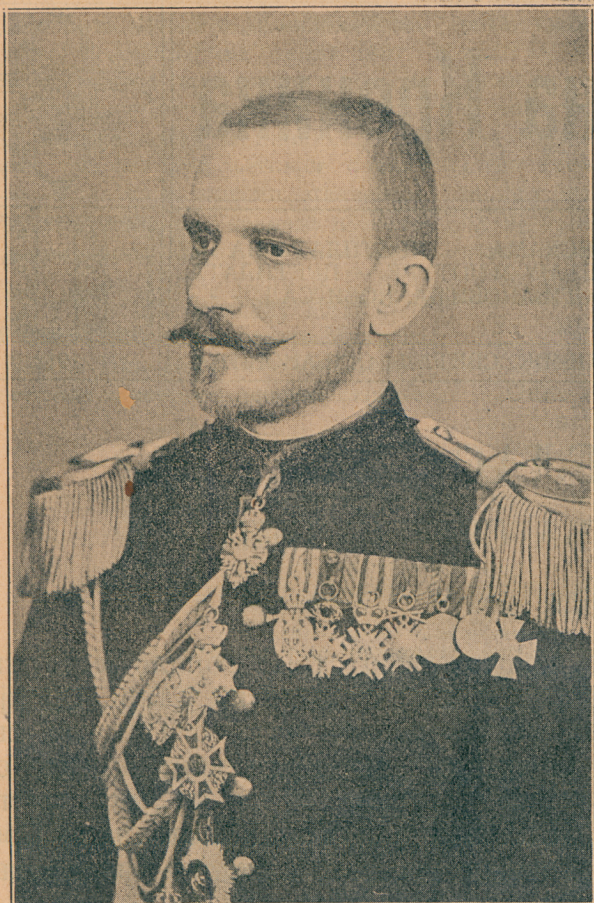
Генерал Живојин Мишић помоћник шефа српског генералног штаба

и своје браће, па олет залуду. Српске су владе за ових тридесет и четири године безуспешно исцрпили сва дипломатска средства и код пријатељских сила и код Порте; шта више, кад се пре неколико година покушало с реформама у неким вилајетима Европске Турске, већи део Старе Србије био је искључен из тога покушаја. Ја сам са своје стране све учинио, да мирним путем исправим ово стање тешко и несносно, и по нас и по браћу нашу. У томе смеру Ја сам ступио у споразум са Краљевима балканских држава да сложено покушамо, заједничком представком у Цариграду, поправити оно што се више не може трпети. У том спремању били смо изненађени мобилизацијом и концентрацијом турске војске према нашим границама. На то се морало одговорити једнаком мером, али смо ипак једном заједничком нотом, испуњеном свим обзирима умерености, учинили последњи покушај да се мирним путем нађе злу лека. На то се одговорило новом сечом наше браће, новим зверствима над њом, новим повредама границе и на послетку опозивањем турских посланика из Београда, Софије и Атине.