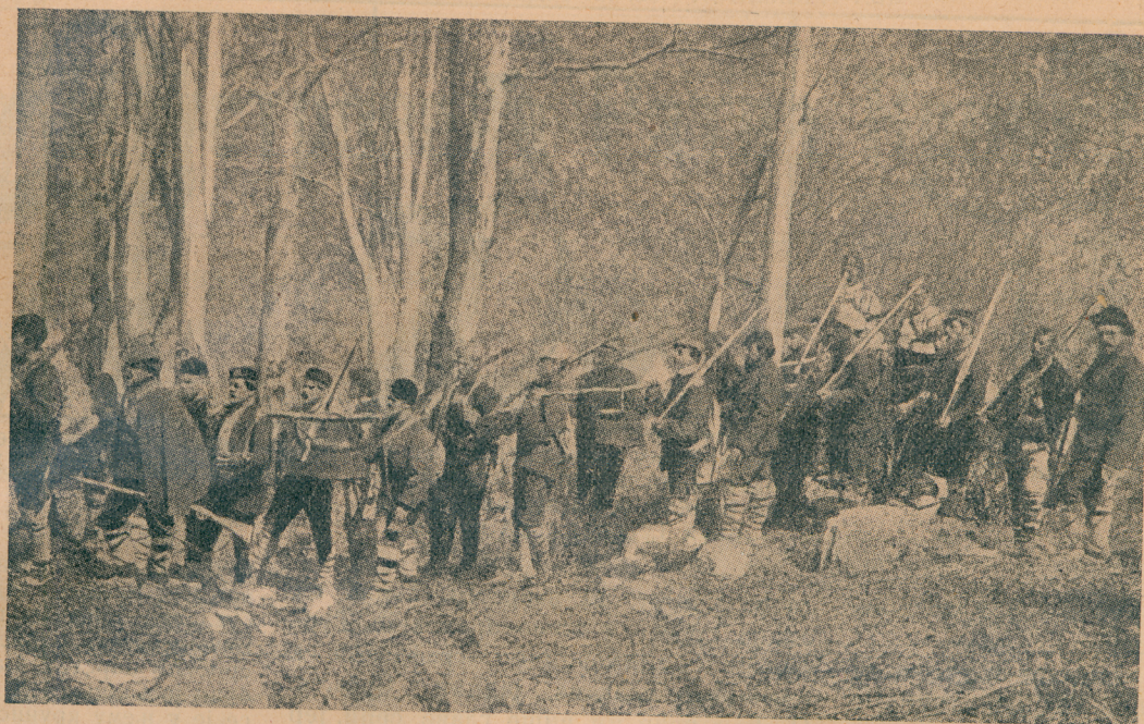
Српске комите прелазе из Србије у Санџак

мали број војника у касарнама). Српски официри су најбољи купци свију стручних и белестричних књига, које се у целом Српству штампају. Сем службеног часописа „Ратника“ готово је сваки српски официр претплатнак Српске Књижевне Задруге, Српског Књижевног Гласника, Бранкова Кола и Босанске Виле.