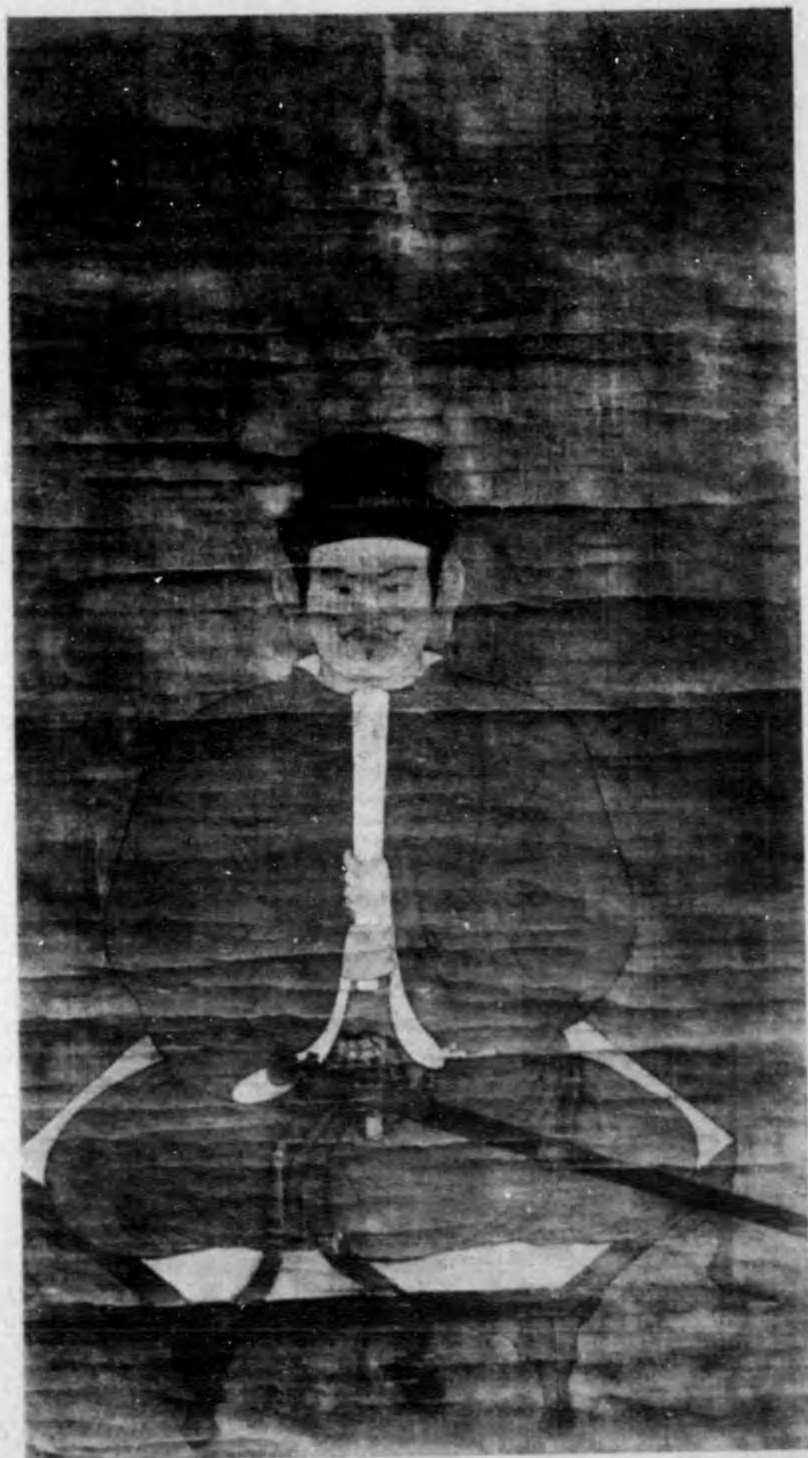
楊 枝 御 影