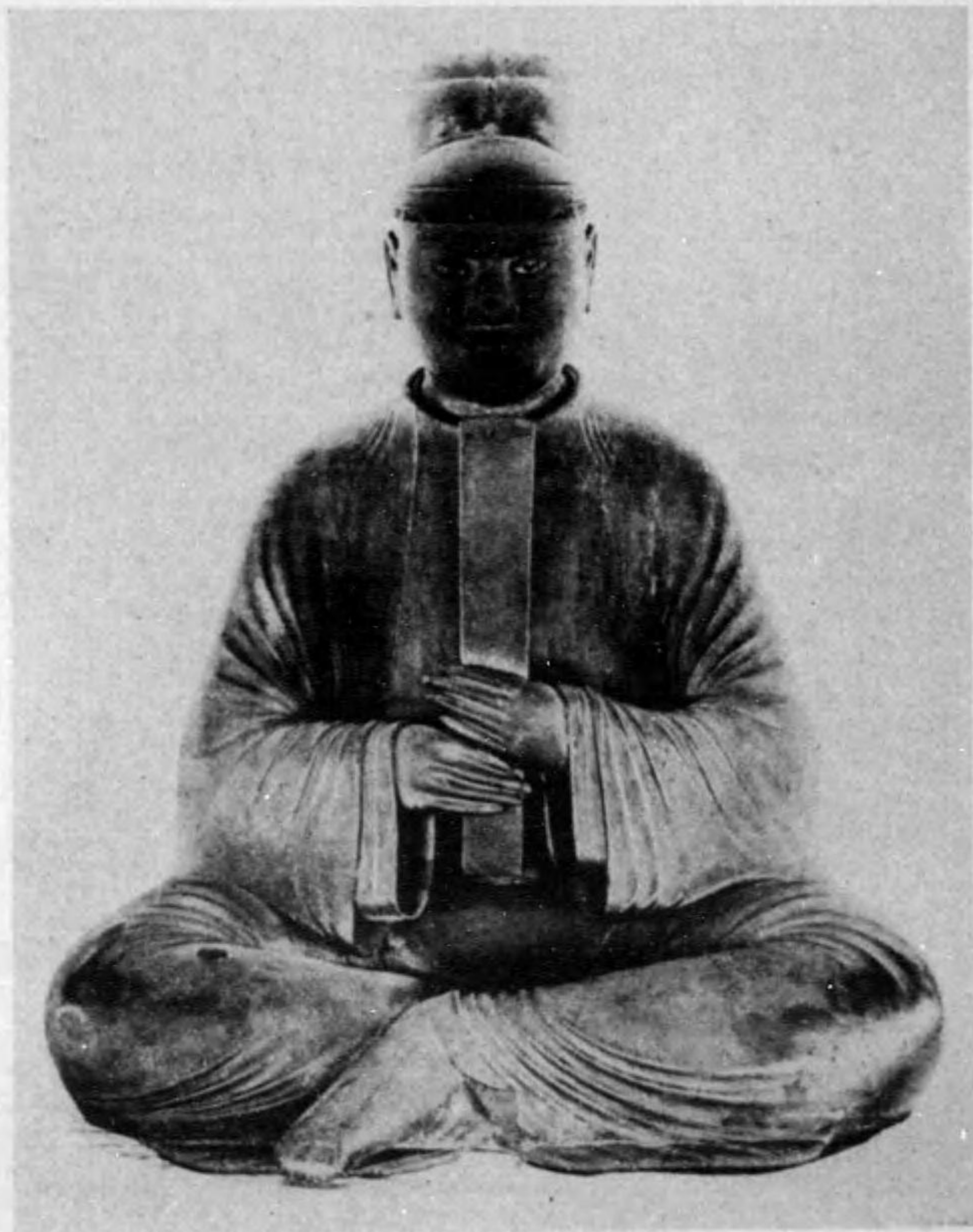
藏院靈聖寺隆法 (寶國) 影御歲五十四御