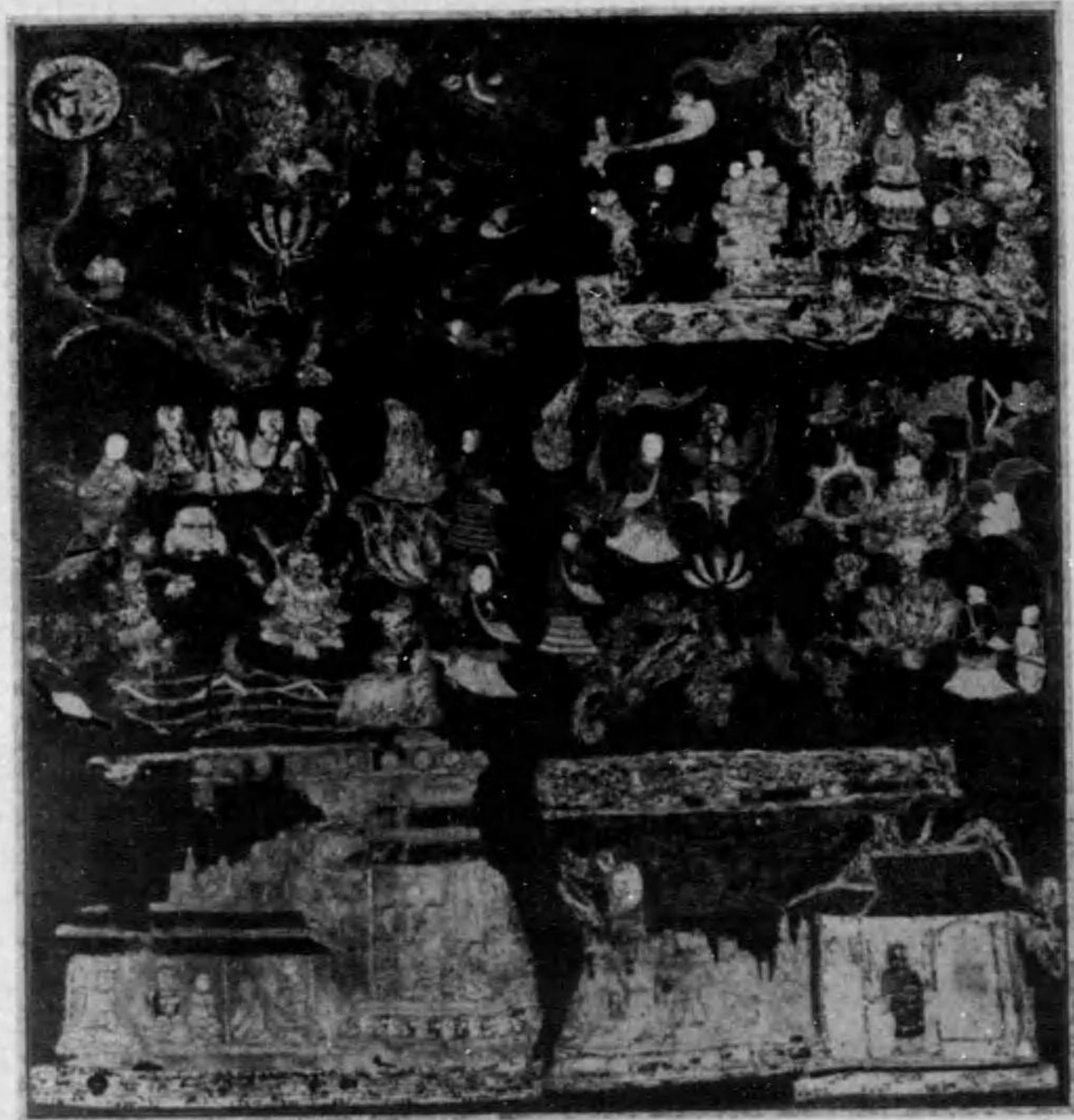
藏 寺 宮 中 (寶 國) 羅 茶 曼 國 壽 天