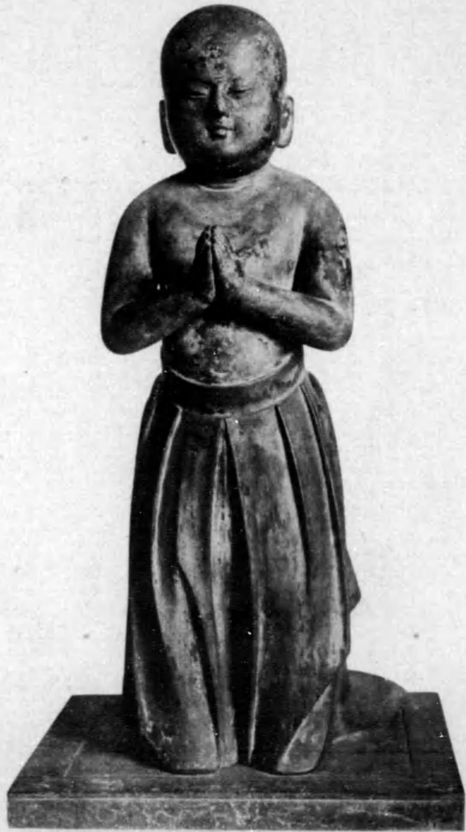
藏寺土淨 (寶國) 影御佛無南