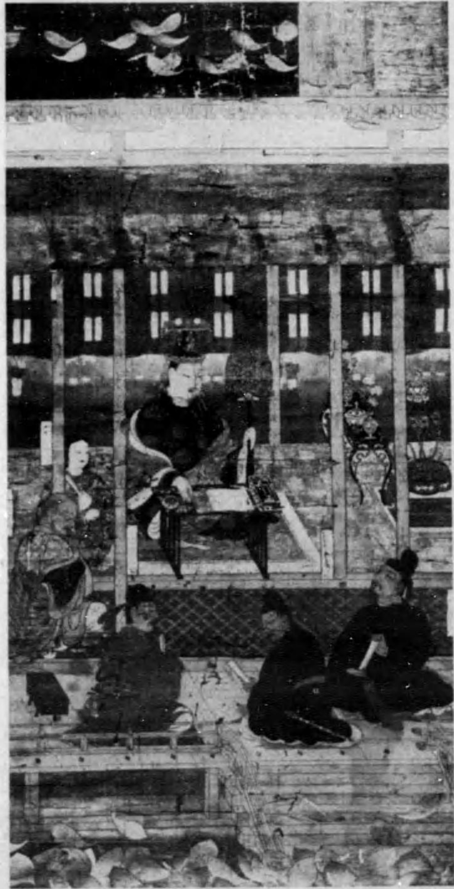
勝鬘經御講讀御影