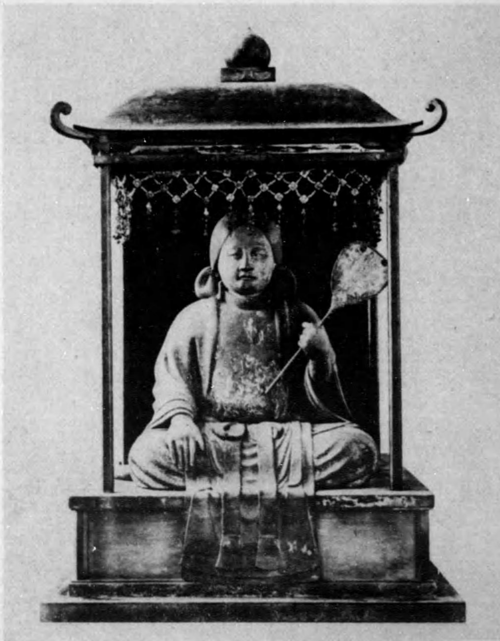
藏寺隆法 (寶國) 影御歲七御