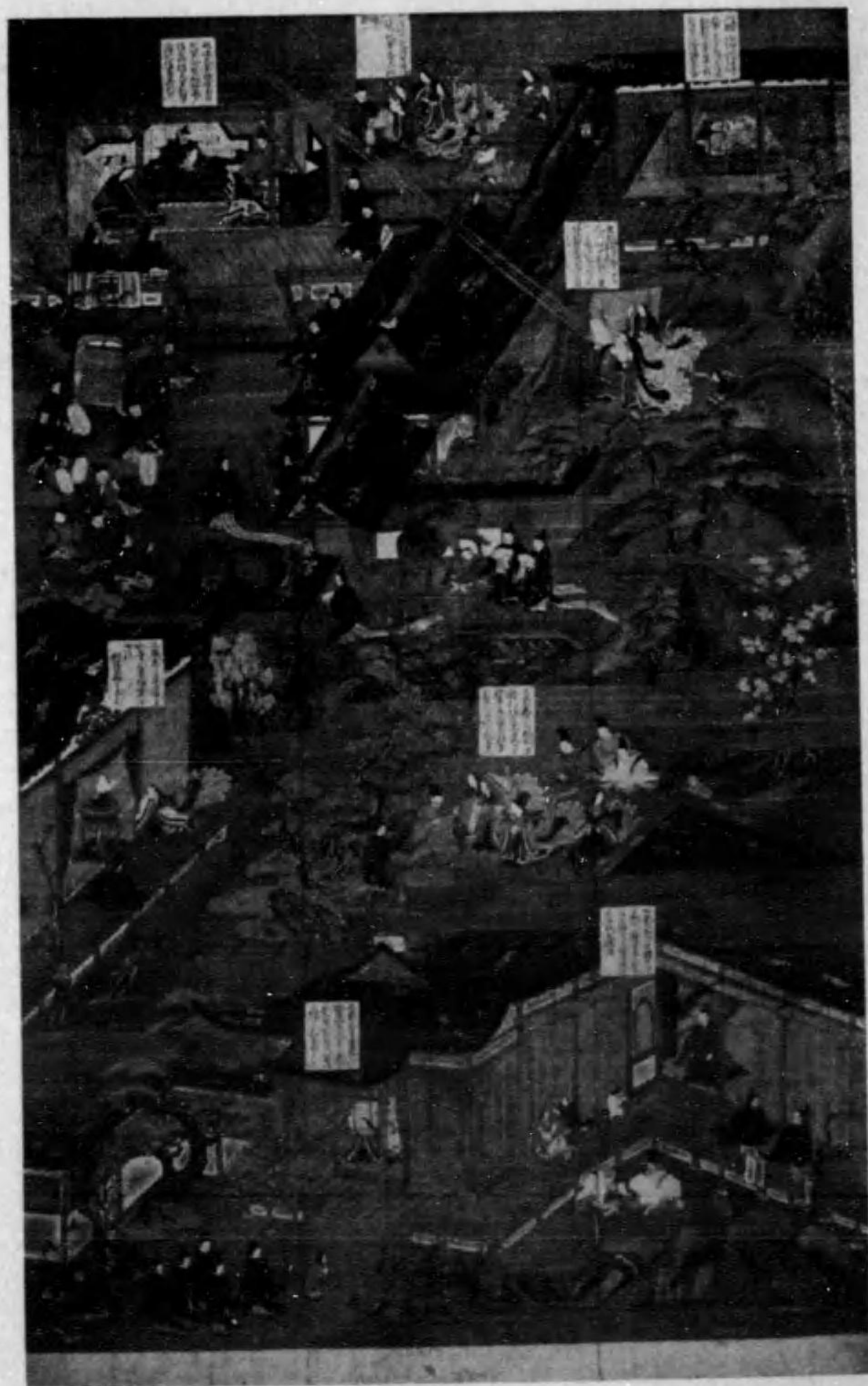
聖德太子御給傳（國寶）