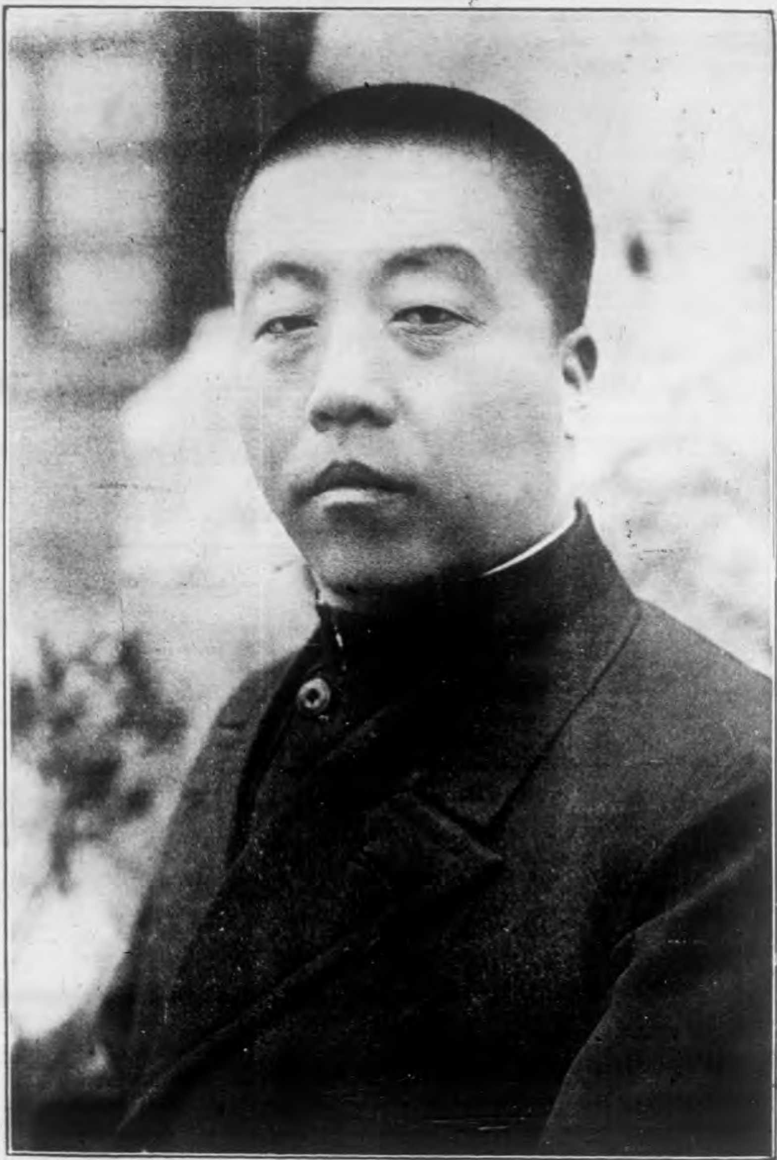
榮 向 王 長 廳