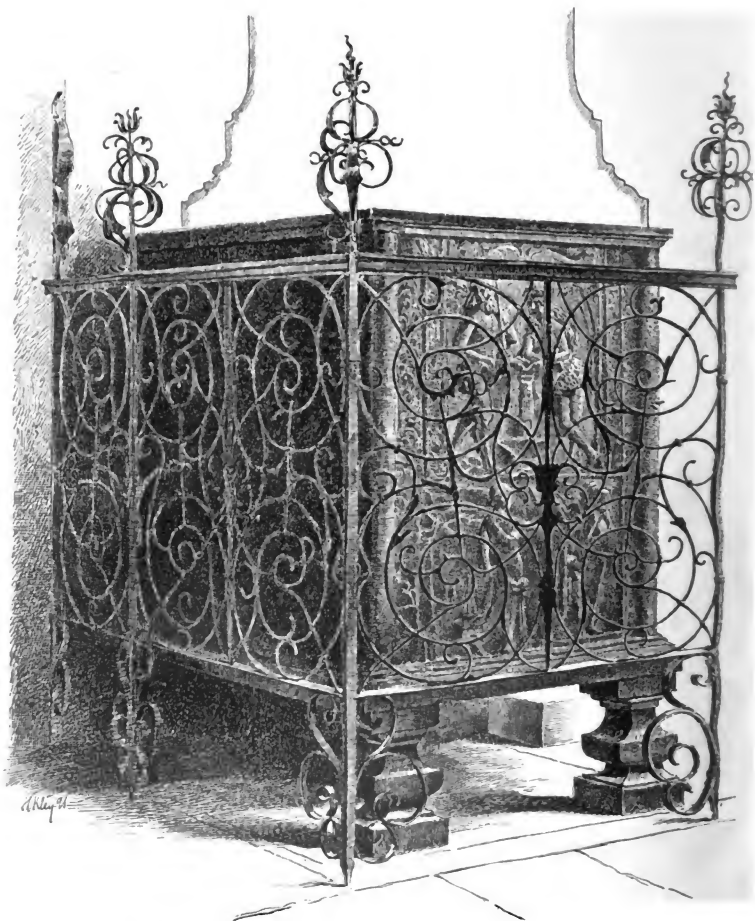
Eiserner Ofen im Rathhauseaale zu Meersburg vom Jahre 1583.