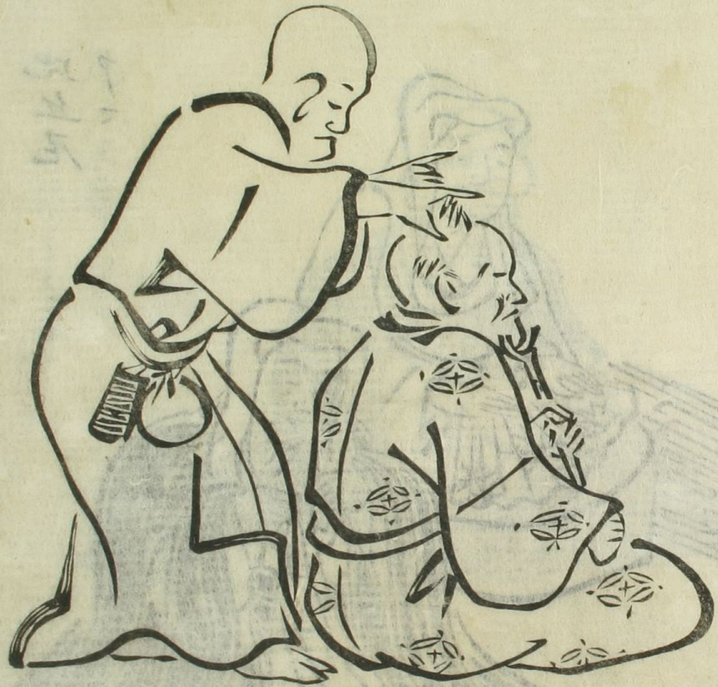
按摩師 アンマトリ