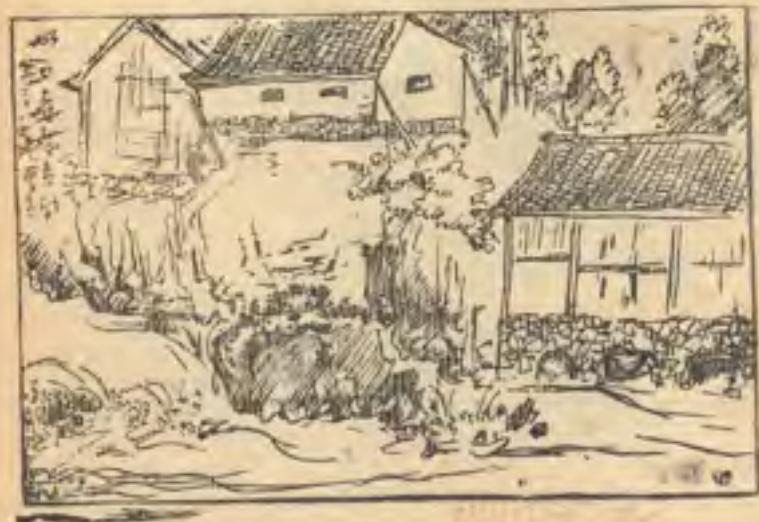
水 口 寺

河明南，一之區景風陽貴爲，郊東城筑位寺口水 鵝，寺古房民有墜沿，山高岸湖，地其流經地西 。絕欲勝幽，店半靜