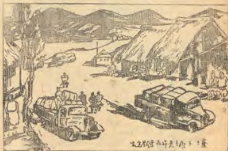
濠子塘在貴陽濟鎮之間

濠子塘，位於貴陽濟鎮之間，地 當衝要，風景宜人，為旅行尖站 ，是指示車輛經行該地情形。