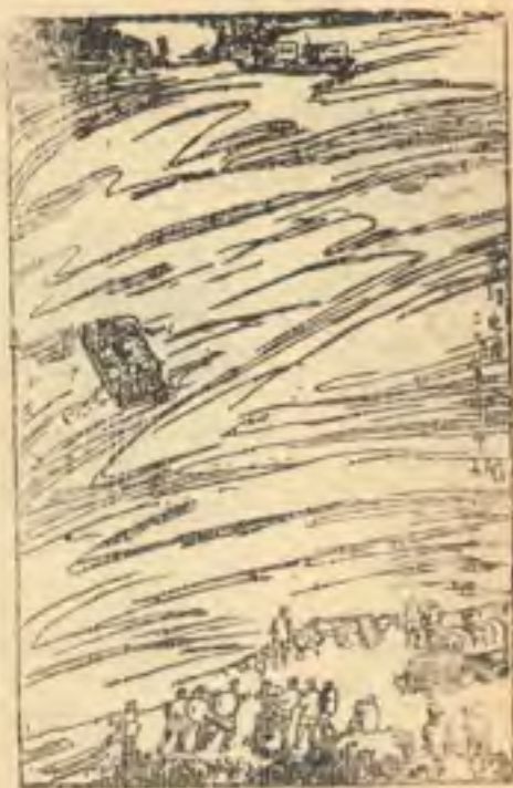
烏 江 渡

烏江爲西南之天險，亦爲川黔交通孔道，每屆雨季，山洪暴發，水位之高，達十數丈，水速湍激，一瀉千丈，勢如萬馬奔騰。自昔往來於川黔之旅客，輒視爲畏途，近建築碼頭添設渡船以順，旅客稱便。此稿所寫，係二十九年渡頭情形。