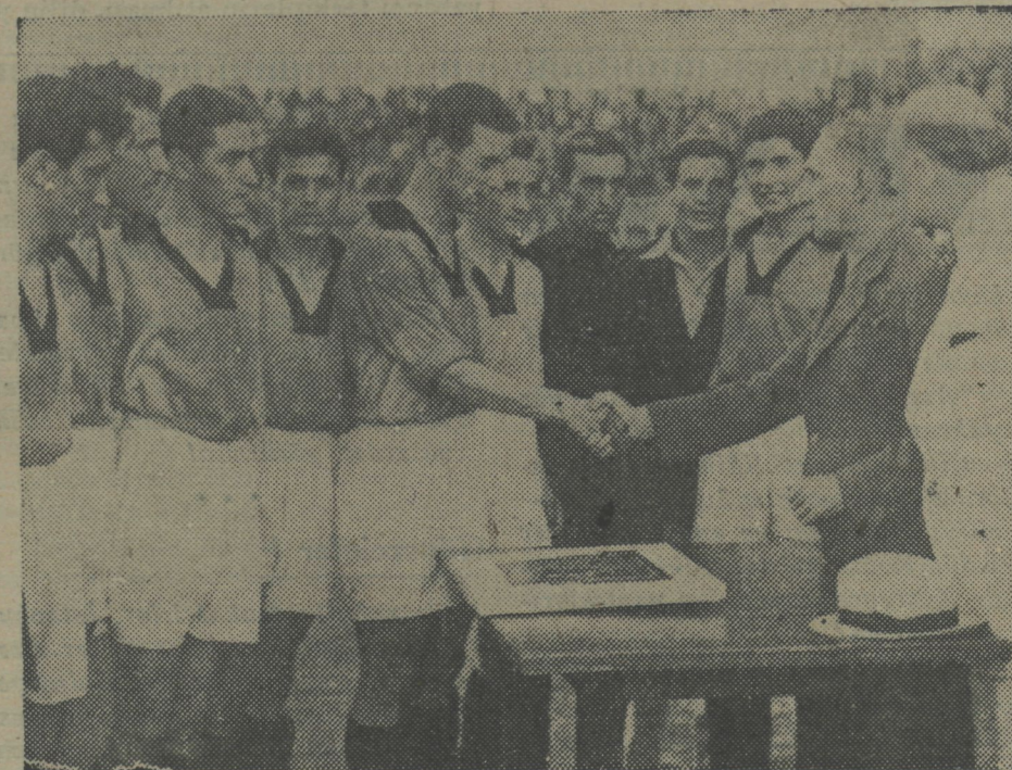
Şampiyonluğu kazanan Gençlerbirliği takımı

Oyun her şeye rağmen 4-1 Gençlerbirliği lehine neticelendi