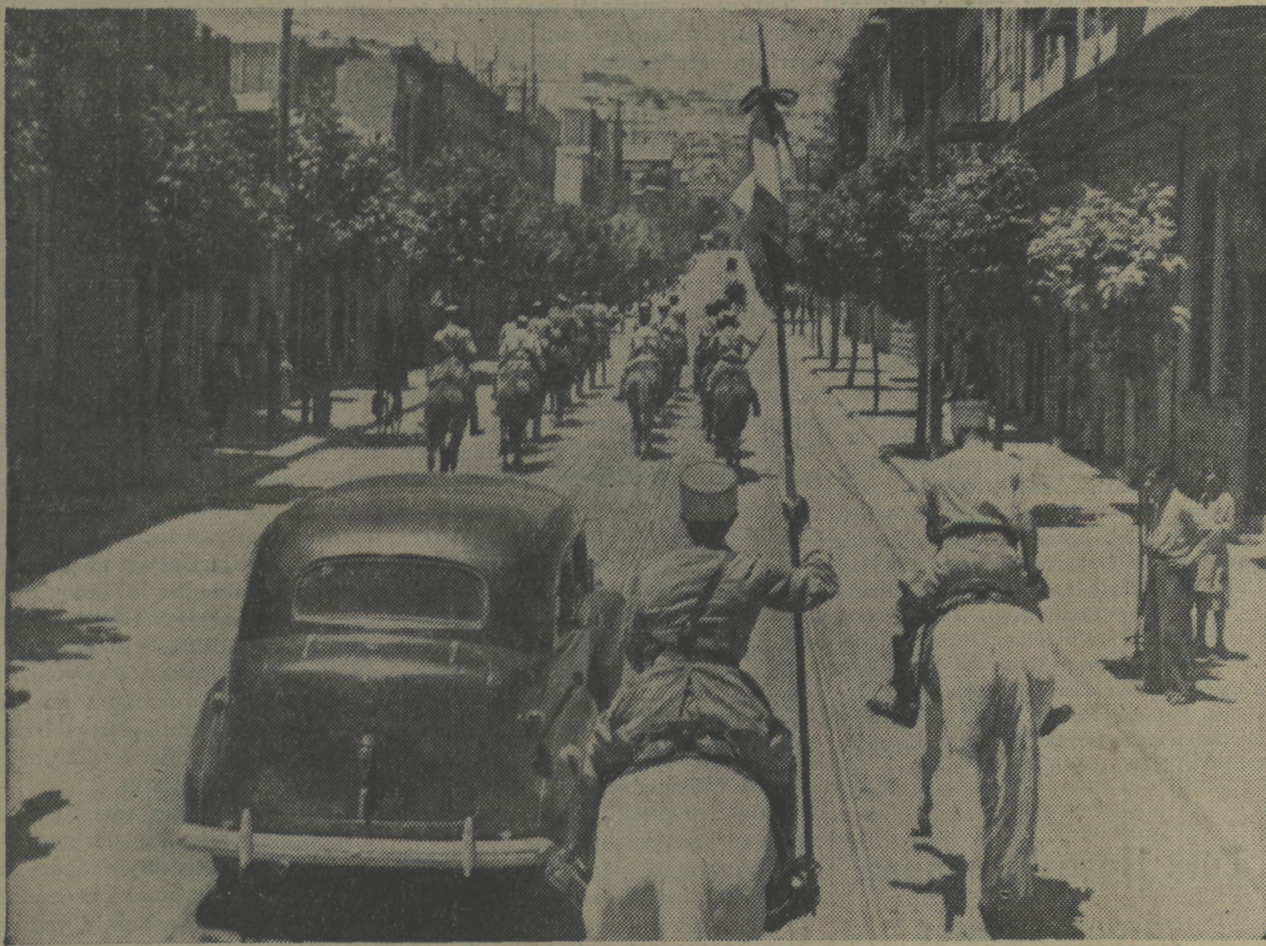
Müttefik kuvvetler Şam'a girerlerken