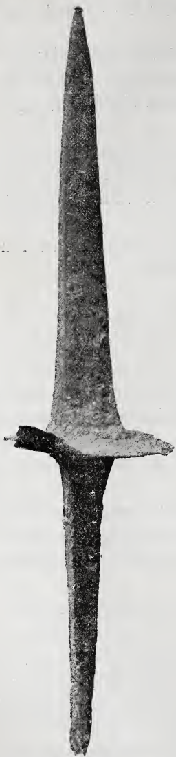
Pointe de plançon à picot, ou Goedendag, 1/2 de la grandeur réelle.

vraiment si le néologisme décalibré , pour lequel M. Van Maldeghem demande des lettres de petite naturalisation, ne s'applique pas au système archéologique qui le créa.