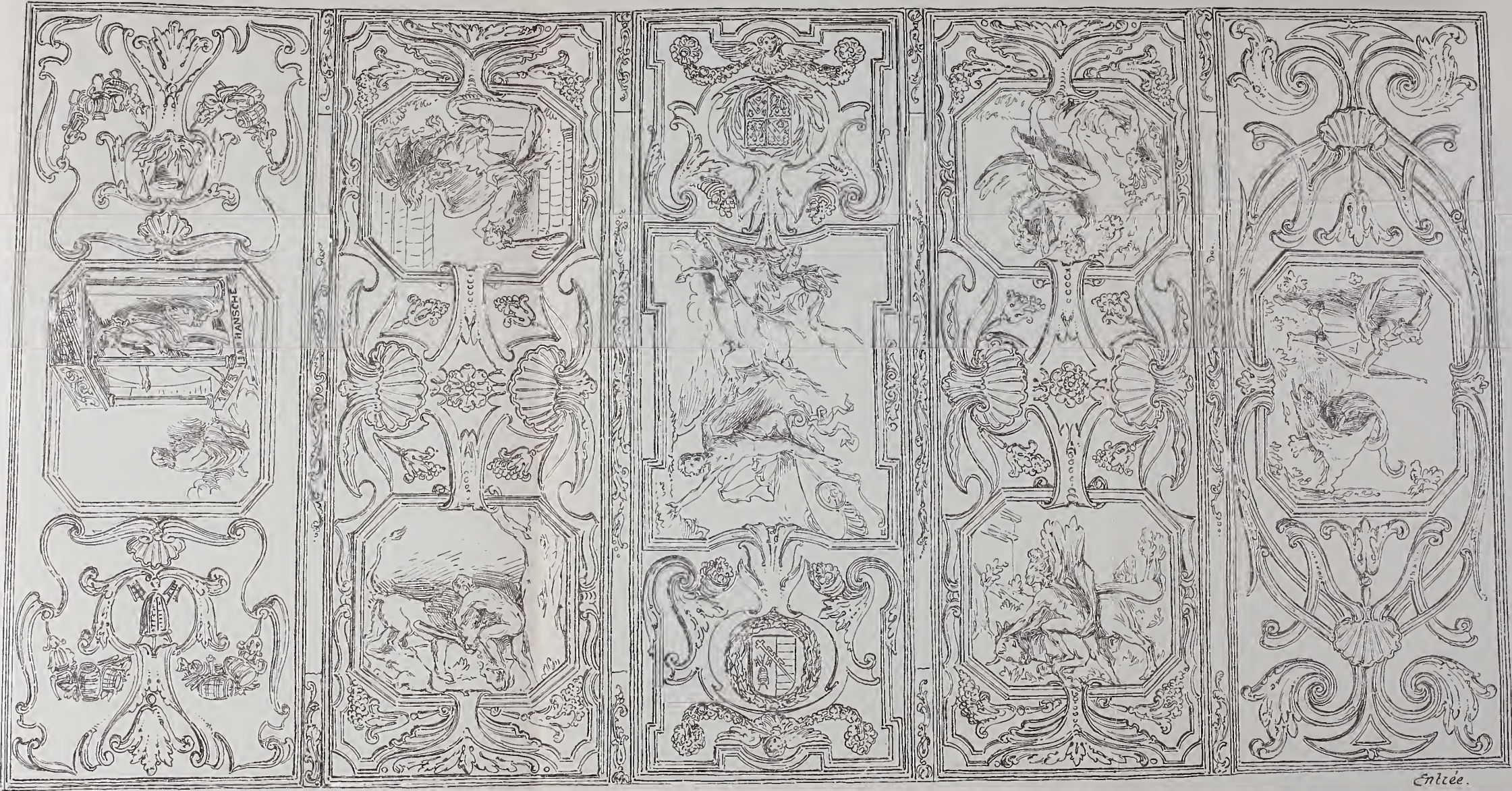
PLAFOND DE L'ANCIENNE MAISON DES BRASSEURS A GAND.