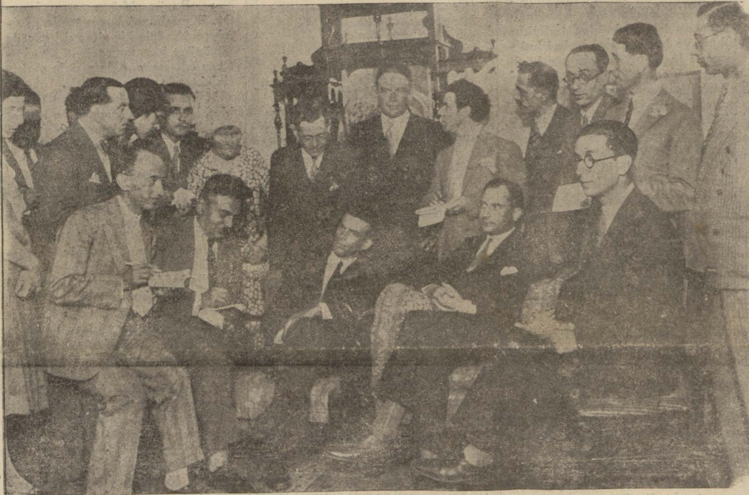
Hava kahramanları dün etraflarını saran gazetecilere zaferlerini anlattılar

Amerikan tayyarecileri dün intibalarını, memleketimiz ve Gazi'miz için duyduklarını anlattılar