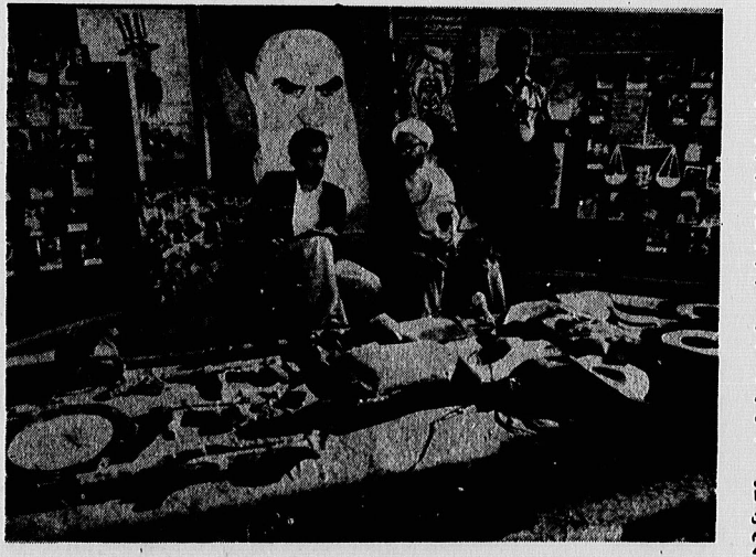
آیاتالله خلیفای، دیروز، در باره سلاحها و نقشه‌ها دست آمده از طیورهای امریکایی در طبع.