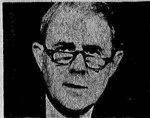
ونس: اعتراض شدید به کار تر تأخذ استعفا!