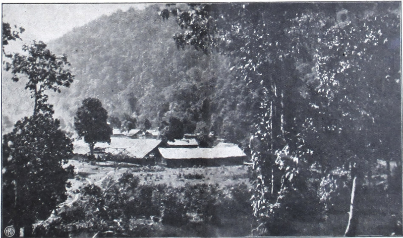
ပြည်ကိုင်ဆိုင်ရာ အကျိုးအမြတ်ကို ဖော်ပြသော အကျဉ်းချုပ် (အကျဉ်းချုပ်)။ ဤသည်မှာ ကော့ကုတ်မြို့ရှိ နေထိုင်မှု အကျိုးအမြတ်ကို ဖော်ပြသော အကျဉ်းချုပ် ဖြစ်ပြီး နေထိုင်မှု အကျိုးအမြတ်ကို ဖော်ပြသော အကျဉ်းချုပ် ဖြစ်သည်။