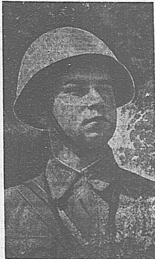
В Действующей армии. Зенитный расчет, который командует заместитель политрука тов. Рубин, показал высокую огневую мощь. Расчет был с вражеского самолета. На снимке: командир зенитного расчета заместитель политрука тов. РИДИН.