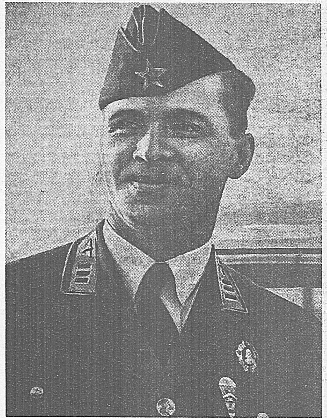
Дважды Герой Советского Союза подполковник Степан Павлович СУПРУН.