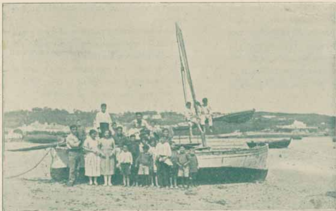
Escenas de la playa durante la bajamar