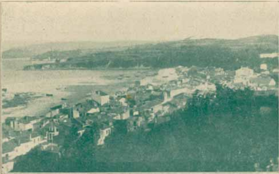
Vista general del alegre y progresivo pueblo de Sada