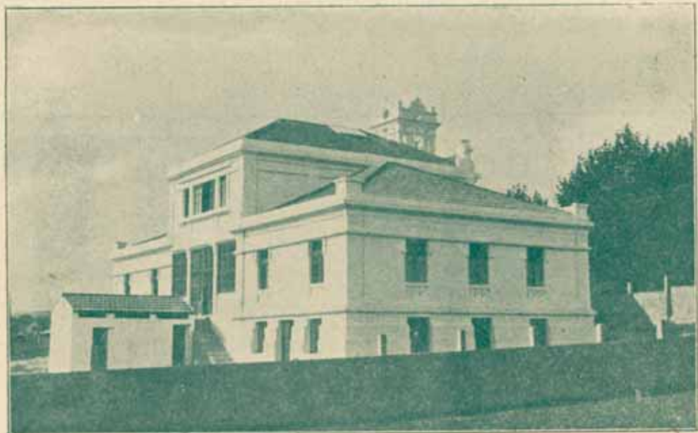
Edificio del Grupo Escolar, costeado por la asociación «Sada y sus Contornos», residente en América