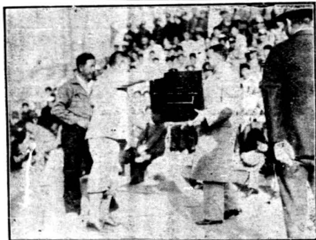
沈市長親發「成章杯」受接情形

兩週賽罷，則此盛會已漸入於白熱時期，時嚴霜既降，楓葉漸紅，公園景色又如二月之多花矣，網球場面對公園，益令人心曠神怡。第三週即於此美麗之環境中，先後共賽七