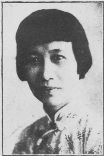
任主所托寄兒嬰立市市州廣 士女灌若孔