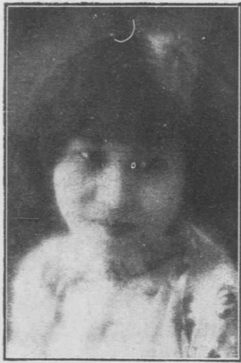
員委務常會女婦市州廣 士女霞慧鍾