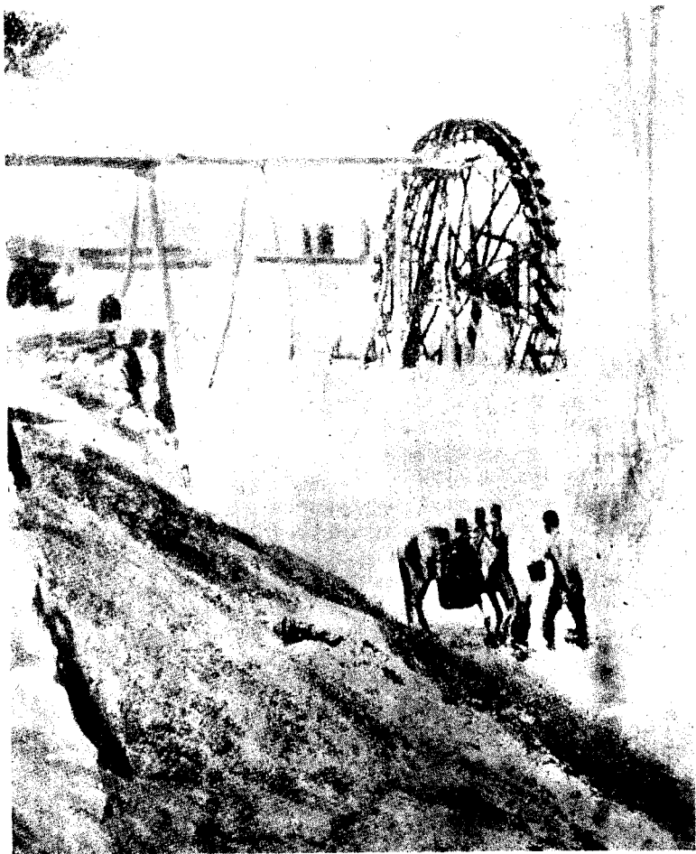
黄河上流宁夏地方的水车(见A. L. Stron, "China Reise")