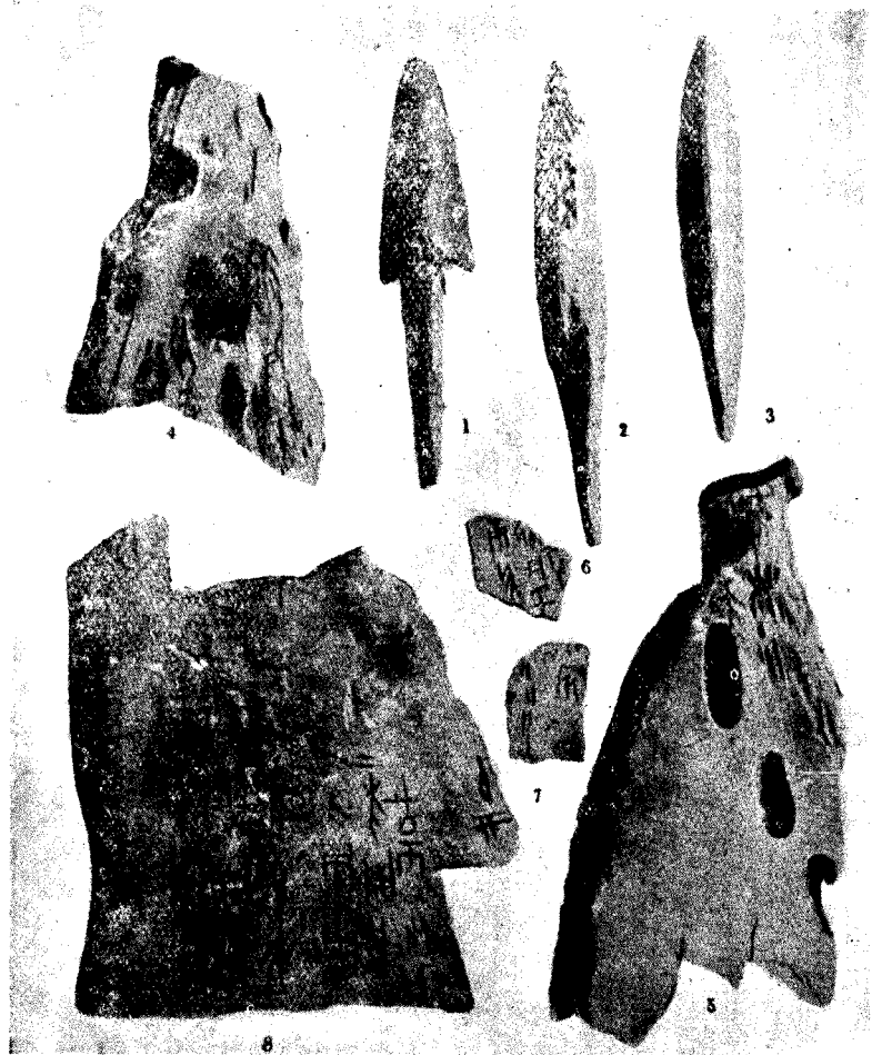
殷墟出土之骨鏃(1-3)及貞卜獸骨(4-8)