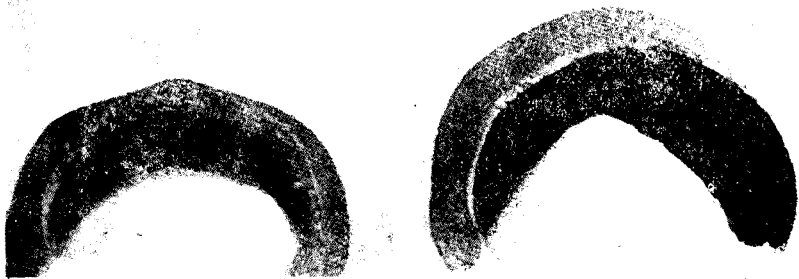
北京猿人(左)與近代人(右)的頭蓋骨的比較