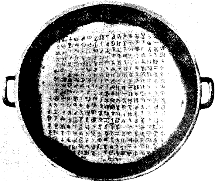
周朝的散氏盤及其銘文