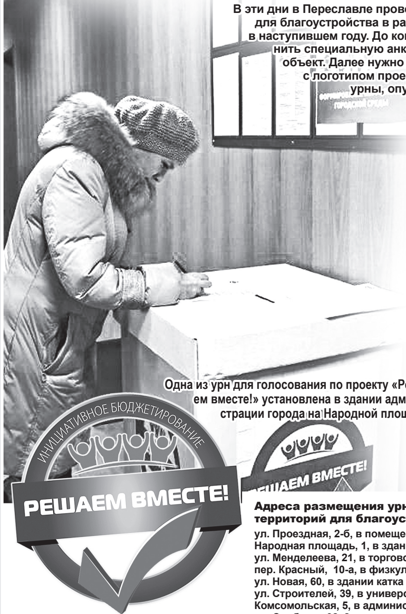
Одна из урн для голосования по проекту «Решаем вместе!» установлена в здании администрации города на Народной площади

В эти дни в Переславле проводится предварительный отбор территорий для благоустройства в рамках реализации проекта «Решаем вместе!» в наступившем году. До конца января каждый желающий может заполнить специальную анкету, проголосовав тем самым за какой-либо объект. Далее нужно опустить заполненную анкету в одну из урн с логотипом проекта. Список адресов, где установлены такие урны, опубликован на этой странице (смотрите ниже)