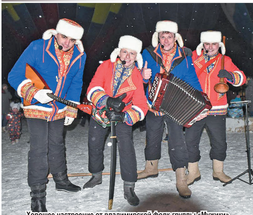
Хорошее настроение от владимирской фолк-группы «Мужики»