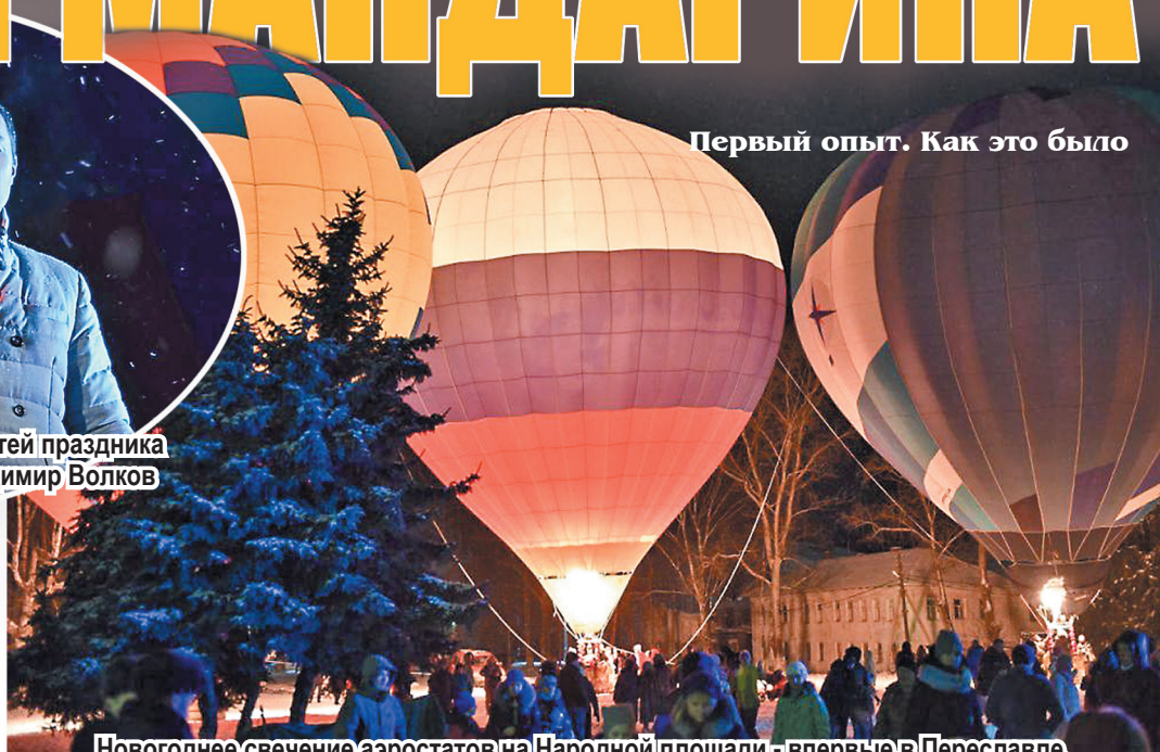
Новогоднее свечение аэростатов на Народной площади - впервые в Переславле