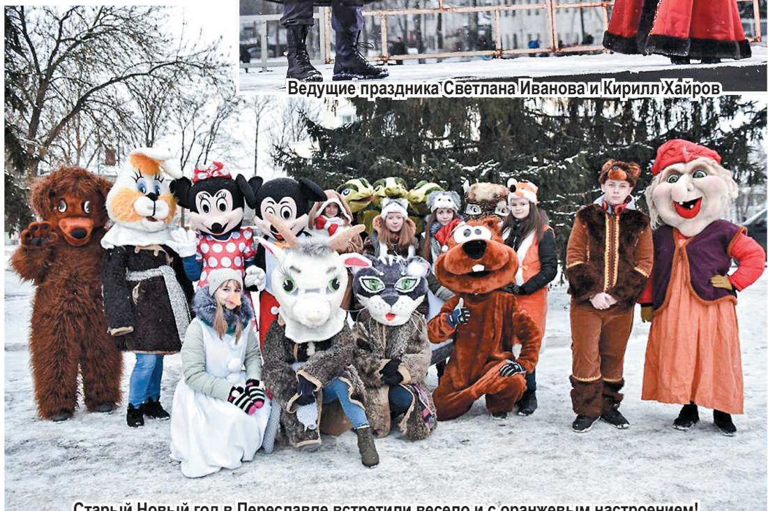
Старый Новый год в Переславле встретили весело и с оранжевым настроением!