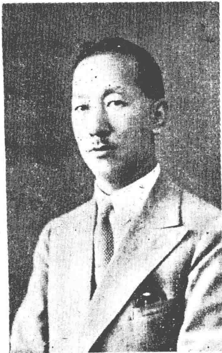
影 近 者 作