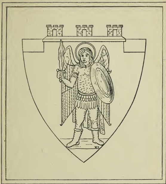
Герб давньої Київської землі.

кладає, щоб рідну країну визволити зпід московської кормиги-неволі.