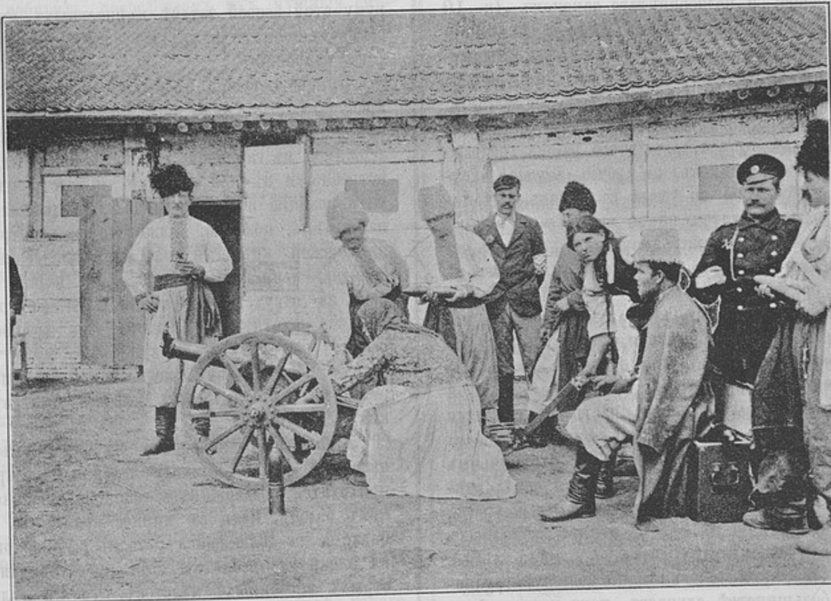
Участвующіе въ спектакль нижніе чины (къ корреспонденціи «Харбинь»).

вычайно полезную для крѣпости. Стоитъ только обязать всѣ роты крѣпости имѣть охотниковъ, чтобы заполнить и съ этой стороны пробѣлъ въ организаціи гарнизона. Въ настоящее время, пользуясь тѣмъ, что приказъ № 260, 1886 г., сдѣлалъ «необязательнымъ» заведеніе охотниковъ въ специальныхъ родахъ оружія, эти послѣдніе ихъ не имѣютъ и въ крѣпости, что и обуславливаетъ крайнюю малочисленность крѣ-