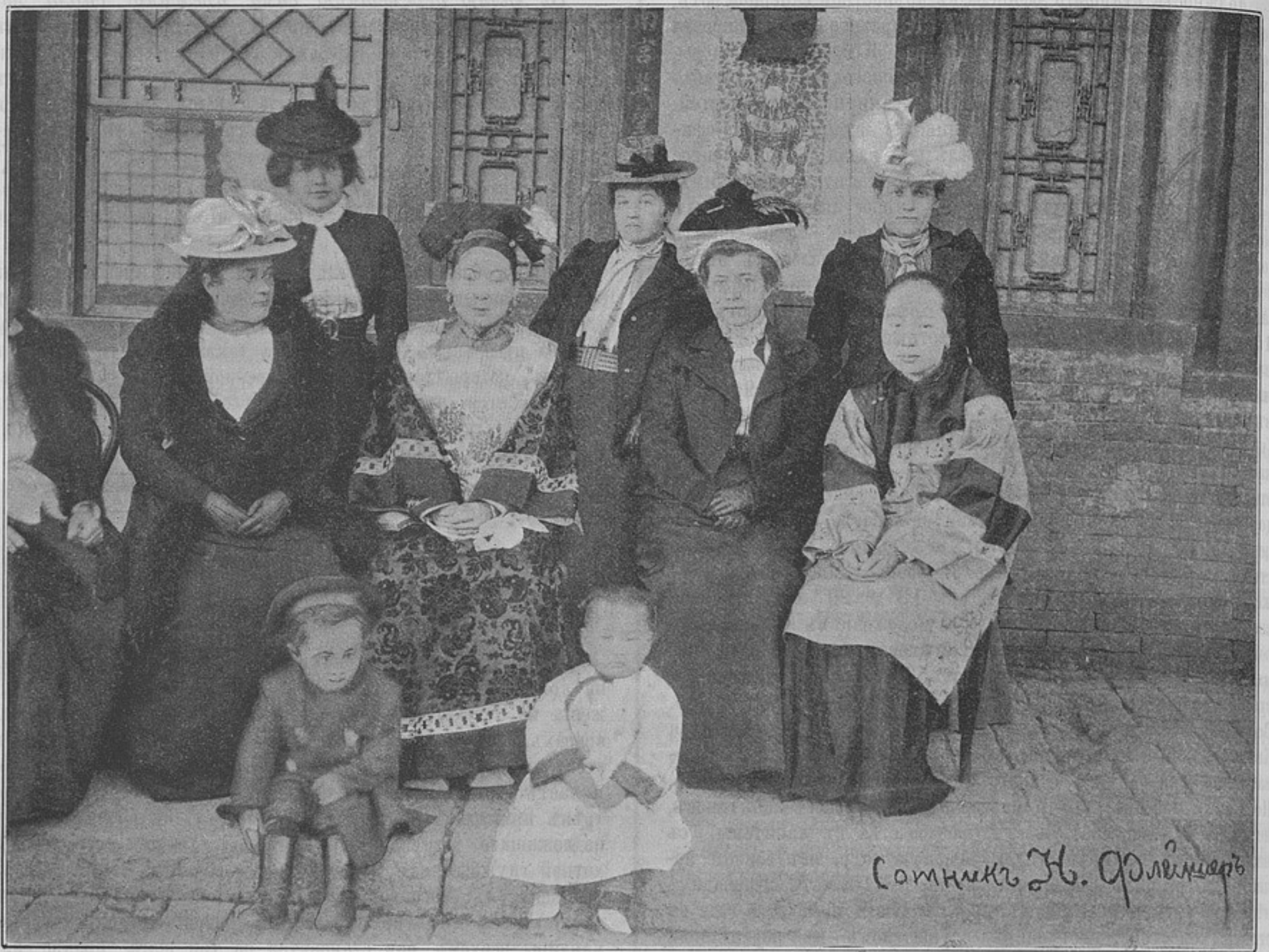
Группа русских дамъ съ женами фудутуна (къ корреспонденціи «Харбинь»).

Въ 1899 году въ лагеряхъ подь Краснымъ Селомъ въ періодъ отрядныхъ маневровъ, когда роты были сводныя (каждая рота составлялась изъ двухъ ротъ), большинство командировъ полковъ давали командирамъ этихъ ротъ казенныхъ лошадей отъ свободныхъ баталіонныхъ командировъ и баталіонныхъ адъютантовъ. Въ настоящее время верховая ѣзда въ пѣхотѣ вообще значительно улучшилась. Командиры полковъ разрѣшаютъ брать офицерамъ лошадей для обученія ѣздѣ у конныхъ ординарцевъ; это право особенно важно для офицеровъ, желающихъ поступить въ академію генеральнаго штаба, гдѣ экзаменъ по верховой ѣздѣ весьма серьезный, и если не ошибаюсь, то въ прошломъ году два офицера исключительно не попали въ академію изъ-за верховой ѣзды. По нашему мнѣнію желательно