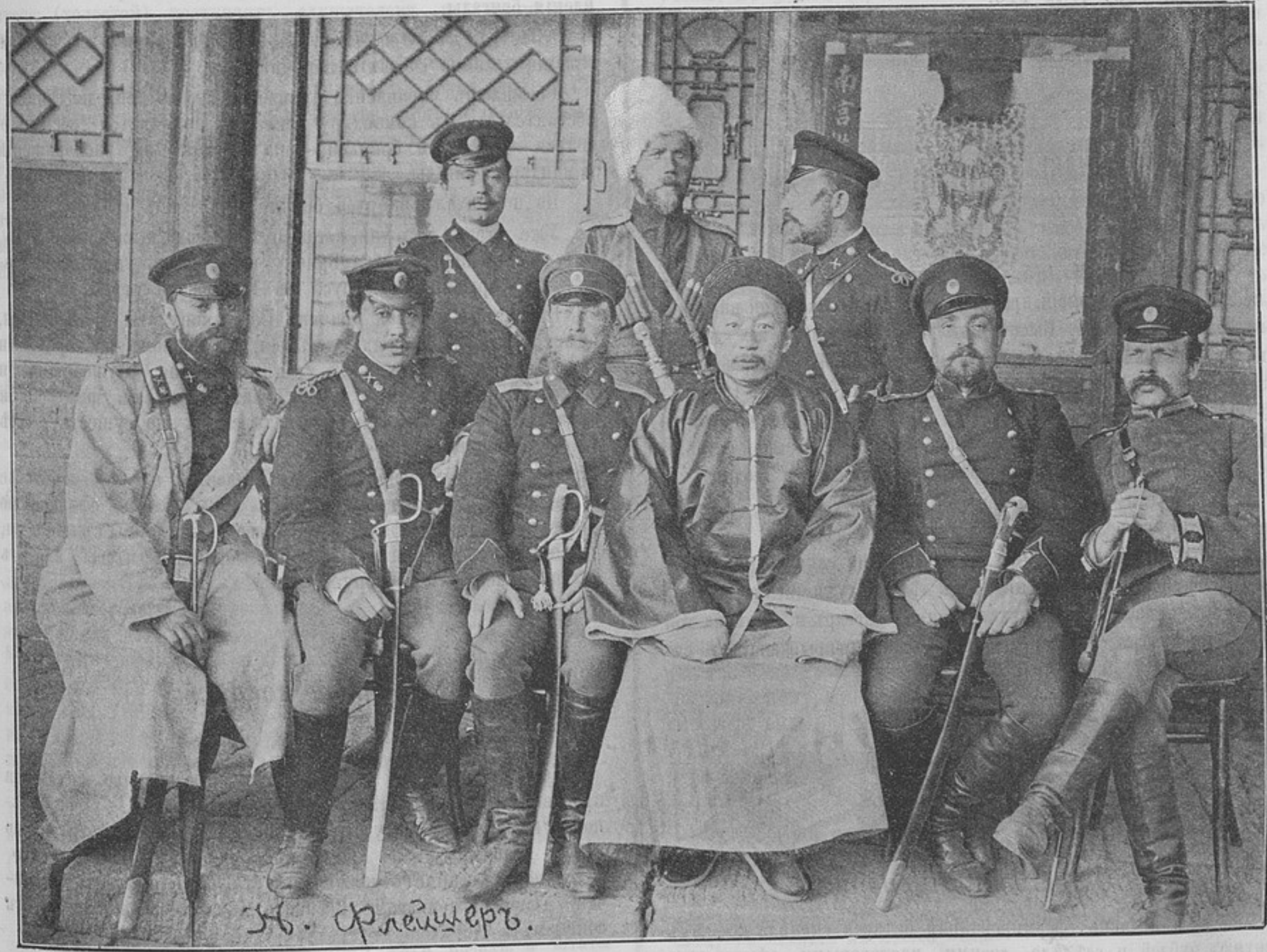
Фудутунъ (градоначальникъ) въ группѣ русскихъ офицеровъ (къ корреспонденціи «Харбинь»).

При этомъ № 563 „Развѣдчикъ“ прилагается бесплатно для всѣхъ подписчиковъ за 1901 годъ „Развѣдчикъ для солдатъ“. Экземпляры сданы почтамту одновременно для подписчиковъ, внесшихъ годовую плату полностью при самой подпискѣ, а потому не получившіе означеннаго приложенія благоволятъ немедля сообщить объ этомъ въ редакцію, для заявленія почтамту.