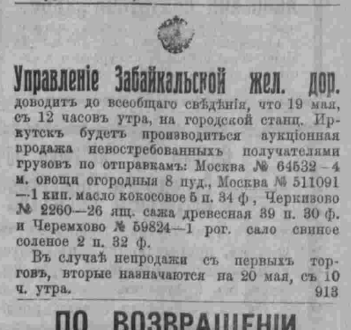
Управление Забайкальской жел. дог. доводитъ до сведения гражданъ, что 19 мая...