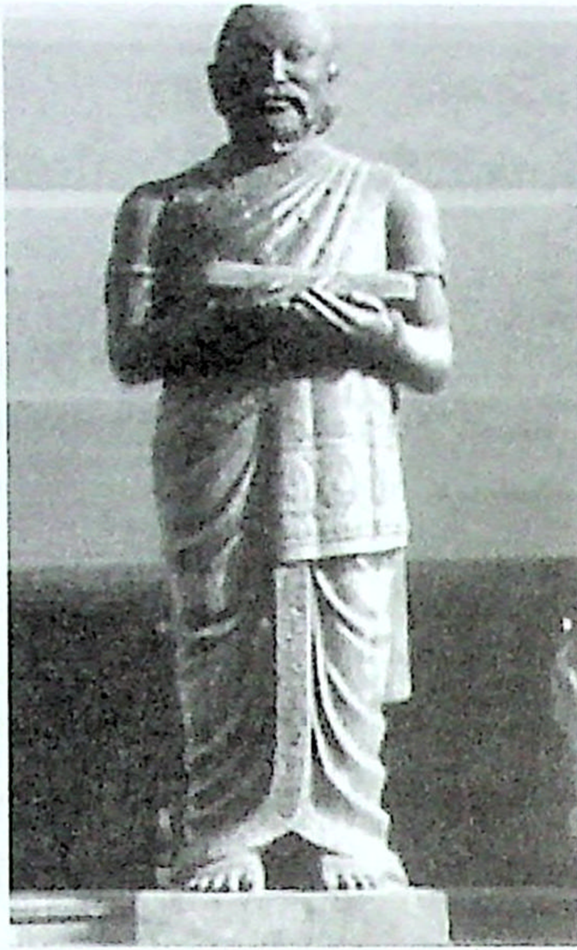
கம்பர் சிலை (சென்னை)