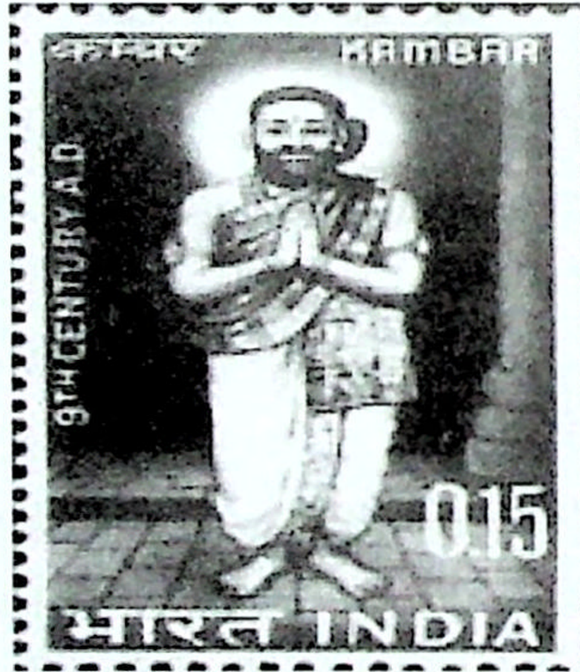
கம்பர் அஞ்சல் தலை