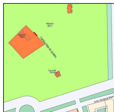
Planeamiento vigente SIGESPA

PLANEAMIENTO: PGOU (BOE 14/01/1989) HOJA PLAN GENERAL: 17 CLASE DE SUELO: SNU CALIFICACION: USO: SIN USO PROTECCION ANTERIOR: OTROS: Corrección de Errores: DOGV 03.05.1993