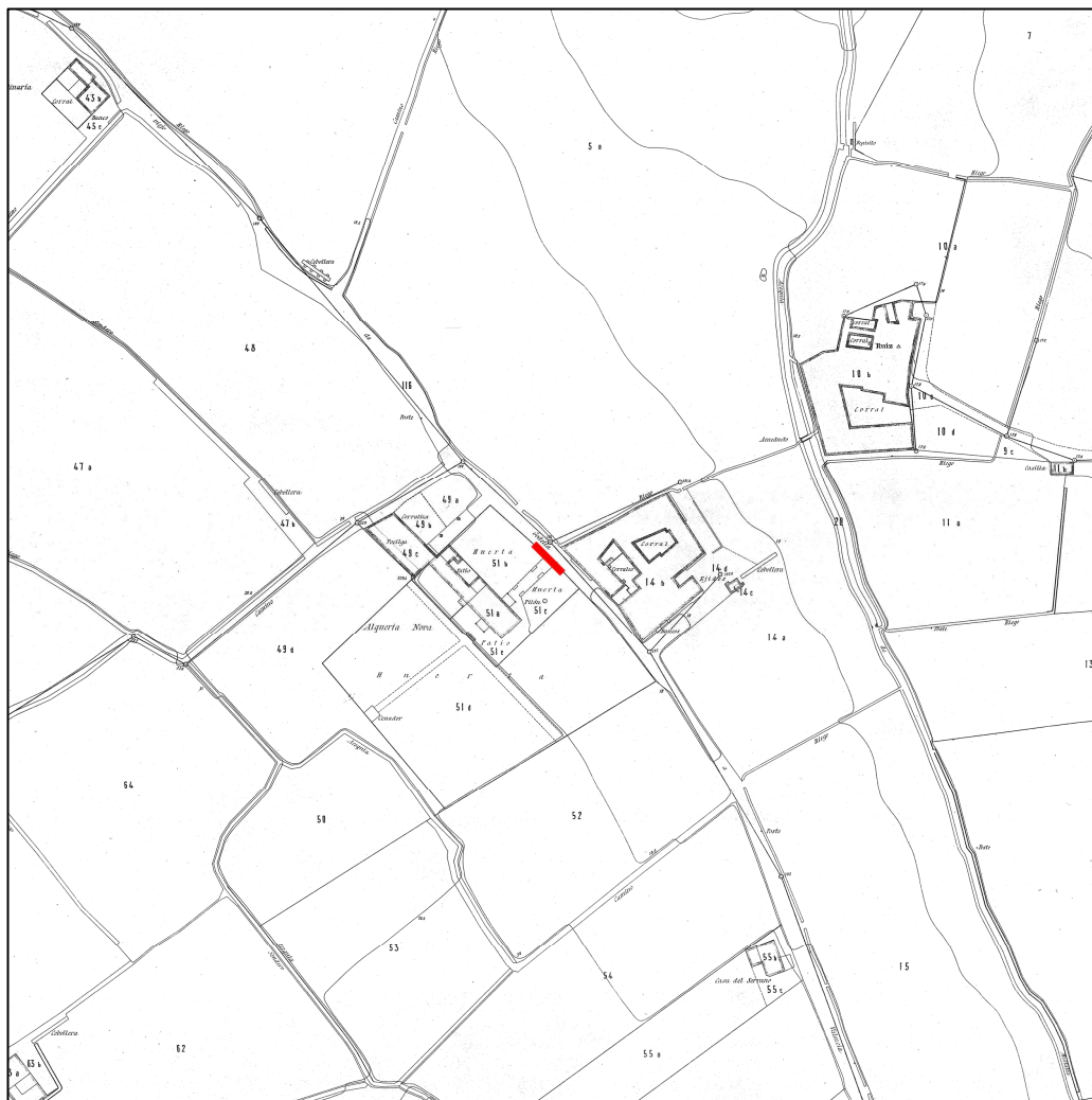
Cartográfico Municipal 1929-1945

San José se encuentra semiarrodillado sobre una nube peana flanqueado por dos angelitos. Firmado en el ángulo inferior derecho al Niño Jesús y con la mano derecha portador de una pequeña cruz. Sobre ellos el resplandor y la paloma símbolo del Espíritu Santo. El angelito situado a su izquierda tiene en la mano la barra florida, el atributo de San José y el otro angelito, a su derecha, la filatería. Todo el grupo esta cobijado por una hornacina ficticia formada por un arco de medio punto y dos columnas Jónicas. Tiene otra orla exterior rectilínea decorada con botones, hojas y un rallado paralelo azul y marrón. En la parte superior central pone "AÑO 1940", y en la parte inferior otra carlela con "SAN JOSEP". (1)