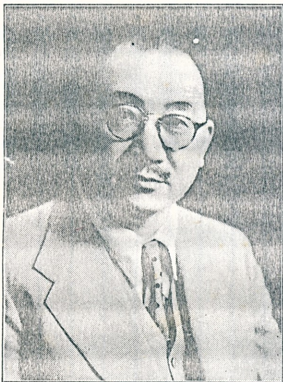
孔 兼 部 長 玉 照