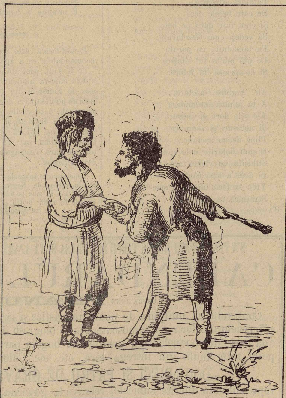
Pênë unde merge ingratitudea unorü ómeni perversi : pe cândü Românulü îi dă uă bucățică de pâine, elü îi răspunde cu bâta.