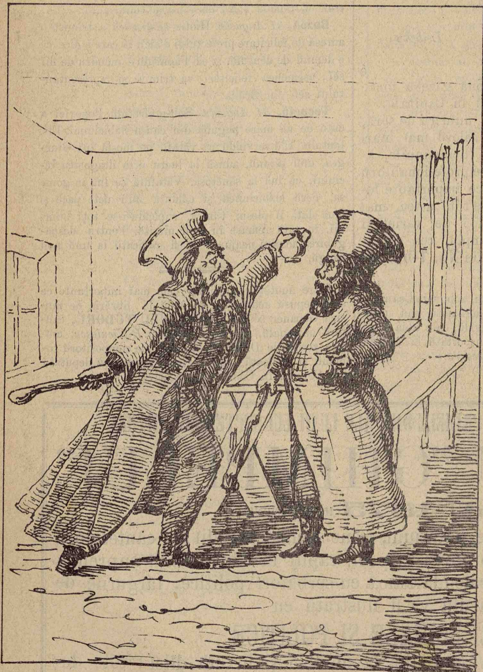
Cucerniculü Tache stă gata a se lua la luptă cu Drăganü pentru că la imitatü la borcanü și la votü.