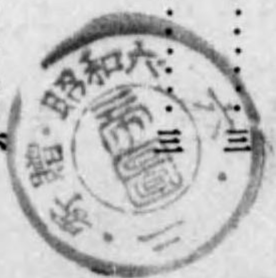
主要食糧農產物改良増殖獎勵事業要覽 正誤表