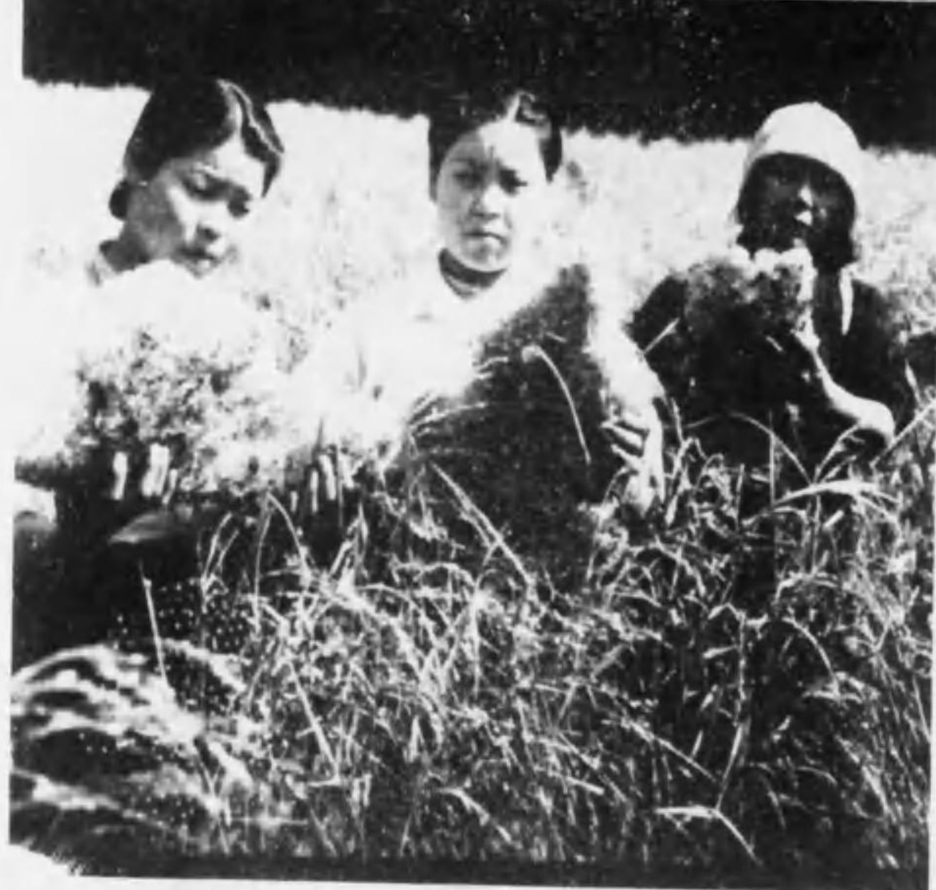
電害ヲ襲フ方地生桐多勢ヲ部北郡馬群 (處ルタン出取ア塊ガリヲ類類ヲツナニ無皆獲牧日野内出) (影写手技津黒) 日八月十年五十和昭 村記長郡馬群