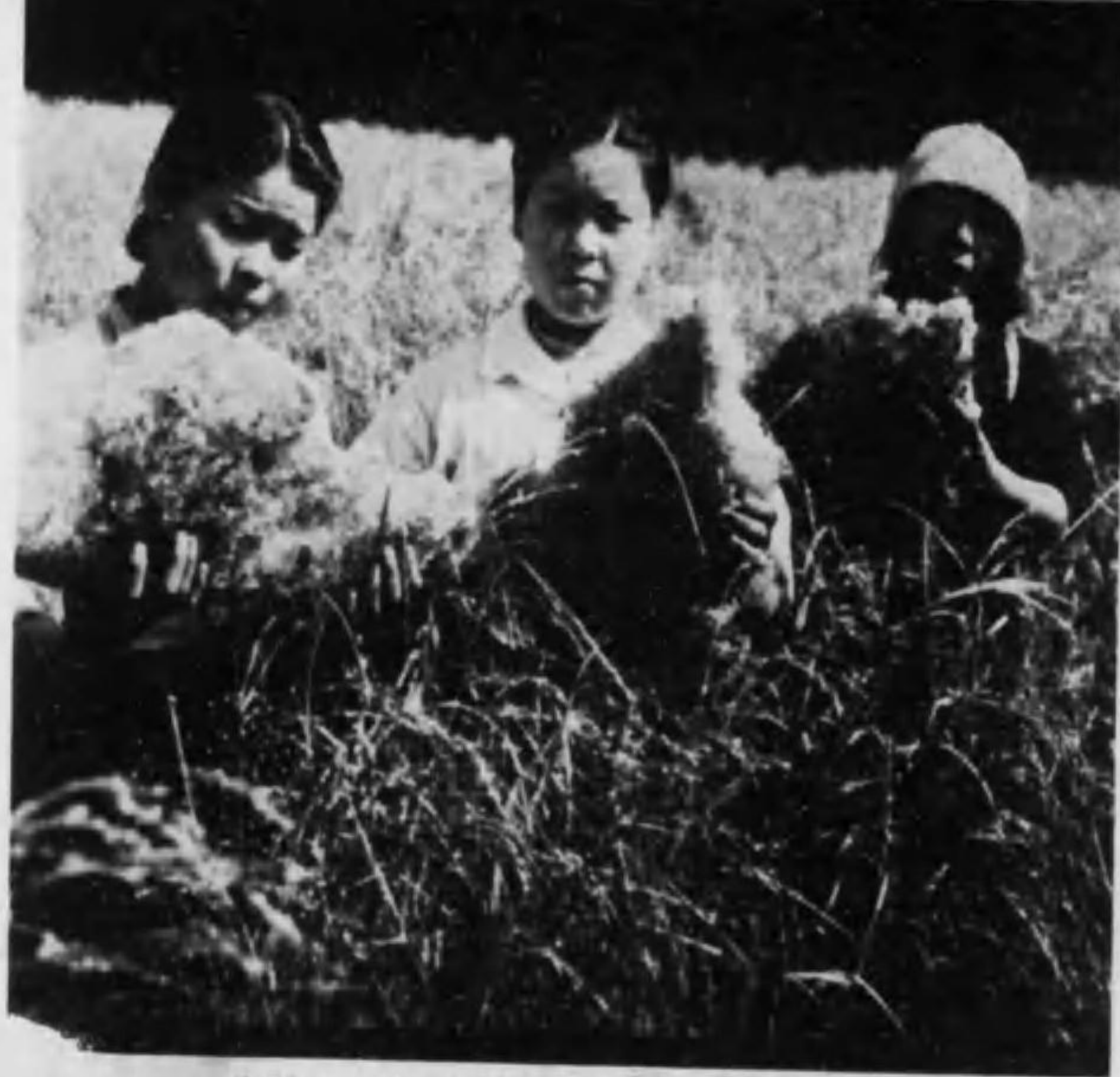
害雹タツ襲ヲ方地生桐多勢リヨ部北郡馬群 (處ルタン出取ヲ塊雹リヨ畑稲陸タツナニ無皆獲收日翌雹害) (影撮手技澤黒) 日八月十年五十和昭 村尾長郡馬群