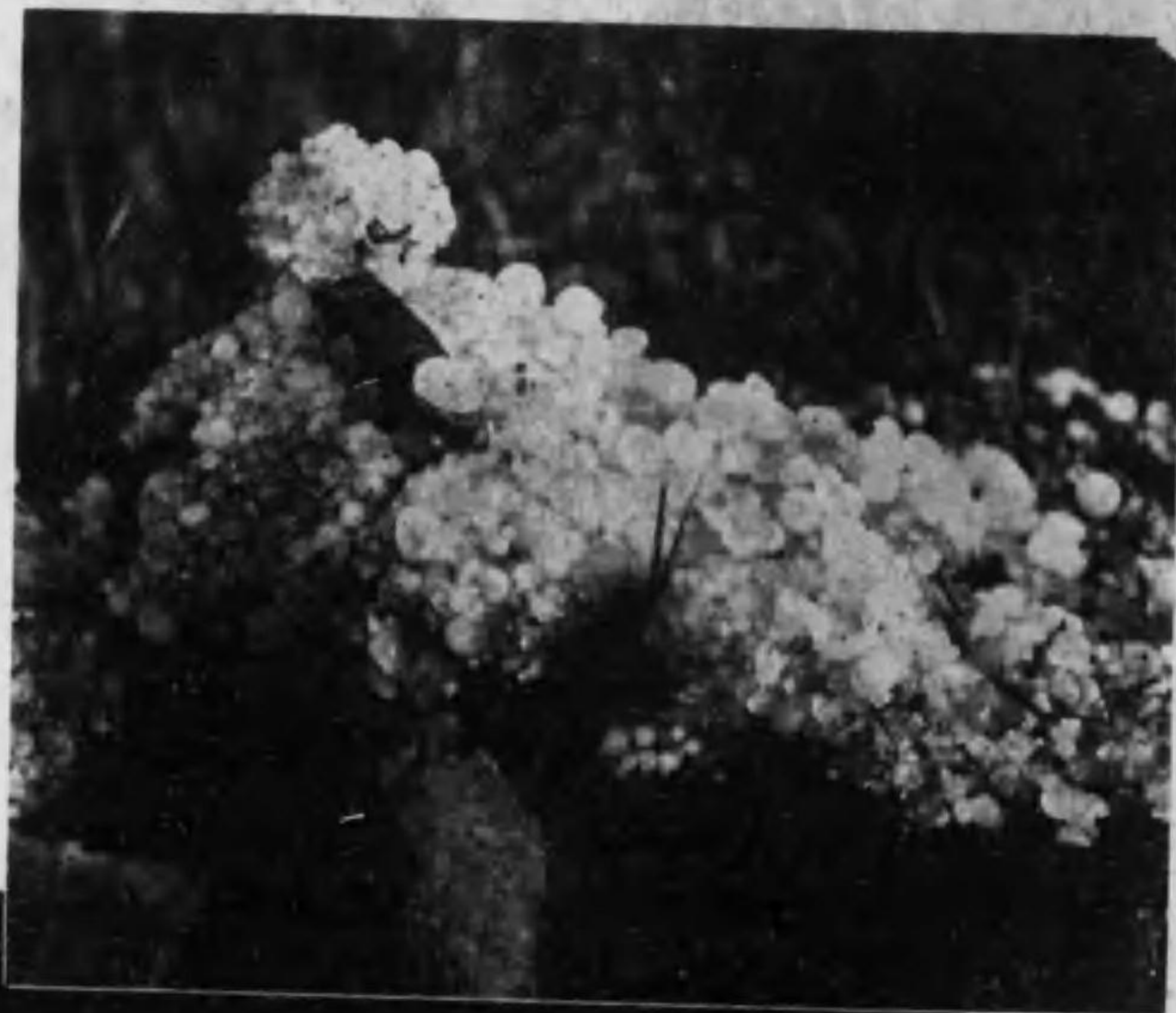
群馬郡下ヲ襲ツタ雹害(雹塊) 昭和十五年六月二十日 於群馬郡箕輪町 (対象物ハ十型ノ時計)