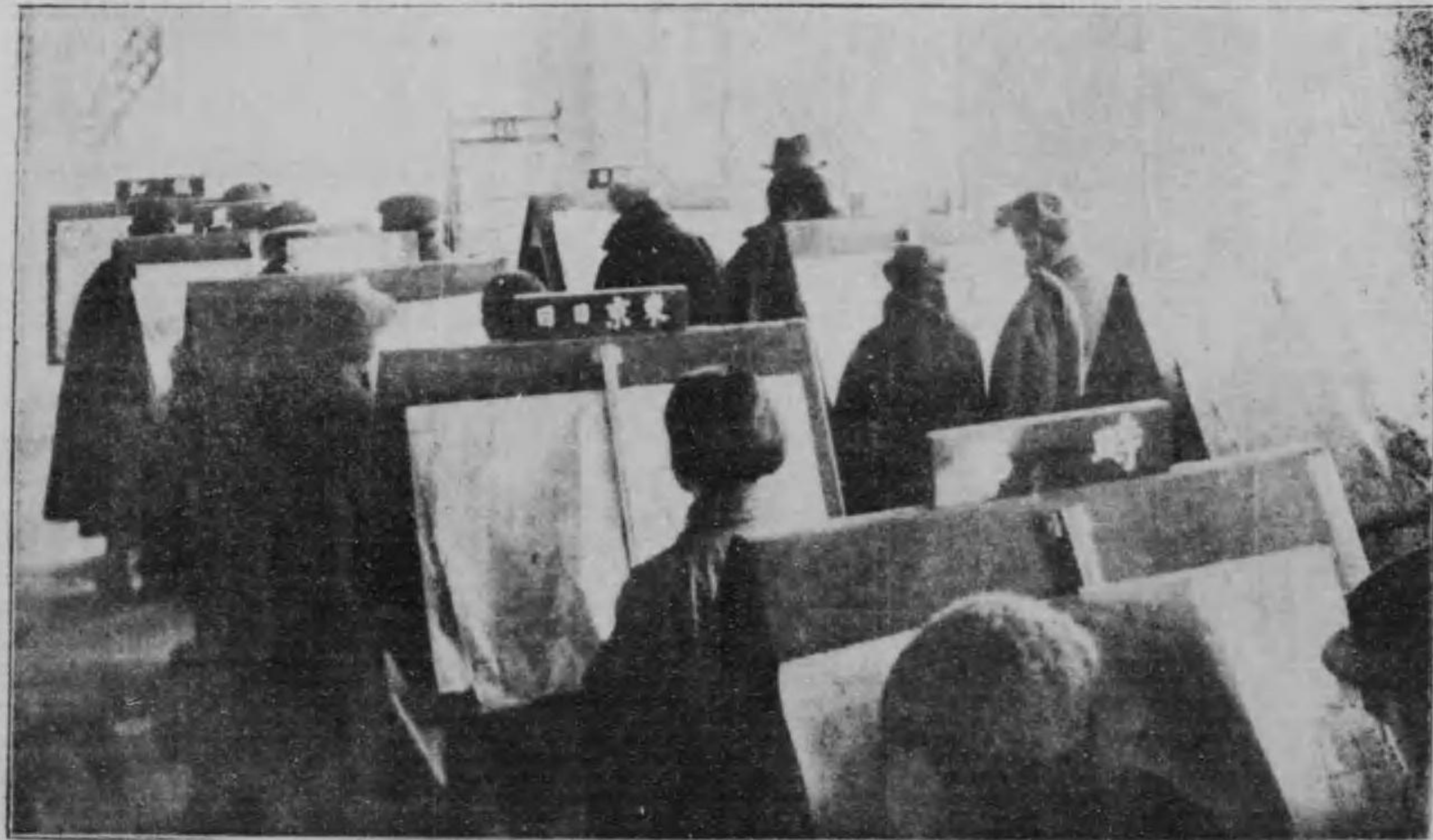
室覽閱新聞館書圖屋古名立市